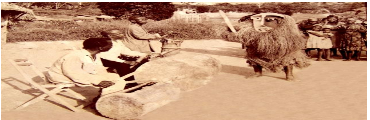
Figure 8 : masque Ekeker

La chorégraphie de la danse des masques est intermittente. Il y a à la fois une chorégraphie informelle et une autre, formelle qui, selon nous, est la plus significative. En fait, cette chorégraphie est celle du danseur masqué, constituée de petites séquences au cours desquels il échange avec le grand tambour qui lui donne le rythme. En fonction du masque porté s’adapte une chorégraphie bien spécifique. Ainsi aura-t-on, une chorégraphie féminine pour les masques de Ngontang et une autre, masculine pour les masques de type Ekĕkĕ chacune d’elle ayant des traits gestuels distinctifs.