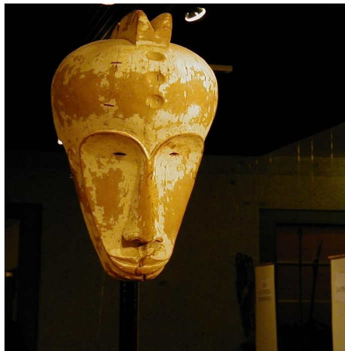
Figure 3 : Le Ngil

l'artiste de vouloir affirmer l'identité fang sur les objets d'arts afin de signifier leur appartenance. En fait, mis à part la représentation de l'esprit habité par le masque, l'artiste dans son travail tient, à travers les formes qu'il utilise, mettre surtout en avant l'identité culturelle du peuple fang ; celle-ci se lit dans chaque élément inscrit sur le heaume et dont la signification renvoie aux croyances auxquelles la communauté fang croit.