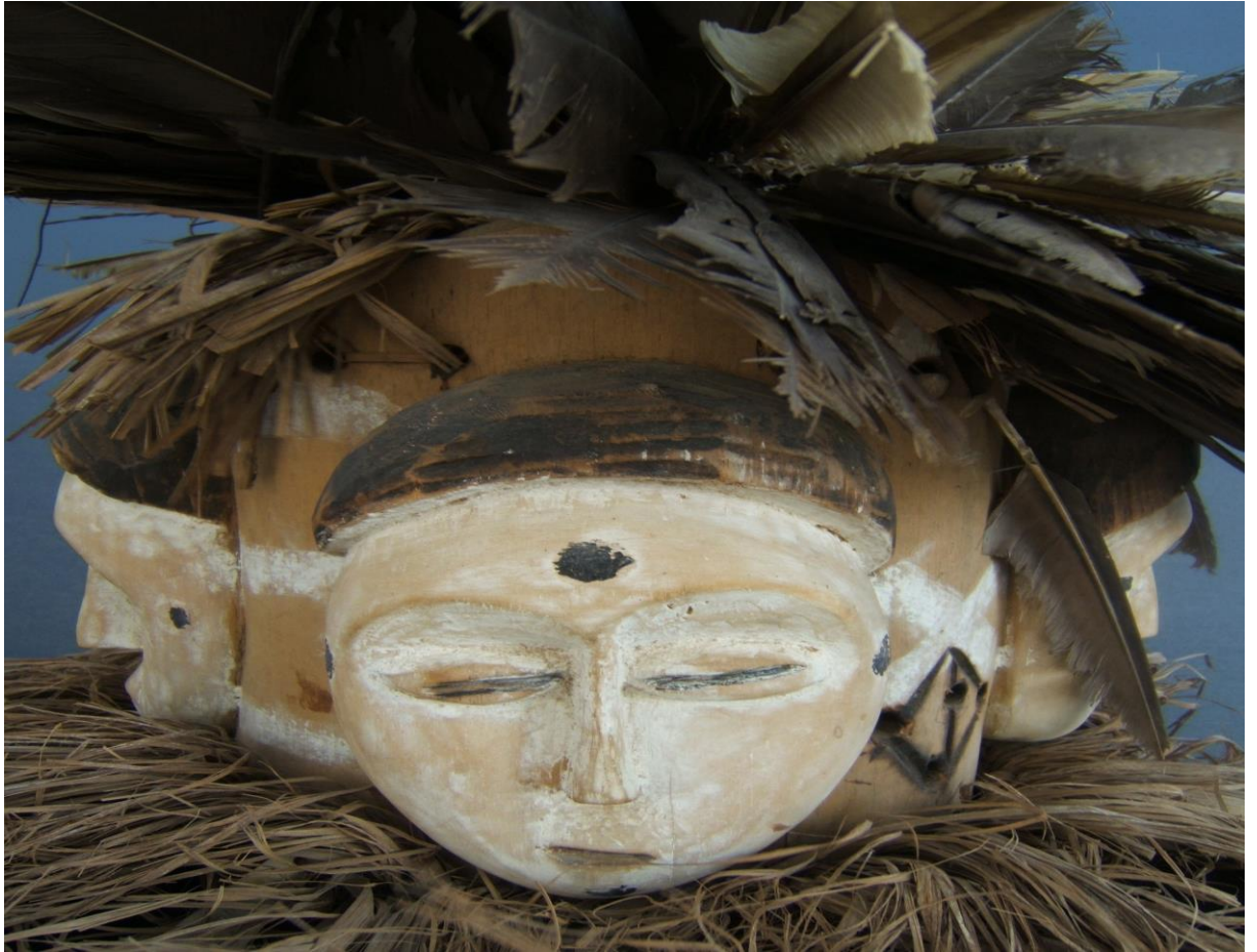
Masque Ngontang à quatre visages