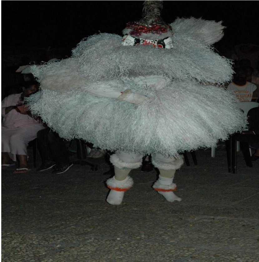
Masque Ngontang, costume