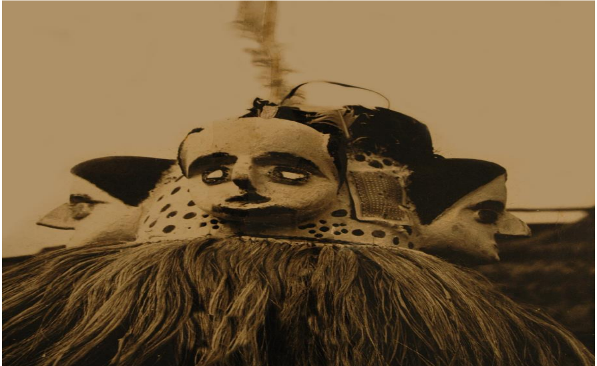
Masque Ngontang à quatre faces distinctes. La face qui est au centre semble être un masque de sexe masculin et les trois autres, des faces féminines au vue de leur chevelure. (Musée national de Libreville)