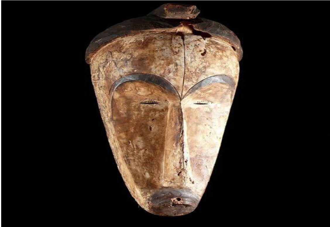
Masque Ngil, musée national de Libreville

Pendant tout le séjour, les futurs initiés vouent un profond respect au Ngil car il leur permet de comprendre les principes de la vie en société. Aussi ce masque les protège-t-il contre tout esprit maléfique qui souhaiterait nuire au rite.