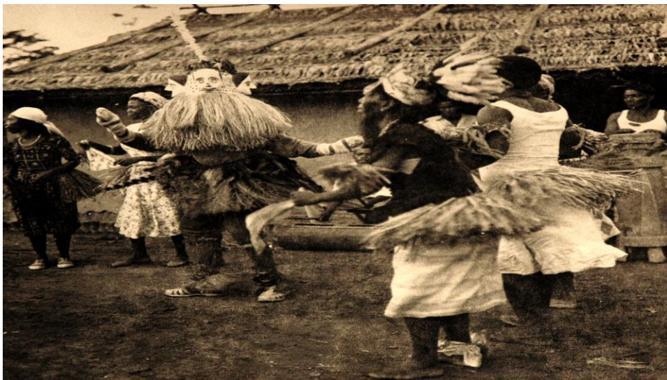
Sortie de masque Ngontang en milieu rural. Sur cette photographie, on peut voir deux groupes distincts, rangés par catégorie de sexe. Les danseurs, eux, aussi portent un costume pendant la pratique. Le masque est au centre de la cour. L'aspect musical est représenté par le joueur de tam-tam( musée national de Libreville)