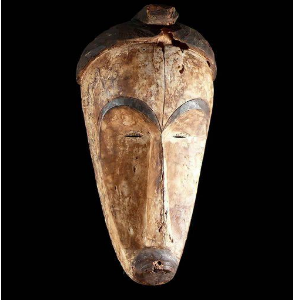
Masque Ngil