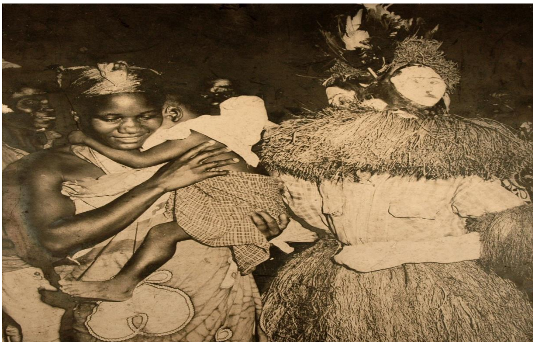
Une femme attrapant sa fillette, effrayée par le masque Ngontang(musée national)