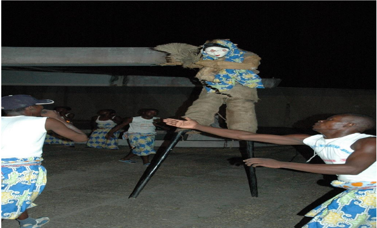
Sortie du masque Mukudji des Bapunus, de nuit. Les couleurs traditionnelles sont bien représentées. on peut voir aussi bien des chorégraphes qu'un chanteur tenant un micro. La pratique ici, est beaucoup plus contemporaine, par la présence d'éléments modernes (le micro).