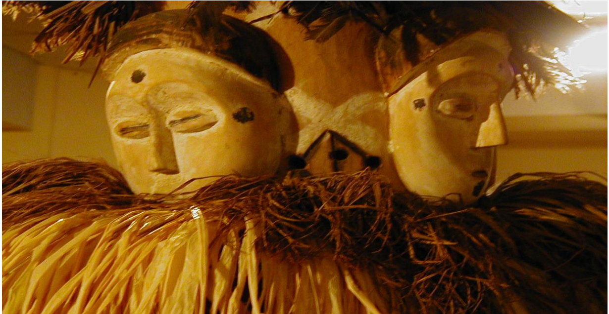
Figure 6 : masque Ngontang

forme ovale des différents visages évoquent le principe créateur féminin. En fait, sur ce Ngontang, on retient comme unique formant d'écriture, la coiffure en croissant de lune.