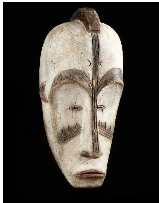
Figure 1 164 : masque Ngil

d'arrière-plan aux objets graphiques 163 . Ce sont elles qui donnent une certaine allure aux masques à première vue et constituent même le niveau de l'expression la plus perceptible avant de se pencher sur les inscriptions présentes sur le support. Ces différentes inscriptions vont être réparties sur le masque de manière à ce qu'elles soient visibles et lisibles. Comment le support formel est-il organisé ?