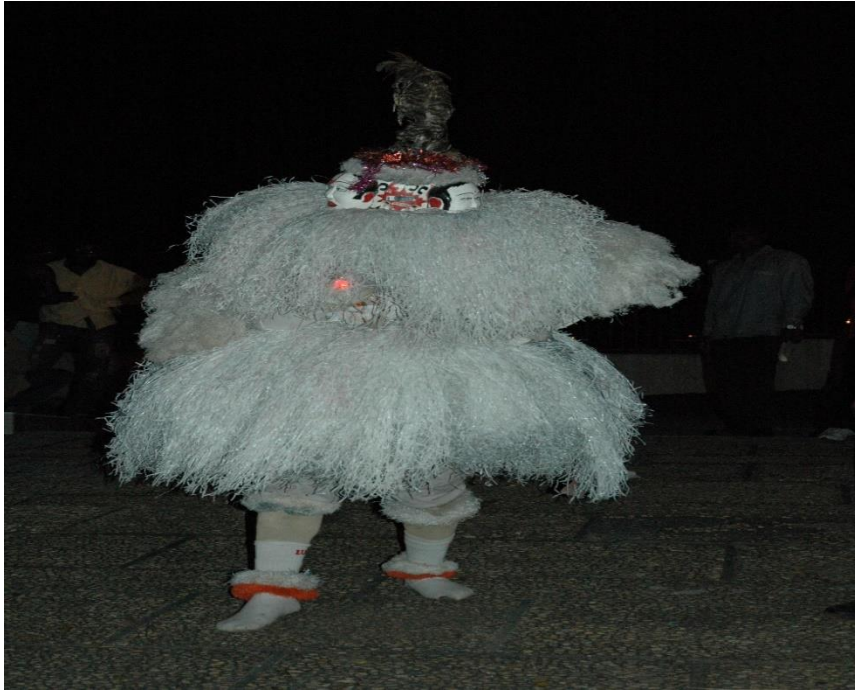
Figure 4 : Masque Ngontang