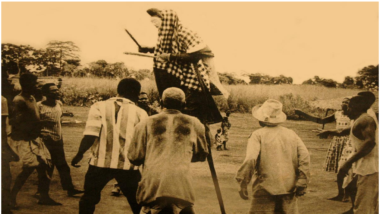
Masque Mukudji du peuple punu, sur des échasses. Le corps du porteur est bien recouvert, de sorte que l'on ne le reconnaisse pas.