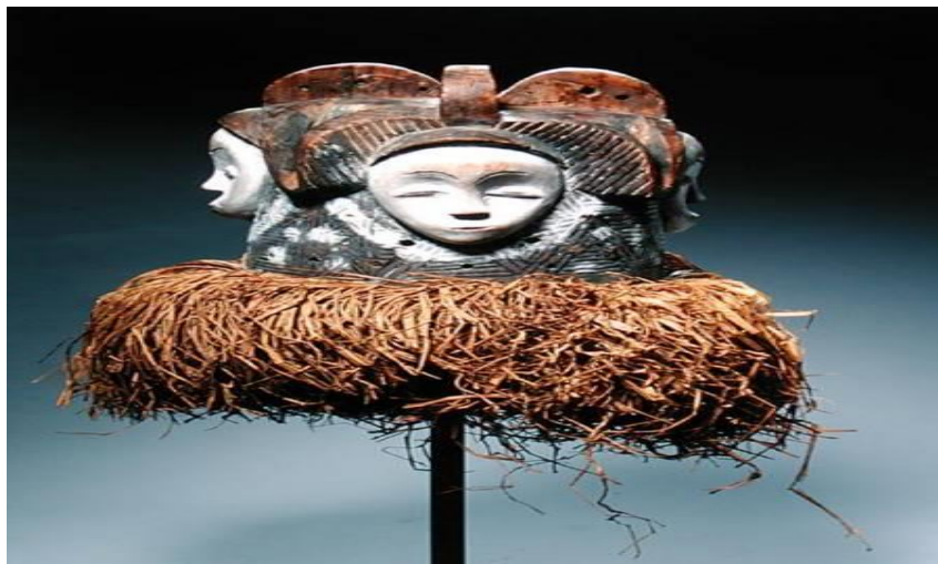
Figure 5 : masque Ngontang

La couleur blanche et la coiffure en forme de croissant de lune mais encore les formes douces et courbes « comme la lune » notamment au niveau des yeux, des sourcils, et de la