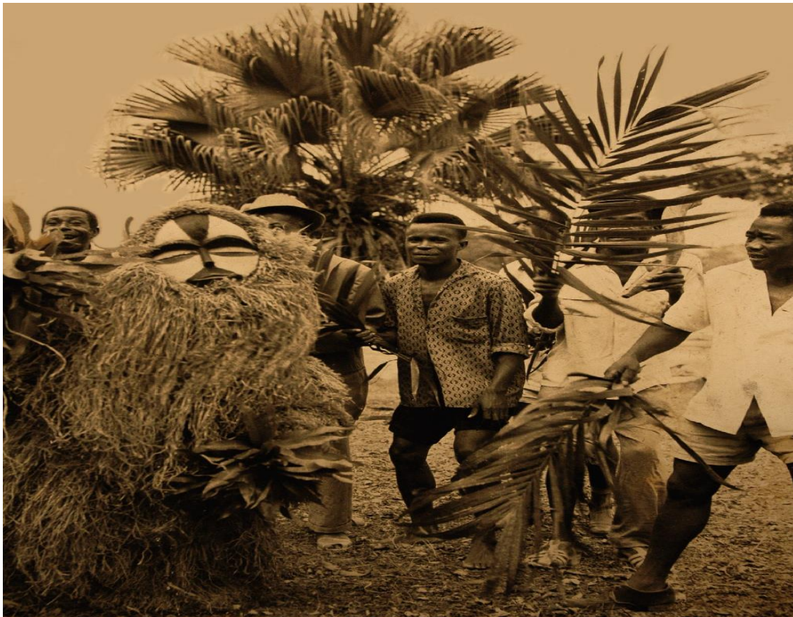
Sortie de masque accompagné par des chanteurs, qui ont pour rôle d'orienter le Masque mais aussi d'exciter ses mouvements au moyen de branches de palmiers (musée national de Libreville)

Nos photographies ont pour source, le musée national du Gabon, situé à Libreville. Certaines ont été prises par monsieur Ludovic Obiang pour avoir été sur place, au Gabon.