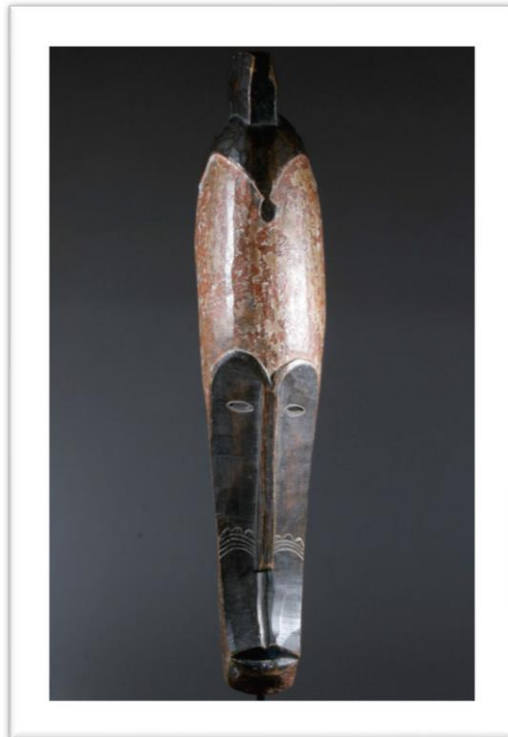
Figure 2 : Masque Ngil

On remarque quasiment les mêmes inscriptions que le premier masque présenté mais avec quelques modifications notamment la direction prise par les lignes constituant les scarifications. Celles-ci sont des courbes tout comme les traces situées au-dessous d'elles. La couleur noire couvre essentiellement le masque, des arcades sourcilières jusqu'au menton avec une délimitation qui met en relief la couleur rouge sur le front. Des scarifications sont apposées sur les joues et nous pensons que celles-ci sont inscrites avant la couleur noire. En fait, nous pouvons voir ici que leur fond laisse entrevoir la couleur du bois utilisé et c'est pour cette raison que les scarifications ont cette teinte, un peu brune. Ces scarifications viennent rompre l'équilibre du support contrairement aux couleurs utilisées par l'artiste-sculpteur dans la mise en forme des masques. Il y a dissonance entre le support (figuratif, puisqu'on reconnaît un visage) et les formants plastiques que sont les scarifications. La nécessité de graver les scarifications peut être perçue/ interprétée comme l'importance de