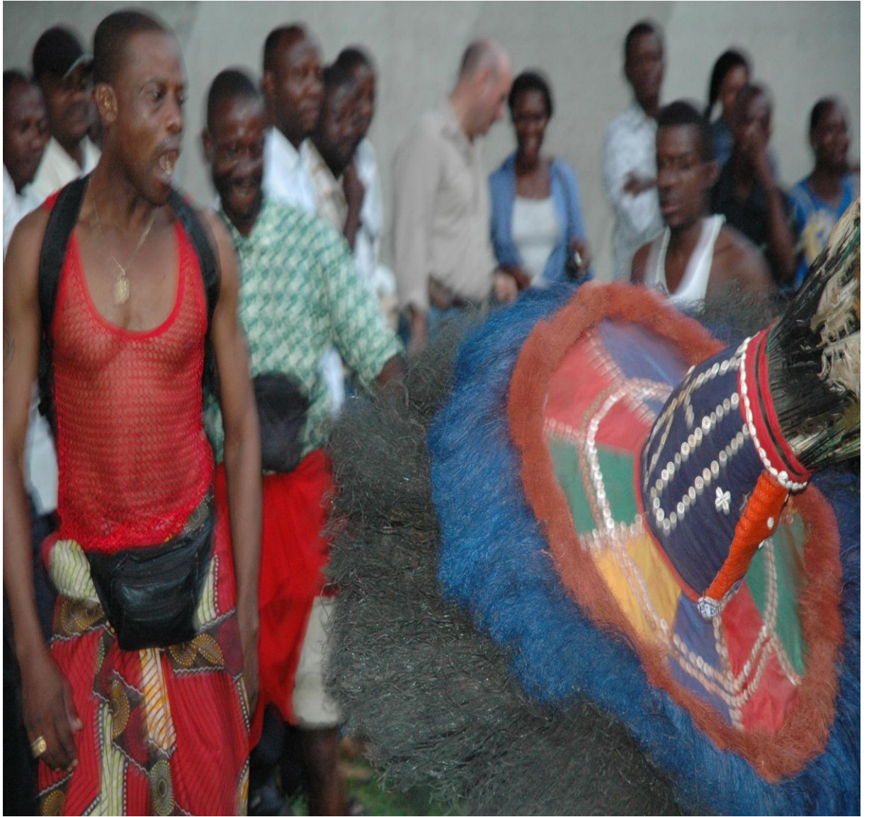
Vu d'ensemble de spectateurs assistant à une cérémonie traditionnelle, faite le jour. C'est une cérémonie de réjouissance