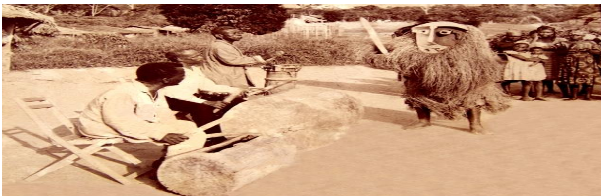
Figure 8 : masque Ekeker

La chorégraphie de la danse des masques est intermittente. Il y a à la fois une chorégraphie informelle et une autre, formelle qui, selon nous, est la plus significative. En fait, cette chorégraphie est celle du danseur masqué, constituée de petites séquences au cours desquels il échange avec le grand tambour qui lui donne le rythme. En fonction du masque porté s’adapte une chorégraphie bien spécifique. Ainsi aura-t-on, une chorégraphie féminine pour les masques de Ngontang et une autre, masculine pour les masques de type Ekĕkĕ chacune d’elle ayant des traits gestuels distinctifs.