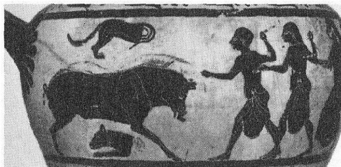
Figure 10 : représentation de chien coupé en deux

On retrouve aussi l'utilisation du chien dans d'autres contextes que celui de la religion : l'armée macédonienne passe durant la fête de Xanthos entre deux moitiés de chien, placées de chaque côté de la route 646 . Cette zone d'absorption permet de purifier la phalange puisque le chien attire les choses impures 647 . Cet étrange rite peut se rapprocher d'une peinture sur une hydrie de Caere à figures noires, représentant une chasse au sanglier, avec un chien coupé en deux (figure 10) 648 .