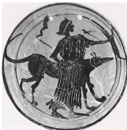
Figure 9 : Artémis Enodia

Enfin, les deux divinités partagent une association commune avec Enodia, déesse des routes 612 , et la portent chacune en épiclèse 613 . A. Zografou parle d'ailleurs d'une dédicace de Lartos, sur l'île de Rhodes, datant du III e s. av. J.-C., accompagnant un trône : l'objet appartient à une déesse Έννοδία, tandis qu'à Rhodes, Hécate est souvent identifiée à Artémis. Leur iconographie, tout comme leurs champs d'action (les routes, les points de passage) est très proche. Sur un disque de l'Université de Tübingen (figure 9), Artémis est identifiée comme Enodia 614 , tenant, dans une main, un arc et un carquois, et, dans l'autre, une torche. Près d'elle, marche un chien. L. Kahil répertorie dans le LIMC quelques représentations de cette divinité 615 , souvent accompagnée d'un chien ou d'un cheval, et tenant un flambeau.