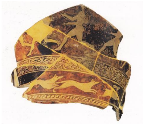
Figure 3 : fragments de cratériskos avec des petites filles en train de courir

Très peu d'informations sont parvenues à propos du déroulement rite : des mentions dans les textes 510 , dont le passage de Lysistrata d'Aristophane, une série de fragments de céramique et des statues d'enfants. En effet, des petits vases en forme de cratère, appelés cratériskes, ont été retrouvés en Attique : les scènes peintes sur ces fragments représentent des fillettes, nues ou vêtues d'une tunique courte, en train de courir, danser ou défiler (figures 3 et 4) autour d'un autel, certaines d'entre elles portant des objets : des couronnes et des guirlandes.