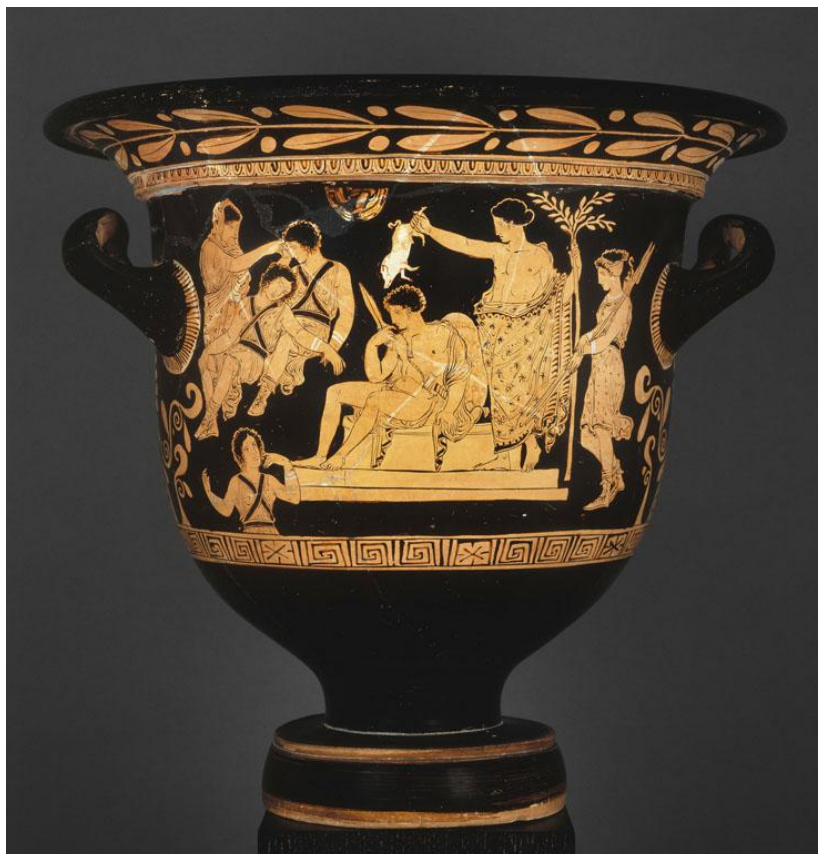
Figure 17 : Purification d'Oreste

K. Clinton rajoute à ce témoignage une inscription provenant de Cos, qui explique qu'un porcelet a été égorgé autour du purifié 1233 . Sur un cratère apulien à figures rouges (figure 17), Oreste, après avoir tué sa mère ainsi que l'amant de cette dernière, se réfugie sur l'île de Délos 1234 . Artémis est présente, de même qu'Apollon, qui va procéder à la purification d'Oreste par le biais du porcelet qu'il tient au-dessus de sa tête. Sur l'urne Lovatelli, Héraklès, pour se racheter du meurtre du centaure, sacrifie un porc sur un autel 1235 .