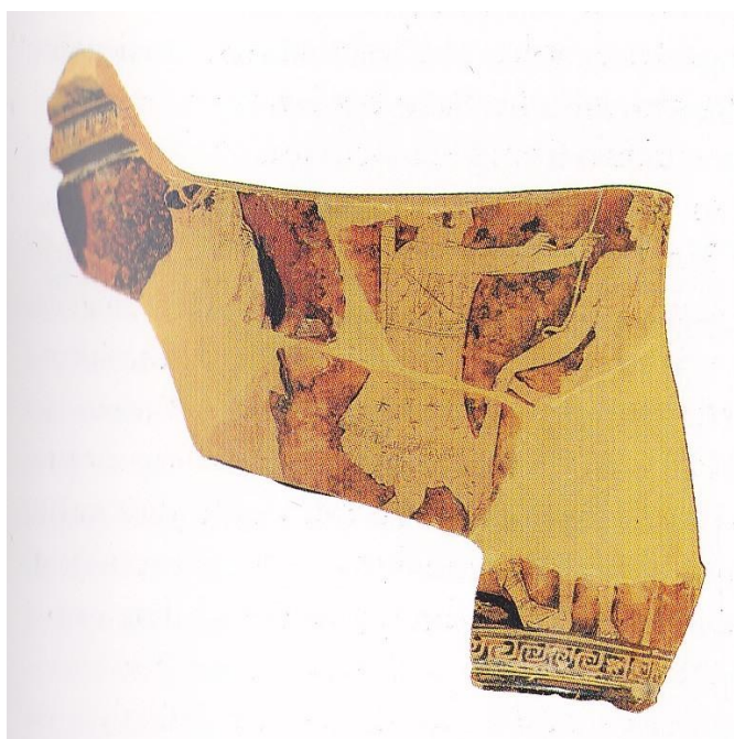
Figure 5 : fragments de cratéristique avec Artémis, Apollon et Léo

rituel, chaque mère s'occupant de sa fille et la préparant à la course qui va suivre 515 . En effet, une femme ajuste le vêtement d'une fillette plus jeune, tandis qu'une autre tient des branches de laurier et demande la protection d'Apollon. À droite, une dernière femme porte une corbeille. Trois autres fillettes sont également présentes. Sur la face B de ce même vase, quatre petites filles courent vers la droite, exécutant le rituel 516 tout en s'éloignant de l'ours. Sur d'autres fragments (figure 3), les filles sont nues. Les présences divines (figure 5), ainsi que les personnages masqués (pl. 73.3), sont quant à eux difficiles à interpréter 517 . L. Kahil les voit comme une représentation des mystères du rite dont parlent les textes. La triade sacrée incarnerait, à travers la chasse sacrée d'Artémis, le domaine des dieux invisible aux yeux des mortels, tandis que les masques figureraient le rituel réel de l'arkteia , « faire l'ourse », faisant prendre aux personnages l'aspect d'un ours 518 . La prêtresse, représentée de face, est en effet tournée vers les croyants. E. Simon et P. Brulé voient plutôt ces scènes comme étrangères à la religion brauronienne et se rapportant plutôt au mythe de Callisto 519 , dont il est question plus tard 520 .