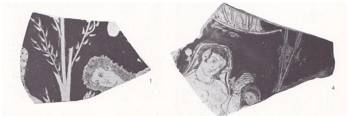
Figure 12 : fragments de vases représentant Callisto

Irving analyse cette prise de position de Callisto comme une isolation de la famille et un statut de parthénos à vie 745 . Cette mise à l'écart se retrouve dans d'autres parties du mythe : Callisto est chassée par Artémis de sa troupe puis séparée de son enfant, lequel est confié à une autre femme. Enfin, après sa mort, elle devient par la volonté de Zeus une constellation, soumise à une isolation perpétuelle 746 .