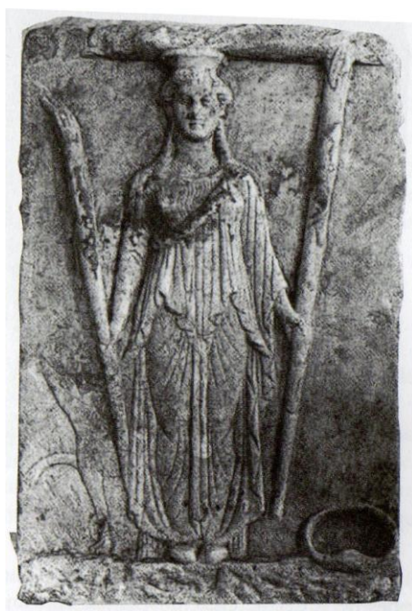
Figure 7 : bas-relief en marbre d'Hécate

À Teuthrone, deux trouvailles suggèrent un temple à Artémis 602 : un relief montrant la divinité en présence d'un chien, ainsi qu'un autel décoré sur ses quatre faces d'une chèvre, d'un chien, de flambeaux et d'une dédicace. Compte tenu du caractère chthonien des représentations, Artémis a probablement été associée à Hécate dans ce sanctuaire 603 . En effet, le type iconographique de porteuse de torches rapproche les deux déesses 604 (figures 6, 7 et 8), renforcé par la présence d'un chien 605 . Sur un relief du musée national archéologique d'Athènes, Artémis, qualifiée d'Hécate, est représentée assise sur un rocher, un flambeau dans chaque main. Près d'elle, est installé un chien 606 . Si l'animal est un accompagnateur incontournable d'Artémis,