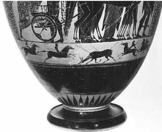
Figure 14 : une chasse au cerf sur une peinture de vase

plusieurs lances et encerclé par quatre chasseurs à cheval. La chasse au lion se distingue quant à elle des autres pratiques puisqu'elle est considérée comme une épreuve solitaire, héroïque et la plupart du temps royale 1191 .