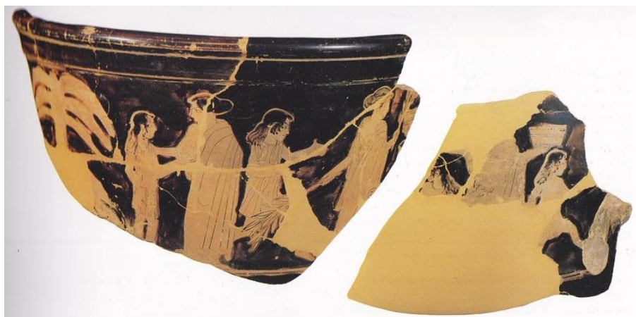
Figure 4 : fragments de cratériskos avec des jeunes filles et des femmes

Les personnages sont représentés avec des tailles et des coiffures différentes, permettant de reconnaître les plus jeunes des filles mais également les femmes adultes qui les surveillent 511 .