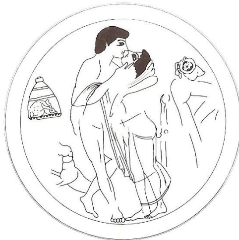
Figure 13 : représentation d'un éraсте et d'un éromène

Sur le médaillon de la coupe en figure 13, un couple homosexuel est en train de s'embrasser. Derrière eux, un petit lièvre est enfermé dans une cage : c'est le cadeau que l'éraсте a fait à l'éromène, ce dernier acceptant de ce fait la relation.