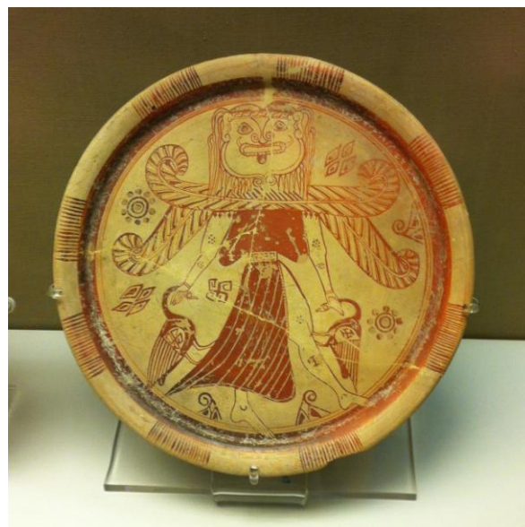
Figure 11 : la Gorgone représentée en Pótnia Théron

Parmi les créatures mythologiques, la Gorgone se retrouve offerte sous différentes formes, à l'époque archaïque, exclusivement dans 4 sanctuaires d'Artémis : elle orne les métopes et les frontons des temples (pl. 3.1), est dépeinte sur des reliefs ou est déposée sous forme de figurine et de masque. Ce qui frappe le plus chez cet être hybride, c'est sa face monstrueuse qui, exposée directement sur les bâtiments religieux, protège les lieux 721 et avertit les visiteurs qu'elle a le pouvoir de mort sur eux 722 . Tout comme la Pótnia Theron et Artémis, la Gorgone est associée à la fois à la destruction et la création, puisqu'elle symbolise la fertilité 723 . À ce titre, elle emprunte à la Pótnia la même iconographie qui caractérisait Artémis : debout, ailée, tenant des animaux dans ses mains 724 . Sur le vase François 725 , les deux entités sont représentées en opposition sur les faces interne et externe des deux anses 726 . C'est aussi en Maîtresse des Animaux que la Gorgone se présente sur une assiette à figures rouges conservée au British Museum (figure 11) : elle porte sur ses épaules et sur son dos deux paires d'ailes et tient deux oiseaux au long cou dans ses mains. En plus de leurs caractéristiques, la Gorgone reprend ainsi les mêmes codes iconographiques qu'Artémis et la Pótnia 727 aux VII e et VI e s. av. J.-C. Il existerait même une Artémis Gorgo à Messène mais L. Piolot pense qu'il s'agit d'un titre fantôme 728 .