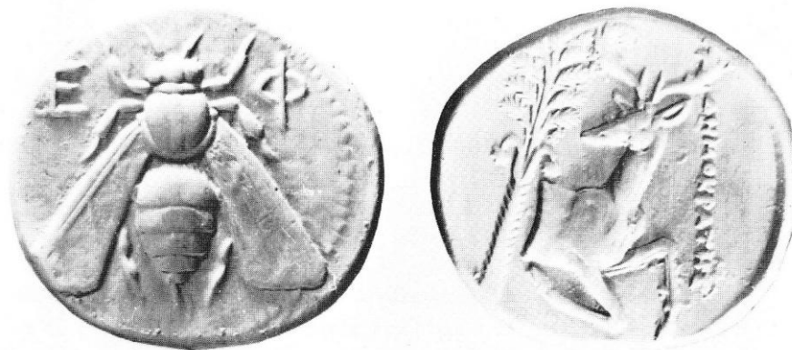
Figure 16 : tétradrachme d'Éphèse

Le tétradrachme (figure 16) montre sur son avers une abeille et son revers un avant-train de cerf ainsi qu'un palmier, deux attributs d'Artémis chasserresse. F.E. Brenk, dans son article à propos de l'Artémis d'Éphèse, propose une « hellénisation » de la déesse anatolienne présente avant Artémis dans la ville, avec laquelle elle n'a plus fait qu'un par la suite 1017 . La monnaie incarnerait donc les deux faces de la divinité à ce moment précis, ainsi que toute la complexité de sa personnalité 1018 .