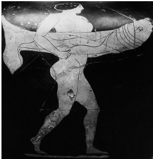
Figure 2 : femme tenant un phallus lors de la procession des Haloa

Selon B. Johnson, le poisson est dans l'Antiquité un symbole de fertilité car sa forme évoque à la fois un phallus (le corps) et une vulve (la queue). Cette interprétation est illustrée notamment sur un fragment de vase mycénien provenant de Tyrinthe, où un poisson, dessiné en forme de losange, placé entre les pattes d'un cheval et tourné vers les organes génitaux de ce dernier 446 , évoque une volonté de fertilité. De plus, pendant la fête des Haloa, en l'honneur de Déméter et Dionysos et proche des Thesmophories, les femmes portaient de coquilles Saint-Jacques, qui rappellent la vulve, et des phallus pendant la procession 447 . Sur une peinture de vase du V e av. J.-C. (figure 2), une femme tient un de ces organes génitaux masculins, lequel ressemble à un poisson puisque le phallus est pourvu d'un œil.