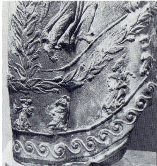
Figure 15 : fragment de voile de Despoina

après des chercheurs : selon M. Jost, il s'agirait de prêtres 1100 , selon P. Perdrizet des dieux 1101 , tandis que S. Voegtle en fait des outils de communication avec la divinité vénérée 1102 .