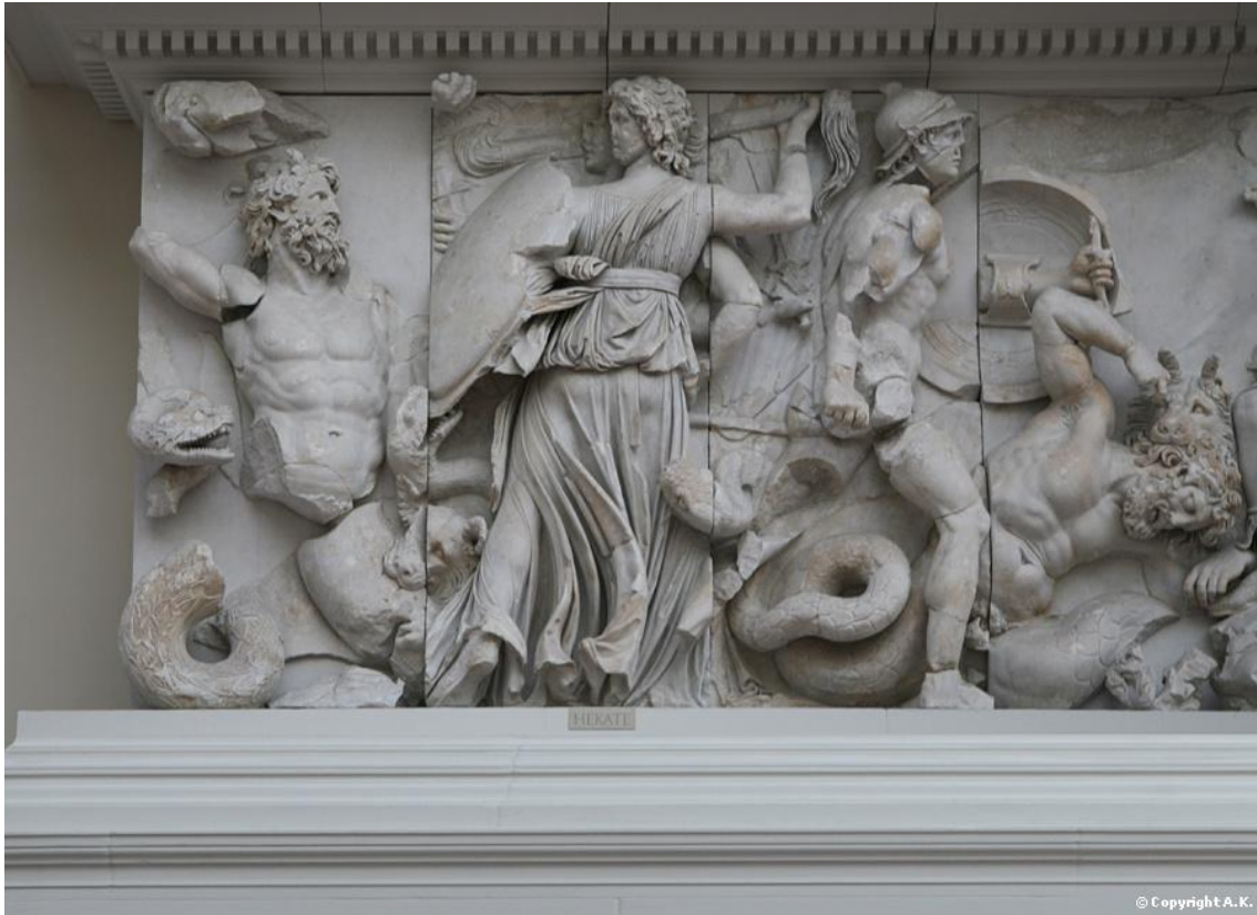
Figure 8 : la triple Hécate contre les géants

déesse de la chasse, il est aussi aux côtés d'Hécate, comme sur le bas-relief (figure 7). Nonnos de Panopolis qualifie d'ailleurs la déesse de κύων, « chienne », σκυλακοτρόφος 607 , « nourrice de chiots » et note son plaisir à entendre le jappement des chiens la nuit. Hécate est quelques fois représentée avec une tête de chien 608 . Sur un lécythe datant de 470 av. J.-C., un personnage dont le corps est celui d'une femme sur lequel sont greffés deux chiens est représenté 609 , souvent désigné comme étant Hécate 610 . Sur la frise de l'autel de Zeus de Pergame (figure 8), la déesse est présente lors de la gigantomachie sous sa triple forme (dont seulement deux sont visibles), brandissant des torches enflammées et accompagnée d'un chien en train de mordre un géant. Derrière elle, se tient Artémis, également assistée d'un canidé.