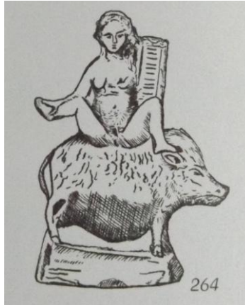
Figure 1 : figurine en terre cuite de femme assise sur un cochon

Le récit de Clément d'Alexandrie fait également le lien entre la précipitation des porcelets et la manière dont a été enlevée Korè par Hadès. Nouvellement mariée au dieu, elle a été emmenée dans le monde souterrain, dans lequel elle est destinée à vivre la moitié de l'année. Elle symbolise alors le grain qui doit aller sous terre et dont germera un nouveau fruit 410 . La relation entre les profondeurs de la terre et le renouvellement des récoltes, et par extension, du cycle de la vie, est à nouveau présente. Ainsi, le succès et la popularité des Thesmophories à travers la Grèce sont dus au fait que la fête est dédiée à la fertilité aussi bien des femmes que des champs, assurant ainsi dans les deux cas la prospérité de la cité. Il est pertinent de noter également que le terme χοῖρος, utilisé pour désigner un cochon à n'importe quel âge de sa vie, désigne également le sexe d'une jeune fille 411 . Cette connotation sexuelle est évoquée dans les Thesmophories par le désir de fertilité mais également par les gâteaux en forme de phallus déposés au fond des fosses. W. Burkert voit dans ce double emploi du mot grec une sorte de sacrifice anticipatoire de la jeune fille (par le mariage) à travers celui du porc. En effet, le mot korè signifie aussi bien « la jeune fille » avant son mariage que la fille de Déméter, enlevée par Hadès et qui, à travers son union avec le dieu, est morte : Korè change alors de nom et devient Perséphone 412 .