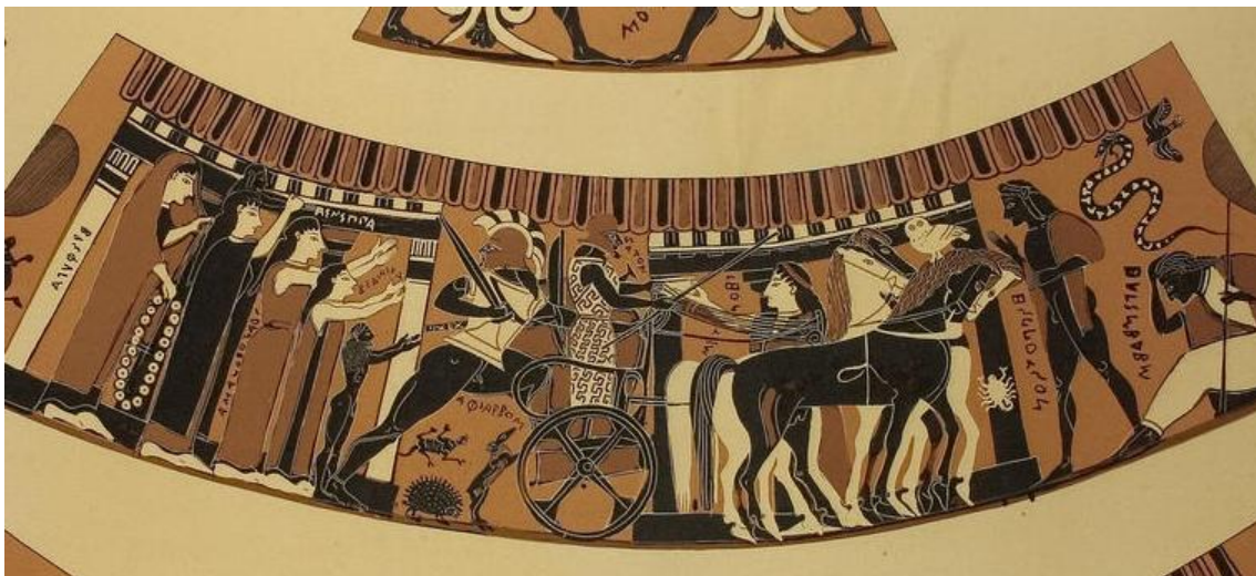
Figure 18 : Le départ d'Amphiaraos

L'animal est présent chez Artémis dans deux sanctuaires bien spécifiques où sa personnalité est complexe : Sparte ( A-Lac3 ) et Éphèse ( A-Ion1 ). La déesse y est notamment assimilée à la Pótnia Théron et y reçoit des offrandes précieuses représentant une grande variété d'animaux. Le pendentif et le vase plastique semblent se noyer dans la masse des autres objets, et n'ont pour signification que l'animal en lui-même, offert à une divinité qui le maîtrise. Callimaque cite d'ailleurs le porc-épic comme proie de la chasse d'Artémis 1308 .