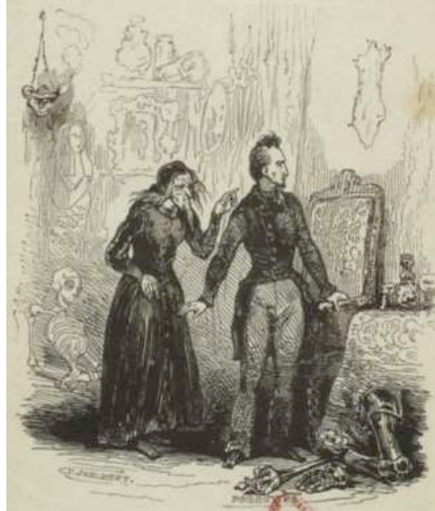
Figure 2 : Citation de Sterne ( ibid. )