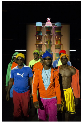
@Christophe Raynaud de Lage