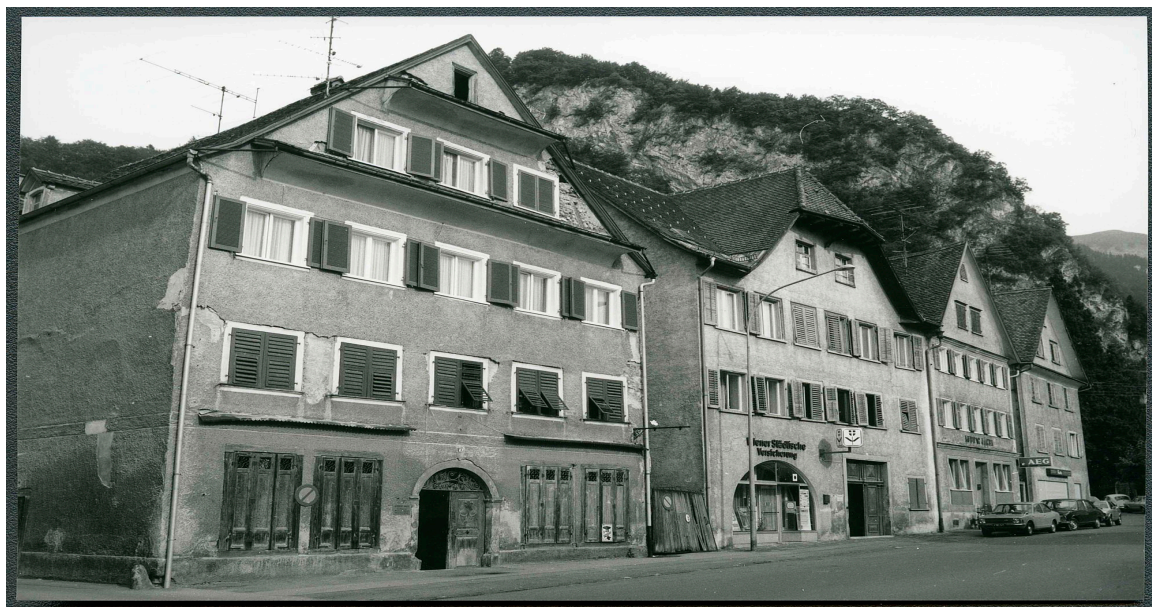
Maisons n° 8, 6, 4, 2, 1970.