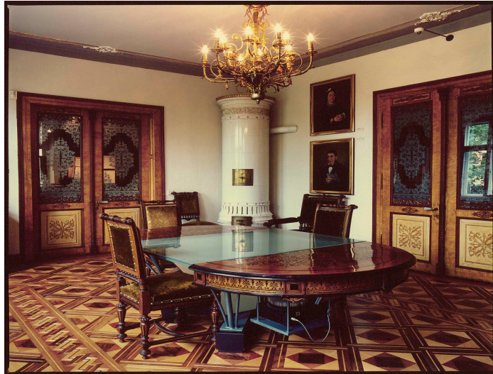
Salon de la villa Heimann-Rosenthal, environ 1995.