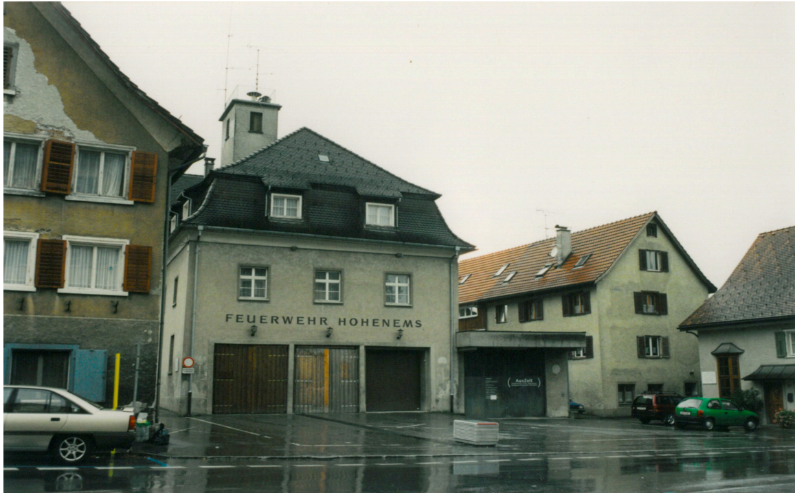
Caserne des pompiers – ancienne synagogue, 2001.