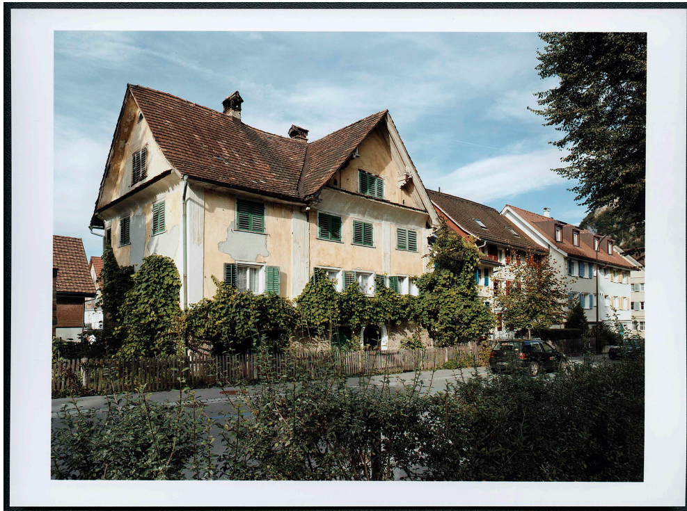
Jakob-Hannibal Straße, 2006/2007.