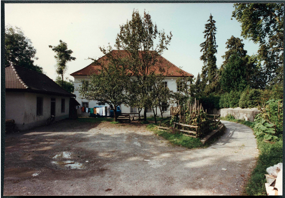
Mikvé (à gauche) et ancienne école juive (au fond), 1990.