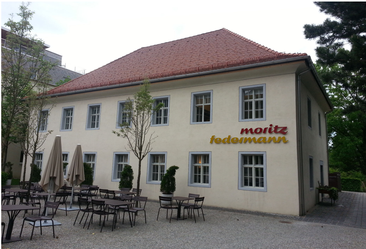
Federmann Kultursaal, restaurant Moritz dans le bâtiment de l'ancienne école juive