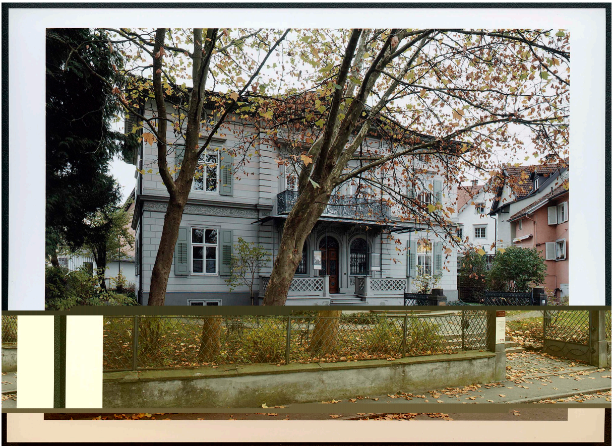
Villa Heimann-Rosenthal, musée juif, 2006.