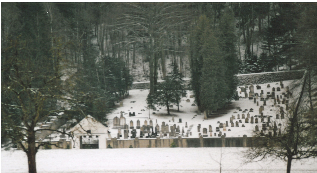
Vue d'ensemble, hiver 2009.