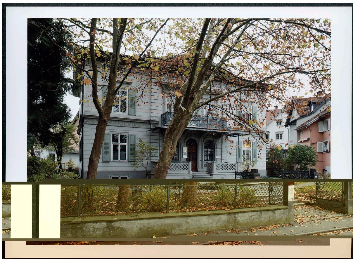
Villa Heimann-Rosenthal, musée juif, 2006.