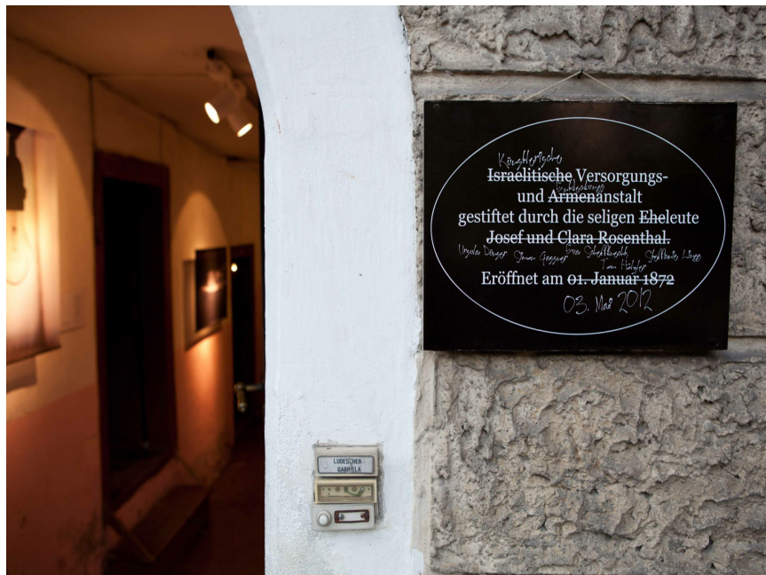
Entrée de l'ancienne maison des pauvres lors d'un projet artistique à l'occasion du festival Emsiana 2012.