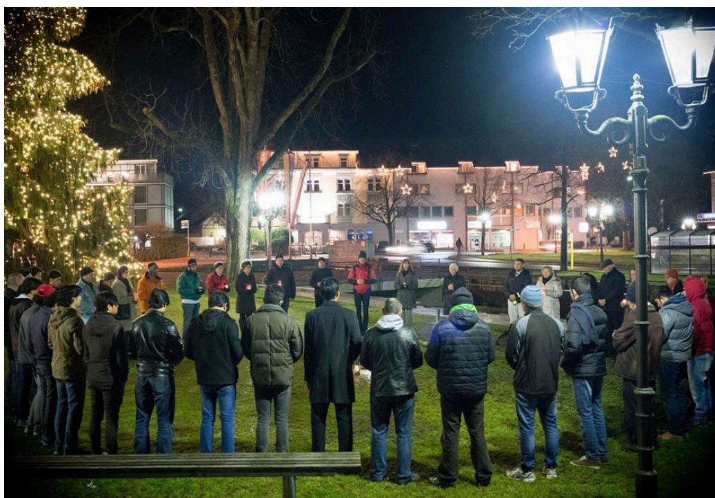
Schweigen für den Frieden, Schlossplatz Hohenems, 2016