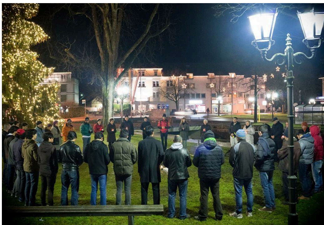
Schweigen für den Frieden, Schlossplatz Hohenems, 2016