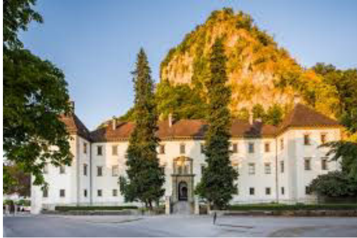
Le palais au pied du Schlossberg