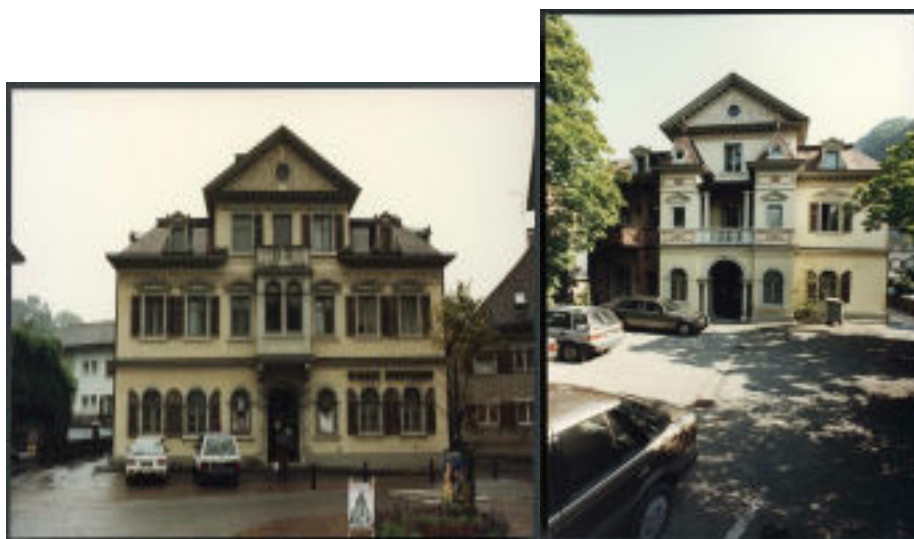
Villa Arnold Rosenthal, 1990.