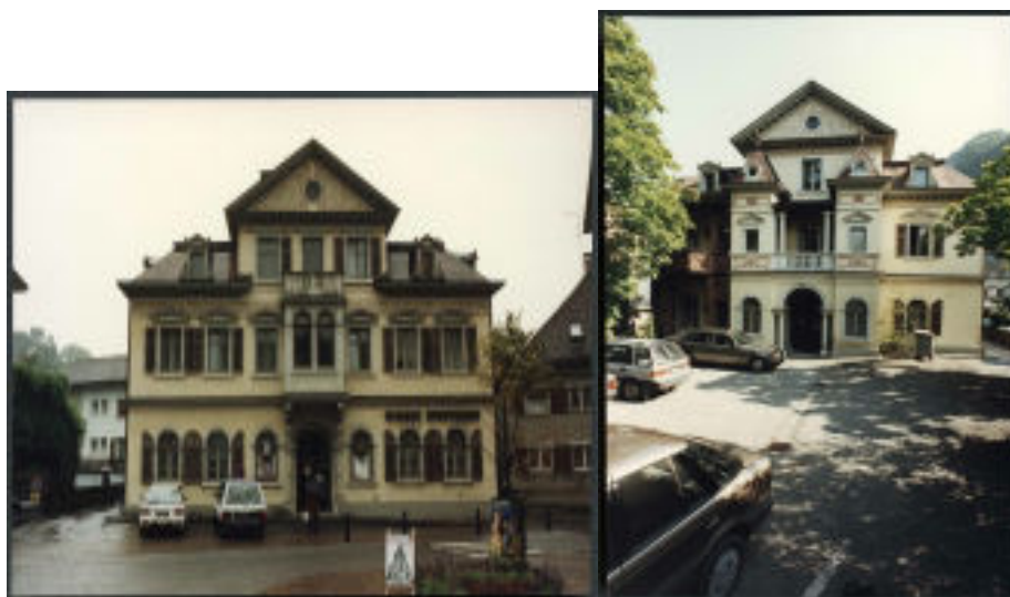
Villa Arnold Rosenthal, 1990.