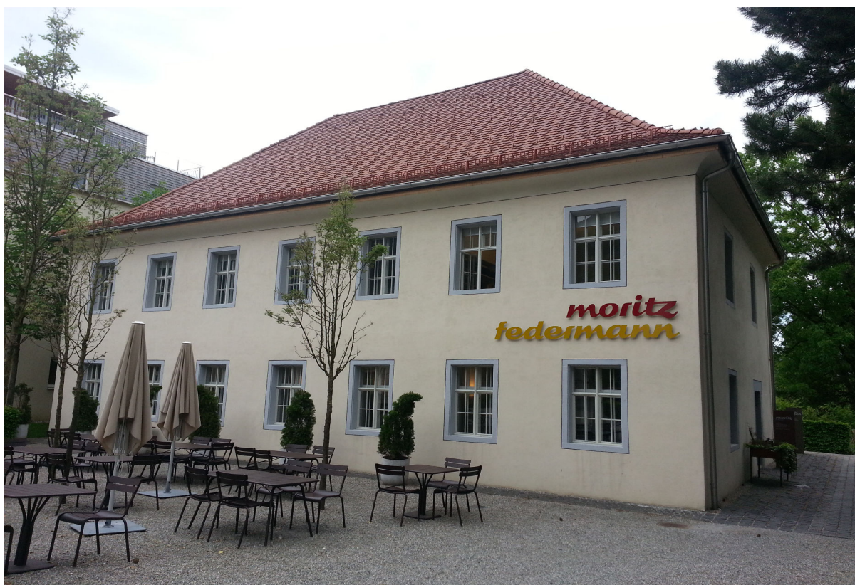
Federmann Kultursaal, restaurant Moritz dans le bâtiment de l'ancienne école juive