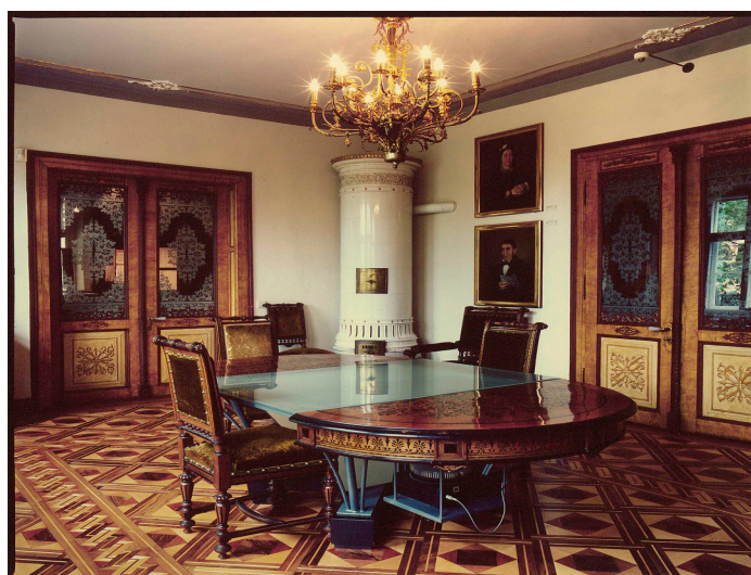
Salon de la villa Heimann-Rosenthal, environ 1995.