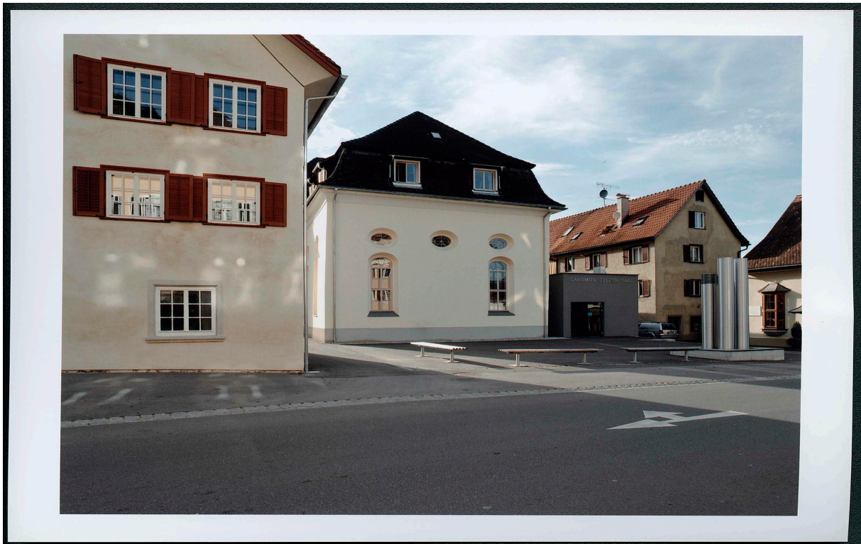
Ancienne synagogue actuellement salle Salomon Sulzer (à droite), 2006/2007.