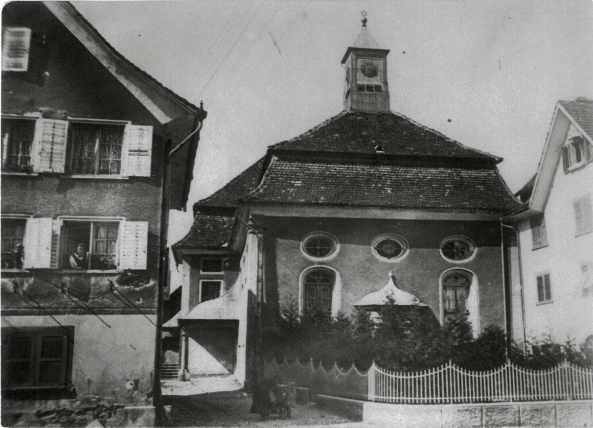
Synagogue de Hohenems, environ 1930.