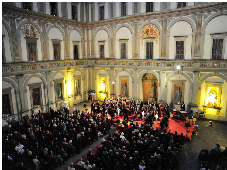
L'orchestre Arpeggione dans la cour du palais

https://www.hohenems.at/de/wirtschaft/tourismus/sehenswuerdigkeiten/renaissance-palast [consulté le 25. 10. 2016].