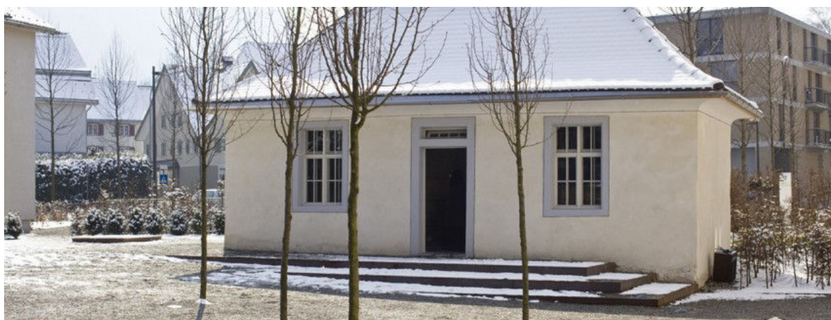
Le mikvé restauré

http://www.erlebnis-hohenems.at/gastronomie/gastro/show/restaurant-moritz/ [consulté le 25. 10. 2016].