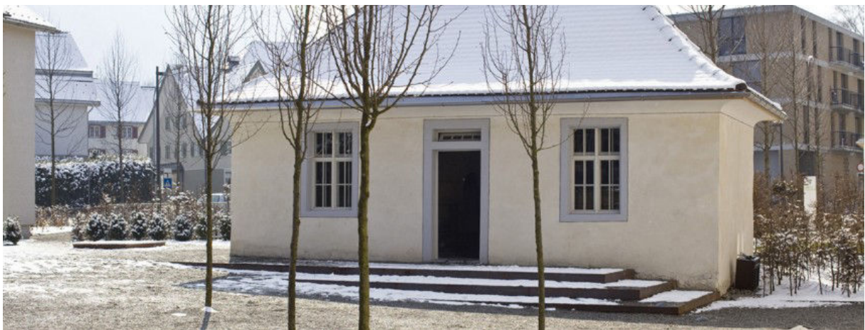
Le mikvé restauré

http://www.erlebnis-hohenems.at/gastronomie/gastro/show/restaurant-moritz/ [consulté le 25. 10. 2016].