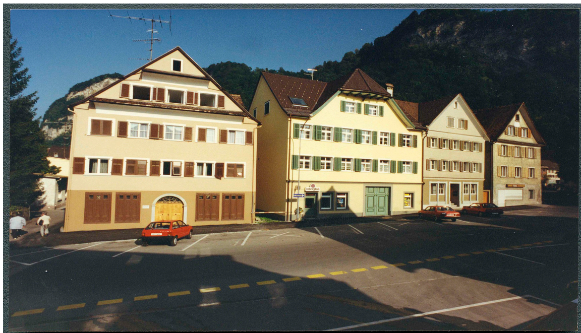
Maisons n° 8, 6, 4, 2, 1990.