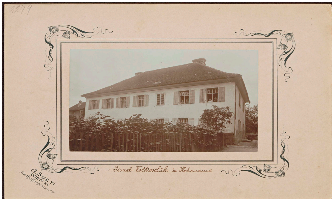
Façade de l'école juive, Aron Tänzer (à gauche), Moritz Federmann (à droite), environ 1900.