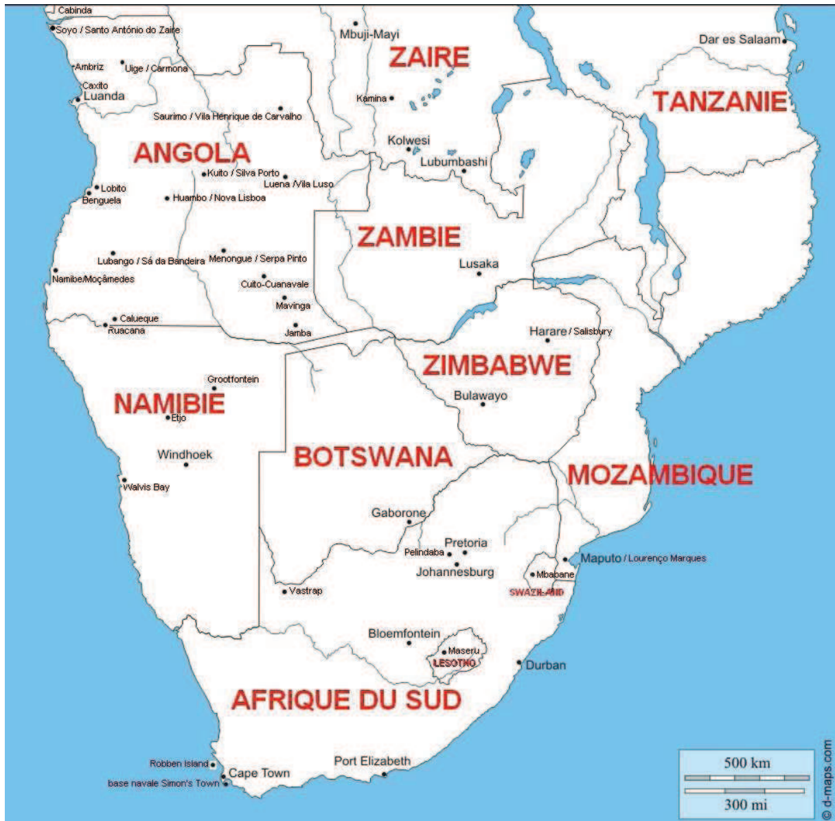
Carte complétée par l'auteur