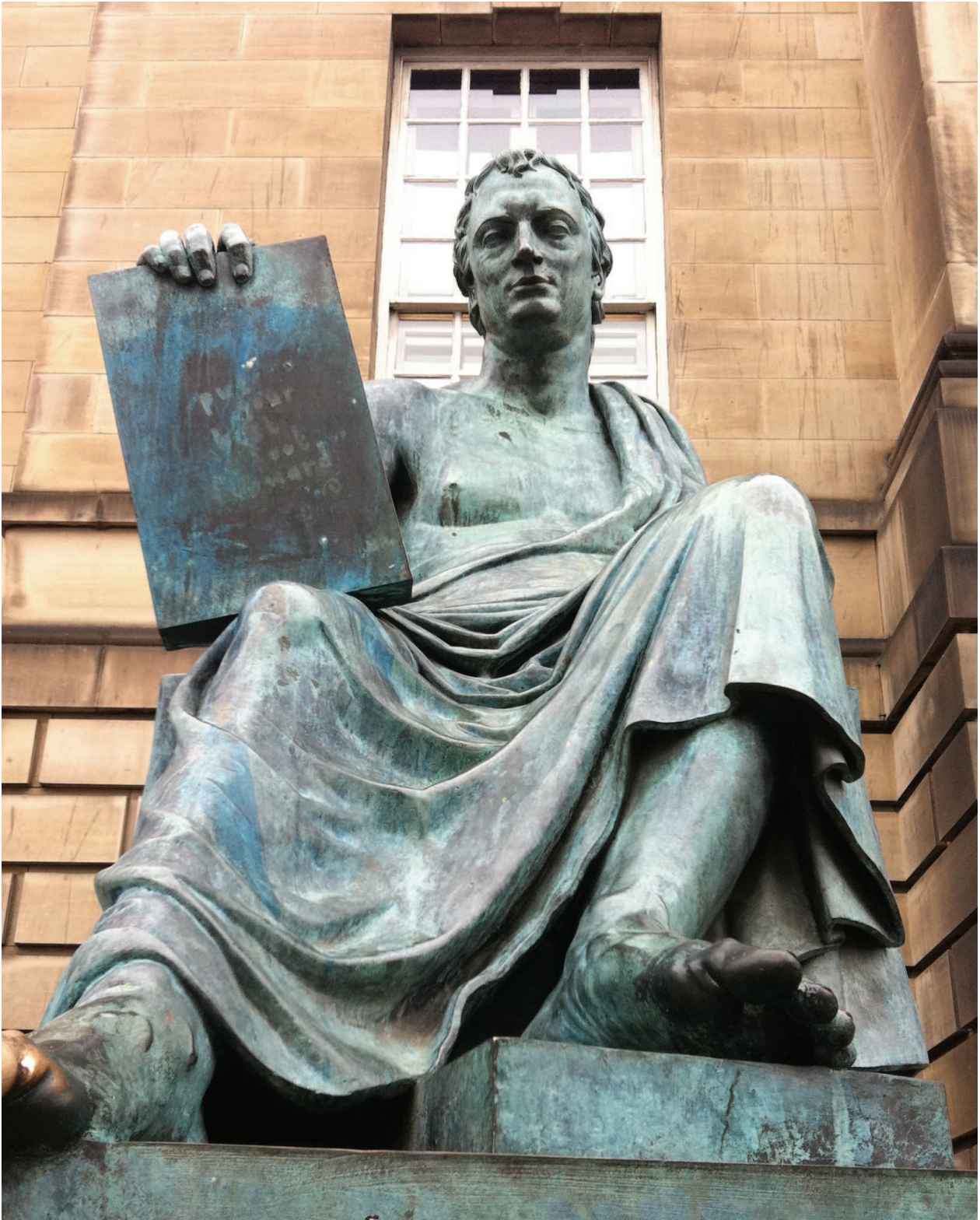
Photographie 12 : David Hume (statue à Edimbourg)