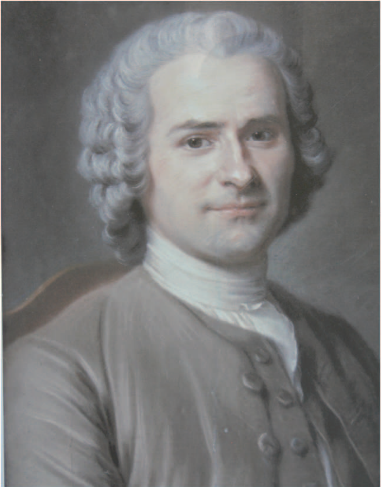
Photographie 10 : Portrait de JJ Rousseau par La Tour