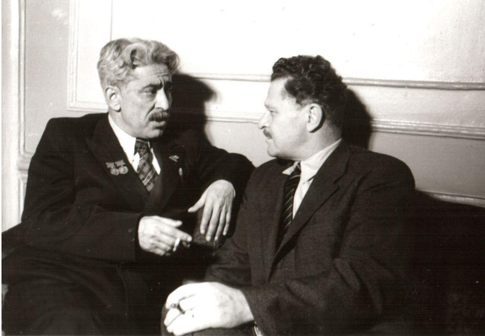
3. Le poète azerbaïdjanais, Samed Vurgun et le poète turc, Nazim Hikmet, Moscou, 1951