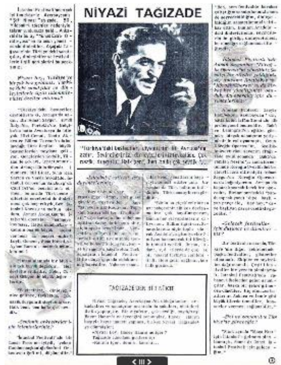
10. Opéra de Ville, Niyazi Yevgeni Onegin, quotidien Milliyet, 23 novembre 1965