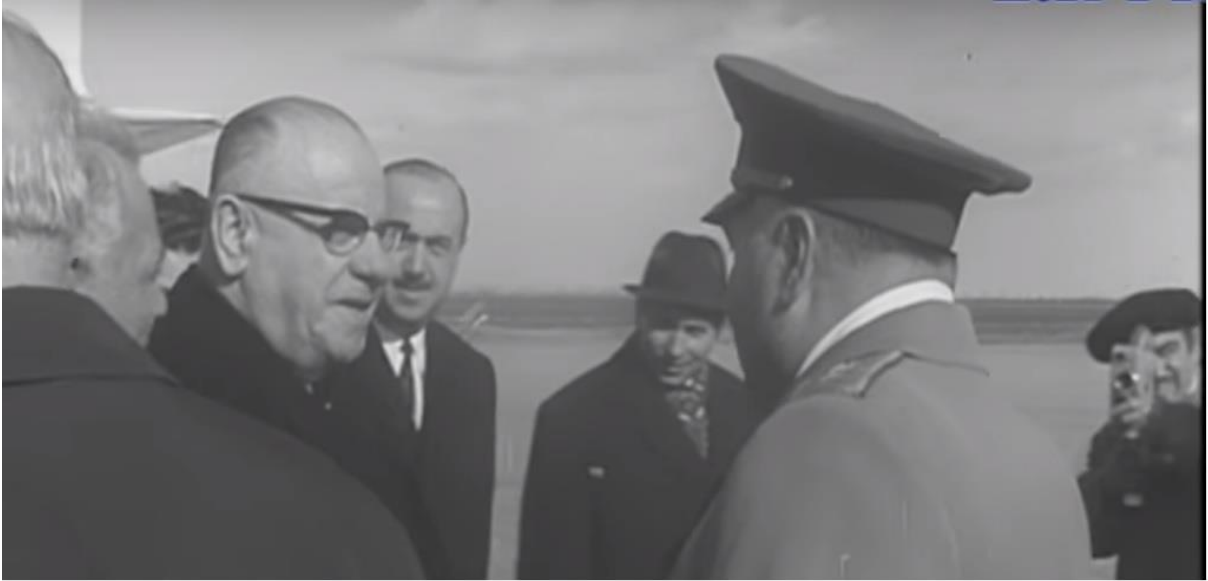
5. Le président de la République de Turquie, Cevdet Sunay à Bakou, 18 novembre 1969