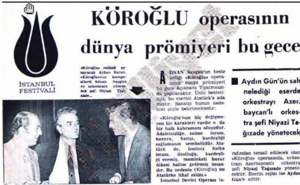
14. Affiche de l'opéra de Koroğlu, quotidien Milliyet, 20 juin 1973