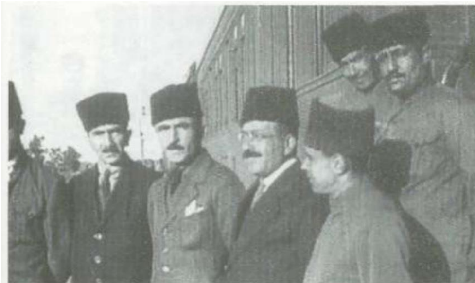
23. Ənvər Paşa 1920-ci ilin sentyabrında Bakıda Şərq xalqlarının I qurultayından ayrılarkən