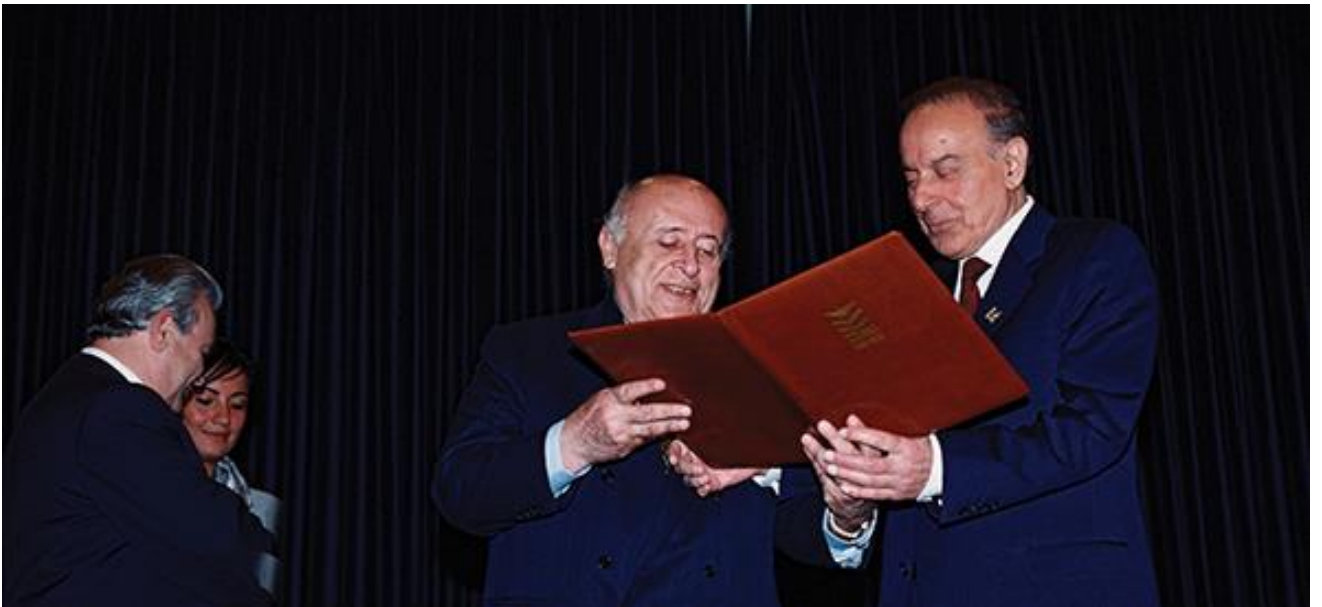
6. Le président de la République de Turquie, Süleyman Demirel délivre au président d'Azerbaïdjan, Haïdar Aliyev, le prix d'Atatürk, Ankara, 1er novembre 1999