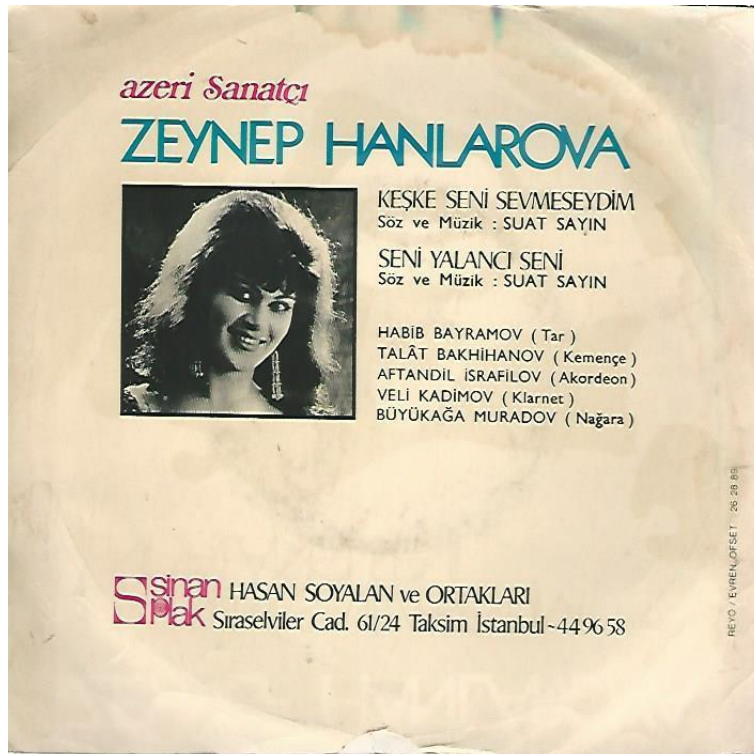
9. Note sur l'album de Zeynep Hanlarova, produit par Sinan Plak à Istanbul