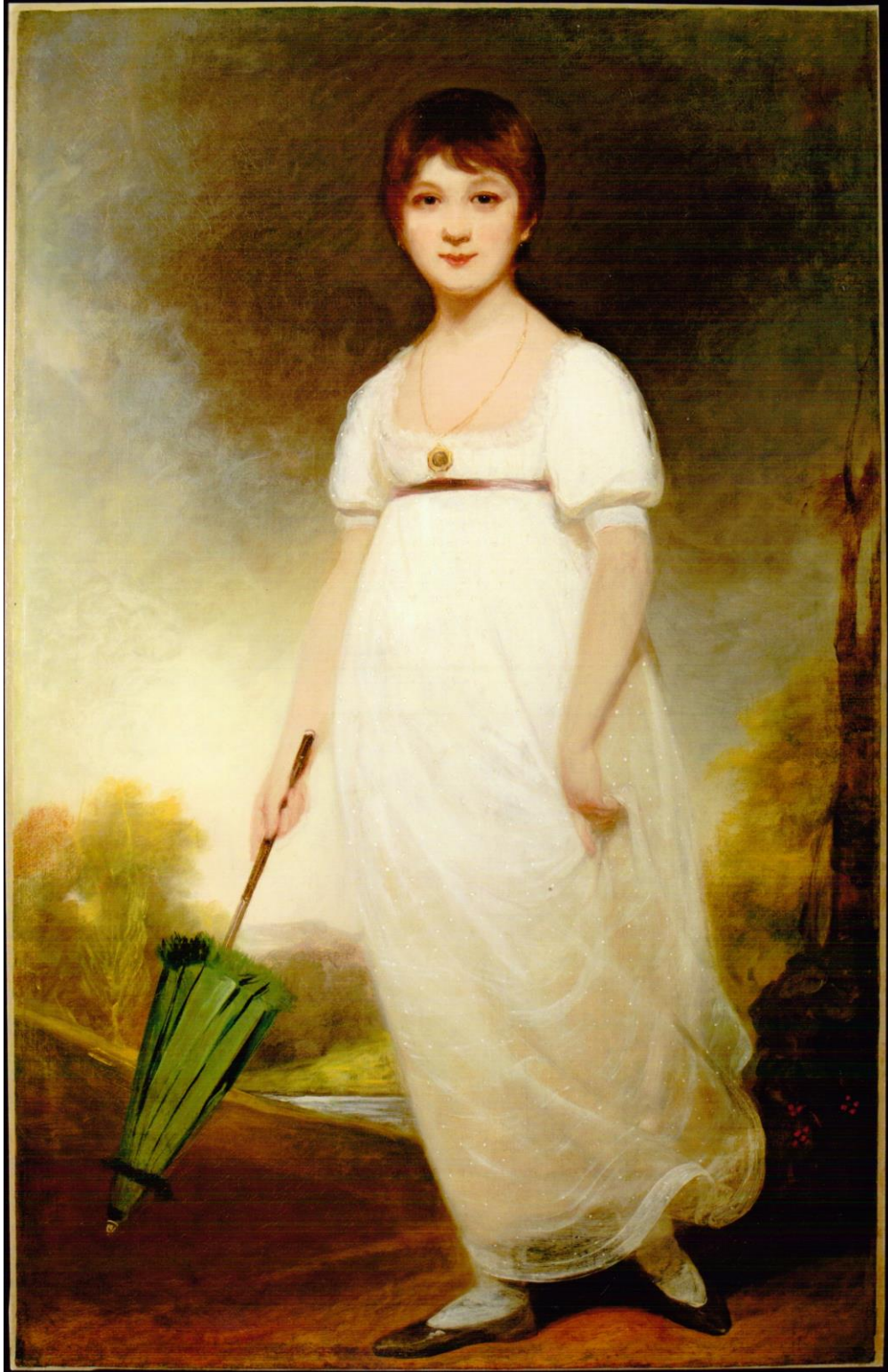
The Rice portrait Huile sur toile