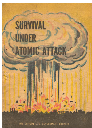
FIG. 2.1: Couverture d'une brochure éditée par la défense civile

Les abris ont pour but de favoriser la survie en cas d'explosion d'une bombe atomique : ils permettent de protéger contre le souffle de l'explosion et d'éviter les brûlures. L'image de l'explosion fait également partie des images culturelles associées à la bombe. Les bombardements d'Hiroshima et de Nagasaki ont été filmés et c'est également le cas de nombreux essais atomiques. De plus, l'image du champignon nucléaire est présente sur les brochures de survie.