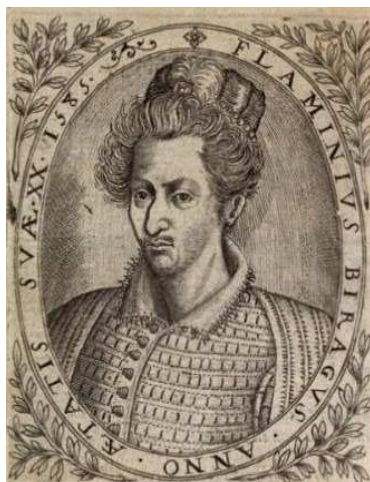
Portrait de Birague dans Les Premières œuvres poetiques (1585) Arsenal, Rés. 8BL8916 593 .