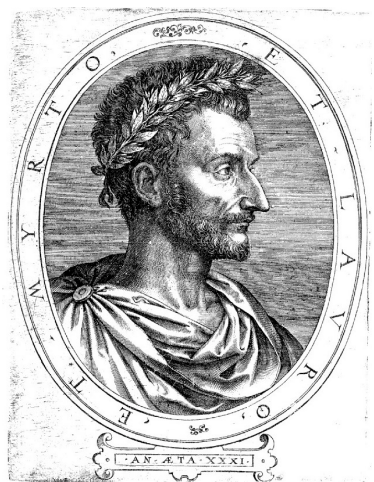
Portrait de La Gessée dans Les Premières œuvres françoyses (1583) BnF, Rés. Ye-486.

Ce procédé est repris par la génération suivante, au-delà du cadre restreint des canzonieri . En liminaire de ses Premières œuvres françoyses (1583), Jean de La Gessée insère un portrait gravé de lui-même couronné de laurier et entouré des mots « Et lauro et myrto », dans une visée cumulative qui peut suggérer une supériorité par rapport à ses prédécesseurs. À l'orée des Premières œuvres poetiques de 1585, le portrait de Flaminio de Birague ne présente pas le poète couronné, mais le médaillon est entouré de branches de myrte. À l'ouverture de son Phoenix (1585), Jean-Édouard Du Monin a la tête ceinte de laurier.