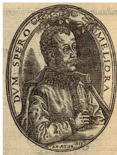
Portrait de Des Autels dans l'Amoureux repos (1553) BnF, Rés. Ye-1624.

Les poètes de la génération 1550 lancent ainsi une mode du portrait gravé à la couronne. C'est « un moyen efficace à la fois de différencier leur œuvre propre (chaque portrait [est] unique [...])