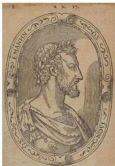
Portrait de Ronsard dans Les Amours (1552) BnF, Rés. P-Ye-1482.