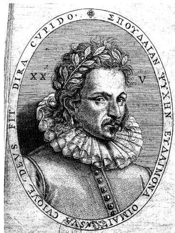
Portrait de Du Monin dans Le Phoenix (1585) BnF, Rés. Ye-1926.

En somme, même si tous ne le font pas 594 , nombreux sont les poètes à revendiquer la couronne du vainqueur. Quoique la nature de celle-ci puisse varier (laurier, myrte, olivier, lierre, etc.), il n'en reste pas moins que plusieurs s'octroient la même couronne (celle de laurier et celle de myrte notamment). Cette démultiplication des vainqueurs suggère une démultiplication des hiérarchies qui deviennent des classements personnels : en d'autres termes, à chaque poète couronné correspond un podium subjectif sur la première marche duquel il se situe.