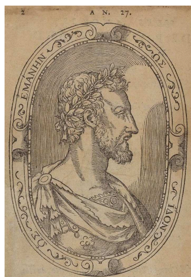
Portrait de Ronsard dans Les Amours (1552) BnF, Rés. P-Ye-1482.