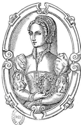
Portrait de Castianire dans Les Amours de Magny (1553) BnF, Rés. Ye-1667.