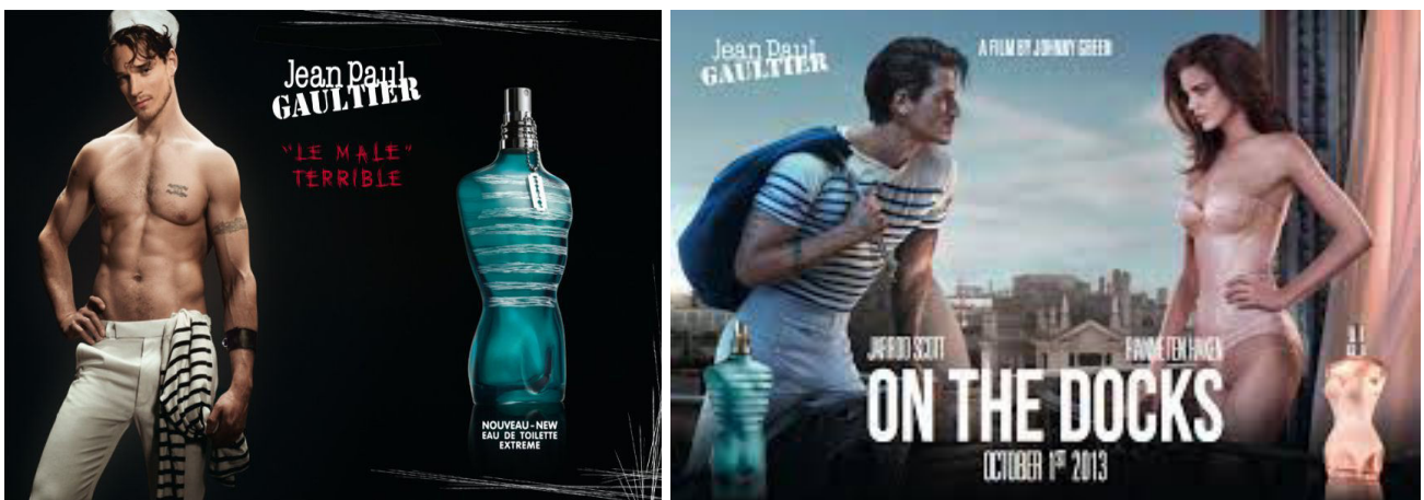
Publicités pour le parfum Jean Paul Gaultier, 2013.

Le quai, représenté par la bitte d'amarrage transformée en pénis devient le lieu de l'homosexualité assumée, présente dans le film. Le corps du matelot est ambivalent, destiné autant à séduire les hommes que les femmes. Le marin des publicités de Jean-Paul Gaultier symbolise aussi cette ambiguïté.