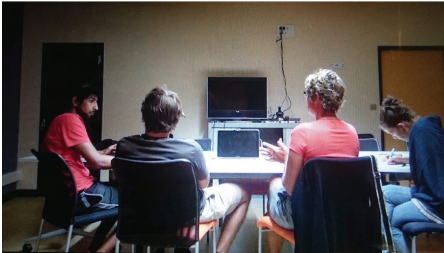
Figure 3: enregistrement vidéo d'un ECP de la triade 3