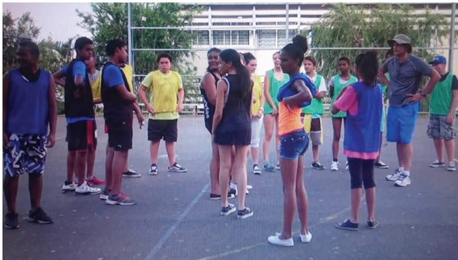
Figure 2 : enregistrement vidéo de l'activité d'enseignement de l'EN2

Les enregistrements audio-vidéo ont été réalisés à l'aide d'une caméra numérique positionnée sur un pied fixe et d'un micro HF sans fil porté par les EN.