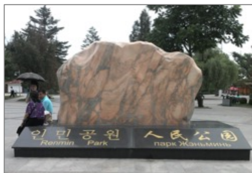
Figure 3. Enseigne multilingue du « Parc du peuple »