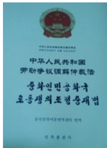
Figure 8. Loi sur l'arbitrage des conflits au travail traduite en langue chaoxianzu

En bref, même si les Chaoxianzu vivent depuis longtemps en Chine, ils ne s'intègrent pas bien à la culture majoritaire et en général à celle des Han ; au niveau politique, ils existent toujours en tant que citoyens chinois comme les Han . Ici, les deux ethnies commencent