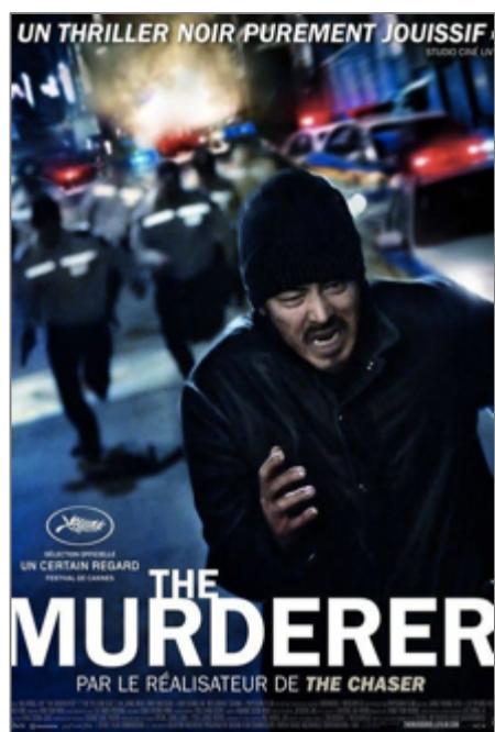
Figure 13. Affiche du film « The Murderer »

article se réfère uniquement aux simples statistiques sans prendre en compte le taux de croissance des résidents étrangers et la proportion de chinois dans ce taux, etc (on déforme et on exagère les faits). Dans un film commercial de 2010, un tueur à gages chaoxianzu est le personnage principal (« The Murderer » réalisé par Na Hong-jin). (Voir la figure 13) Au fil des années, de plus en plus de films commerciaux dépeignent les Chaoxianzu comme appartenant à des gangs et le quartier Garibong-dong comme source de crime (« New World » réalisé par Park Hoon-Jung en 2013, « Coin Locker Girl » par Han Jun-hee en 2015 et en 2017, « The Villainess » par Jeong Byeong-gil, « Midnight Runners » par Kim Joo-hwan et « The Outlaws » par Kang Yoon-sung). Ces films ont également eu du succès au box-office,