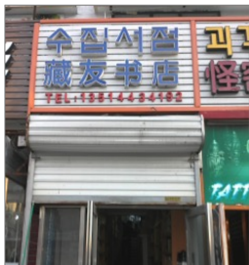
Figure 2. Enseigne bilingue d'une bouquinerie à Yanji

République populaire de Chine» (中华人民共和国民族区域自治法 Zhōnghuárénmíngònghéguó mínzúqūyùzìzhìfǎ , promulguée en 1954, modifiée en 1984) et concrètement avec la promulgation d'un règlement édictant l'autonomie de la préfecture (朝鲜族自治州自治条例 Cháoxiǎnzú zìzhìhōu zìzhì tiáolì ). Les noms des enseignes et l'annonce vocale dans les transports en commun (à l'arrêt du bus) le représentent bien. On peut remarquer que la langue de Chaoxianzu est écrite en haut ou à droite sur les enseignes. Par ailleurs, dans le bus, lorsqu'on entend l'annonce de l'arrêt, c'est toujours en premier en chaoxianzu . (Voir les figures 2 et 3)