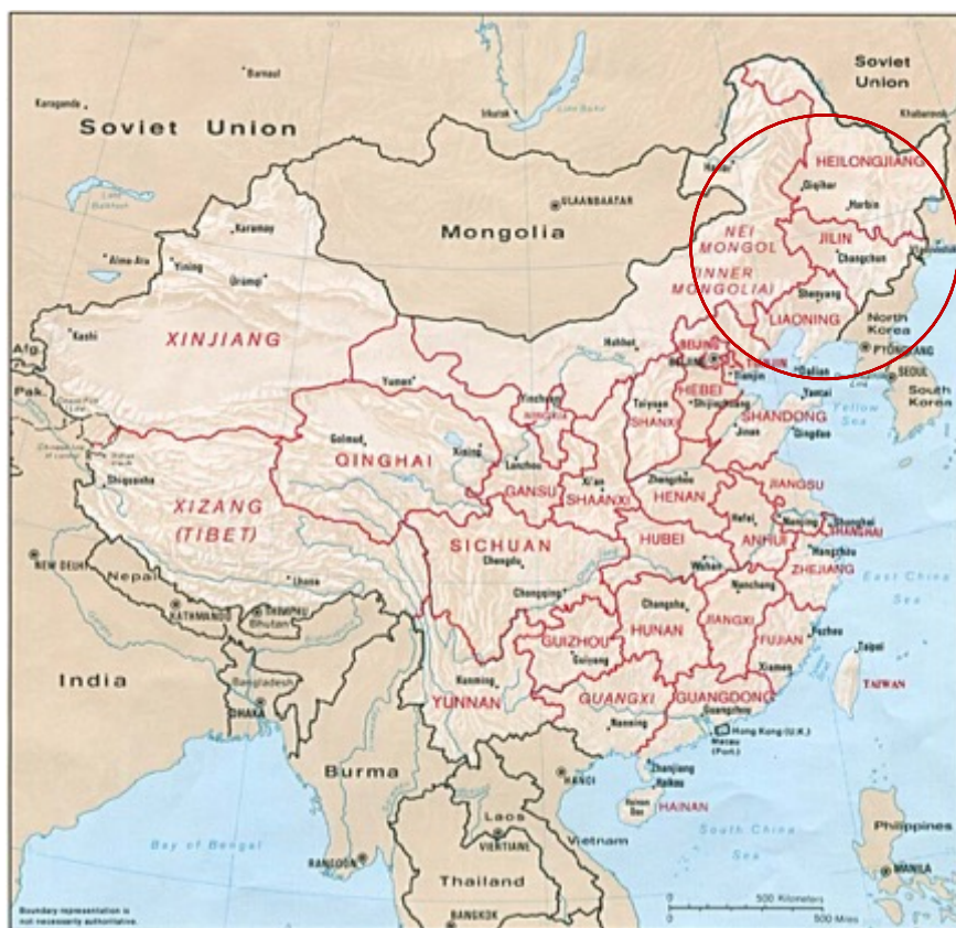
Figure 1. Trois provinces chinoises du Nord-Est (Heilongjiang, Jilin, Liaoning)

Yanji 延吉 est le centre-ville de la préfecture autonome des Chaioxianzu de Yanbian (延边朝鲜族自治州 Yanbian chaioxianzu zizhizhou ) en Chine. C'est aussi le centre culturel, économique et politique de l'ethnie Chaoxian depuis l'établissement de la Chine socialiste. Il a pour rôle important de coaliser les communautés