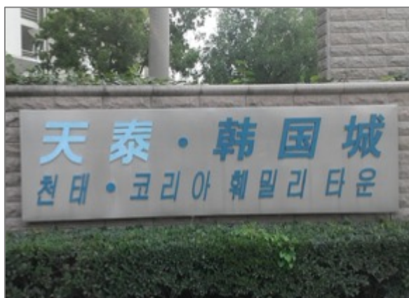
Figure 25. Autre quartier coréen toujours à Qingdao

Ils résident collectivement à Licun 李村 du district, Licang 李滄, ou à celui de Chengyang 城陽, etc. 366 En particulier, environ 100 000 immigrés chaoxianzu et 50 000 sud-coréens se concentrent massivement à Chengyangqu 367 . Le koreatown , soit chaoxianzutown à Chengyang a commencé à se former avec les entreprises de production sud-coréennes massivement déplacées après la normalisation des relations diplomatiques 368 . Qingdao de la province de Shandong 山东 est un lieu où l'on peut facilement se déplacer vers la Corée du Sud par voie aérienne et maritime. En particulier, Chengyang, qui se situe à la périphérie de Qingdao est proche de l'aéroport était, auparavant, recouvert par des champs de maïs. C'est donc un lieu d'habitations abordables. Donc cela a été parfait pour les besoins de capitaux sud-coréens qui ont essayé de déplacer leur usine afin de trouver un coût de production bon marché. Ainsi, un complexe industriel géant s'est formé dans le district de Chengyang avec des logements abordables autour. Les Sud-coréens et les Chaoxianzu y sont venus trouver un emploi.