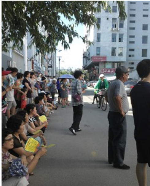
Figure 11. Des parents majoritairement des grand-mères qui attendent leur petit enfant devant une école primaire, le 6 juillet 2013

augmenter leur possibilité de vivre dans les grandes villes chinoises ou à l'étranger, apparaît 168 de plus en plus.