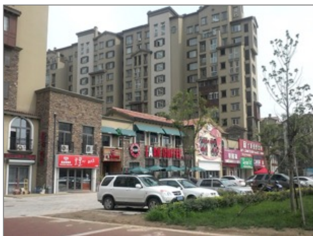
Figure 24. Quartier coréen à Qingdao

Même si la population des immigrés chaoxianzu est limitée à Qingdao, si on inclut les immigrés sud-coréens (100 000) 362 , elle est équivalente à celle d'une ville coréenne de taille