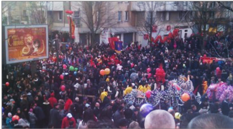
Figure 16. Nouvel an chinois dans le quartier « triangle de Choisy » du 13 ème à Paris, 2012

Le « triangle de Choisy » du 13 e arrondissement et le quartier de Belleville du 19 e arrondissement sont les quartiers chinois 316 représentatifs de Paris où de grands supermarchés chinois et beaucoup de restaurants chinois se sont implantés et s'y concentrent. Ces quartiers sont les lieux de sociabilité ou de consommation où les Chaosianzu font des courses et se