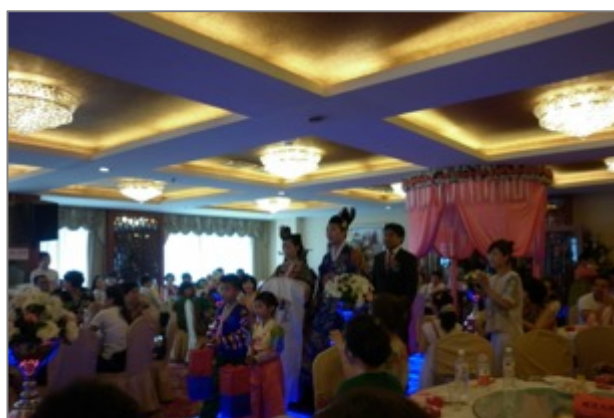
Figure 6. Mariage d'un couple d'ethnie han- chaoxian portant des costumes chaoxian

En dépit de ce grand changement, les Chaoxianzu vivent toujours dans une double culture. Elle date de leur installation en Chine au milieu du XIX e siècle. Mais malgré leur présence depuis environ cent cinquante ans, les Chaoxianzu et les Han ne sont ni bien ni mal intégrés. Même s'ils habitent ensemble, les Chaoxianzu peuvent garder leur culture et leur langue grâce à la bienveillance des politiques des minorités nationales en Chine. Ils pouvaient être éduqués dans les écoles chaoxianzu où la langue de Chaoxianzu est privilégiée. C'est parce qu'ils vivaient en se regroupant dans les mêmes quartiers chaoxianzu qu'ils pouvaient pratiquer l'agriculture facilement (leur principale activité économique, avant les Réformes économiques). Institutionnellement, on peut dire que c'est le résultat des politiques « hukou » 156 qui limitait le déplacement des Chaoxianzu , principalement des agriculteurs, dans les zones urbaines. En substance, ils vivaient