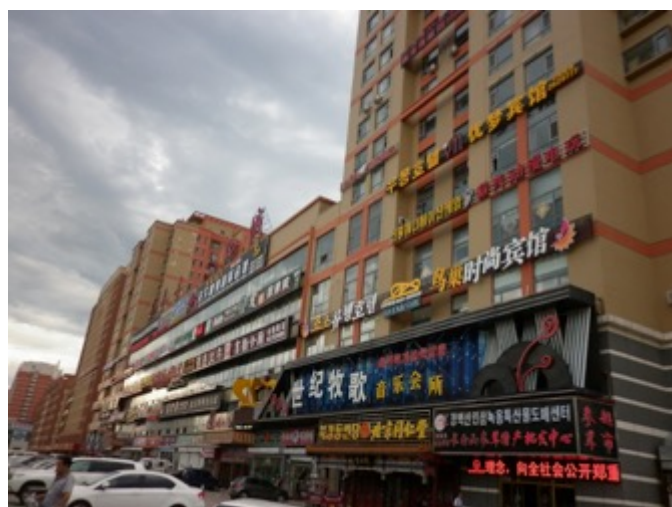
Figure 19. Koreatown de Wangjing à Pékin

Mais contrairement aux « Tóngxiāngcūn 同乡村 (enclaves chinoises composées d’immigrés issus du même village natal) » 333 de la périphérie des villes qui sont formées par les migrants ruraux (农民工 nongmingong ) qui n’ont pas de hukou pour les villes et qui peuvent être considérées comme les plus représentatives des zones immigrées des villes