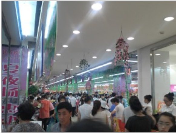
Figure 10. Vue de l'intérieur d'un grand magasin

années 2000, mais maintenant il y a beaucoup d'appartements. C'est pour ça que l'on utilise maintenant très facilement l'eau chaude ». (Voir les figures 10)