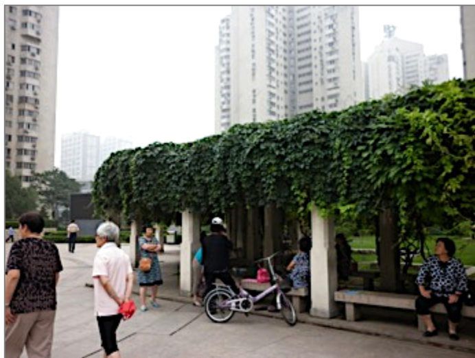
Figure 23. Parc du district résidentiel de Wangjingxiyuan (2013)

D'autres communautés sont celles professionnelles, comme la réunion des dirigeants, principalement des femmes, de locations de logements partagés pour les visiteurs sud-coréens