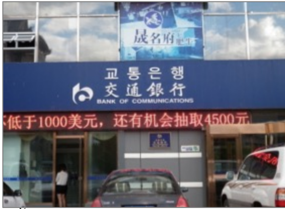
Figure 4. Banque dont l'enseigne est écrite en trois langues

De plus, on peut voir aujourd'hui les enseignes écrites en trois langues : chaoxianzu , chinois et anglais surtout celles des banques et des caisses d'épargne. (Voir les figures 4) Ceci témoigne bien du changement de la ville depuis les Réformes économiques, surtout depuis l'établissement de relations diplomatiques entre la Chine et la Corée de Sud en 1992. On a vu l'apparition de grands magasins coréens, de chaînes sud-coréennes: « 롯데리아 Lotteria