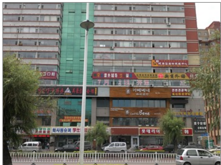
Figure 5. Immeuble rassemblant différentes grand chaînes commerciales sud-coréennes « 롯데리아 Lotteria » et 카페베네 Caffe Bene »

Ceci explique l'afflux des populations des campagnes autour de Yanbian et des quelques petits villages qui s'y sont intégrés. De plus, les bâtiments avec les routes principales ont été aménagés par la préfecture afin de célébrer le 60 e anniversaire de l'établissement de la préfecture autonome des Chaoxianzu de Yanbian, le 3 septembre 2012. Enfin les changements de cette ville montrent les influences à la fois de la mondialisation et de l'urbanisation. Cette agroville est devenue une ville transnationale en raison de l'émigration massive de ses habitants et de leur retour. Cette ville continue à s'élargir en intégrant de petits villages situés autour d'elle.