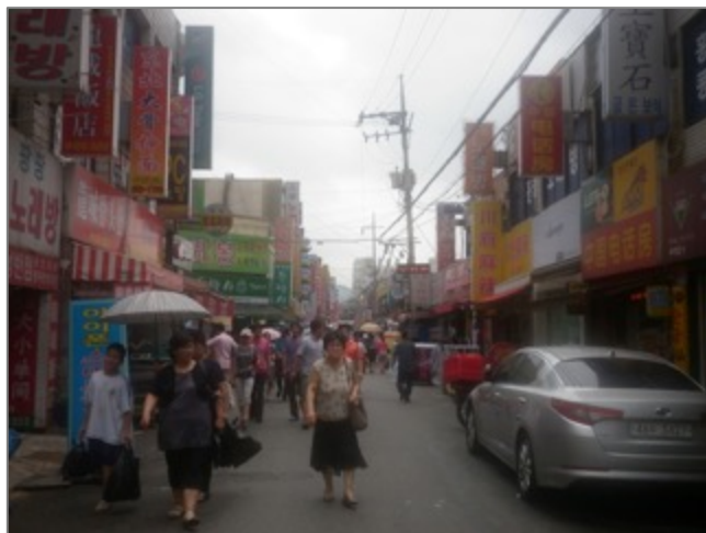
Figure 12. Quartier chaoxianzu de Garibong-dong à Séoul

Les quartiers chaoxianzu se sont formés à Garibong-dong, Séoul et dans le quartier « village sans frontière » d'Anshan, désigné comme la zone multiculturelle spéciale en région métropolitaine. Mais aussi dans la zone du complexe industriel de Dalseo-gu au Sud de Daegu en Corée du Sud.