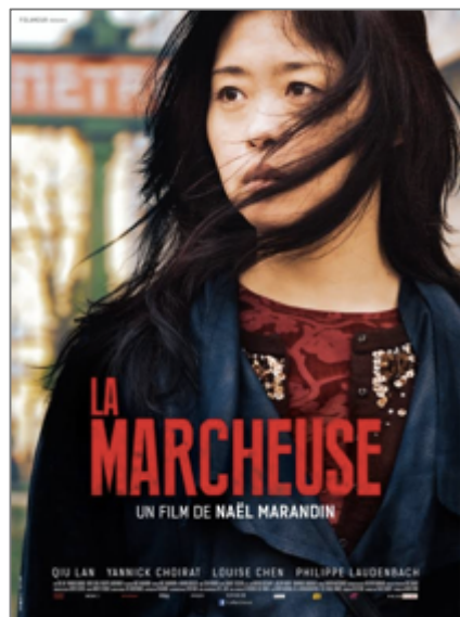
Figure 17. Affiche du film « La Marcheuse », 2015

(Voir la figure 16) D'autre part, le quartier de Belleville est souvent représenté dans les discours médiatiques ou académiques, comme le lieu de la criminalité liée aux Chinois ou de la prostitution des Chinoises venues du Nord-Est de la Chine 321 . (Voir la figure 17)