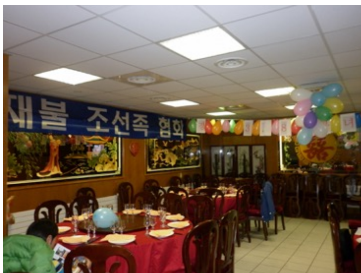
Figure 18. Événement de l'ACRF pour la Journée internationale des femmes, 2011

La plupart de nos interviewées ont fait un signe de tête approuvatif devant ces propos de Madame Han. Cela semblait prouver que parmi les quatre événements annuels organisés par l'ACRF de Paris, la fête de la Journée internationale des femmes, rassemblait le plus grand nombre de participants. (Voir la figure 18) Même si certains hommes profitent des