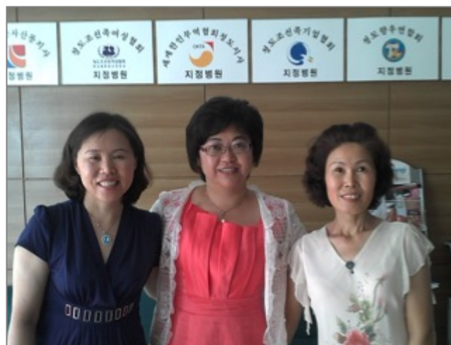
Figure 26. Membres de l'Association des femmes chaoxianzu à Qingdao

Par ailleurs, chaque association a plusieurs branches pour un grand nombre d'immigrés chaoxianzu . Surtout dans le cas de celle des seniors, elle est la plus grande association avec ses vingt-six succursales affiliées et un total de 1 500 membres. Comme elle reflète les caractéristiques de Qingdao, qui repose sur l'industrie manufacturière, l'Association des entrepreneurs a été développée et compte trois cents membres des entreprises et six branches 381 . Cette association cherche actuellement le plan de développement des Chaoxianzu et lève des fonds pour d'autres ONG chaoxianzu pour des événements importants. Elle organise particulièrement le plus grand événement des Chaoxianzu , « la fête de l'ethnie chaoxian à Qingdao ». L'association des femmes a cinq sections. L'association des entrepreneurs et celle des femmes, au pouvoir du financement