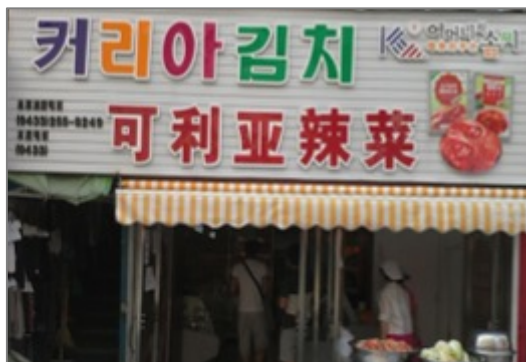
Figure 7. Boutique de « Kimchi », une spécialité coréenne

en se rassemblant dans les communautés fermées avec les mêmes droits et privilèges que la communauté Han . Ce n'était donc pas nécessaire de s'intégrer à la culture majoritaire han . (Voir les figures 6, 7)