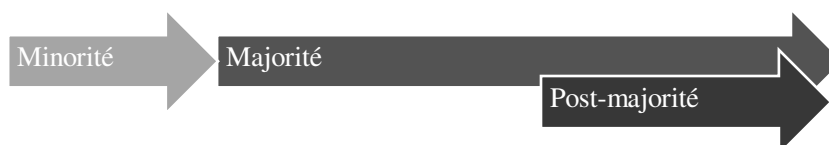
Séquences du cycle de vie juridique