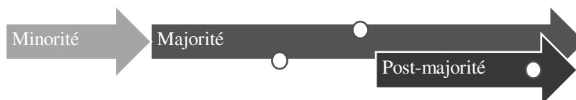
Séquences du cycle de vie juridique et protections spécifiques potentielles

592. Du point de vue éthique, l'adjonction d'un statut supplémentaire sur la partie haute de la majorité — c'est-à-dire sur les dernières années d'un cycle de vie classique —, est moins problématique qu'une division pure et dure de la majorité en deux états juridiques distincts. Par ailleurs, cette conception rigide ferait obstacle à l'idée principale de la post-majorité. À savoir que la personne conserve le corpus de droits reconnus aux majeurs, mais qu'il bénéficie de surcroît d'une conception favorable. La post-majorité se conçoit dès lors comme une pellicule de droits reconnus aux personnes âgées en plus du corpus reconnu à tout majeur. L'omniprésence du principe de capacité ne serait pas non plus nécessairement remise en cause, mais simplement adaptée à la nouvelle configuration. Ainsi les régimes spéciaux de protection des majeurs pourraient affecter le temps de post-majorité d'une égale manière qu'ils affectent déjà ponctuellement le temps de majorité. Cela étant l'existence d'une post-majorité permettrait d'octroyer à l'ensemble du mécanisme de protection juridique des majeurs une souplesse nouvelle, en permettant de distinguer les mesures prononcées pour des raisons pathologiques ou accidentelles, de celles prononcées pour pallier un affaiblissement dû à l'âge, ou un état en lien direct avec la sénescence — pour lesquelles la temporalité de la mesure pourrait alors être écartée.