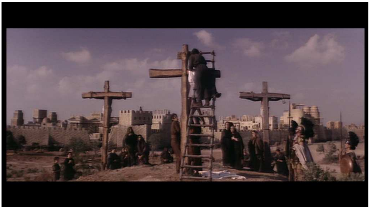
Figure 13. Capture d'écran. Barrabas , Richard Fleischer, 1962, la descente de croix.