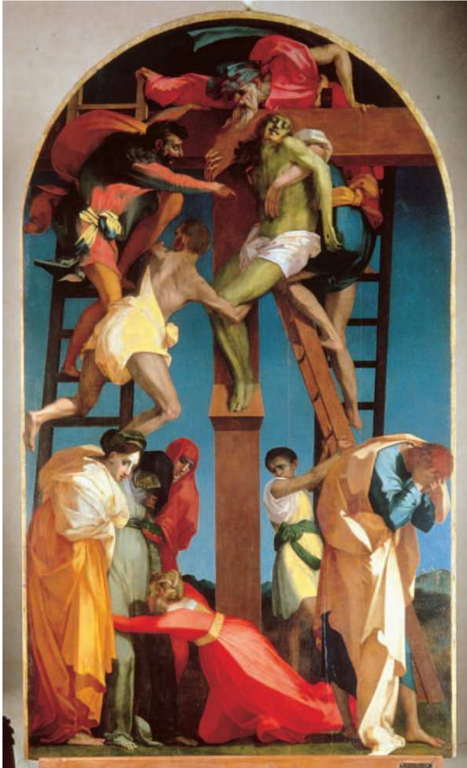
Figure 3. Rosso Fiorentino, Descente de Croix , 1521, Volterra