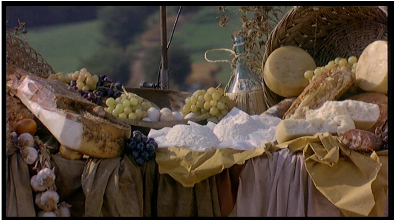
Figure 11. Capture d'écran. La ricotta