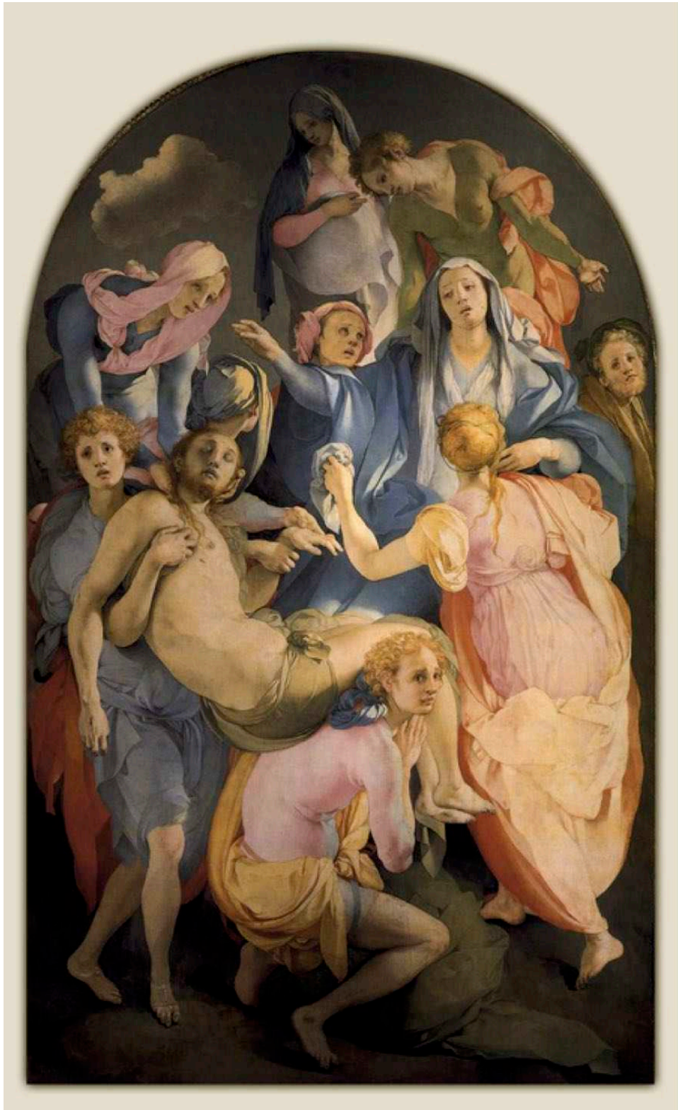
Figure 5. Pontormo, Déposition , 1527, Santa Felicità, Chapelle Capponi, Florence