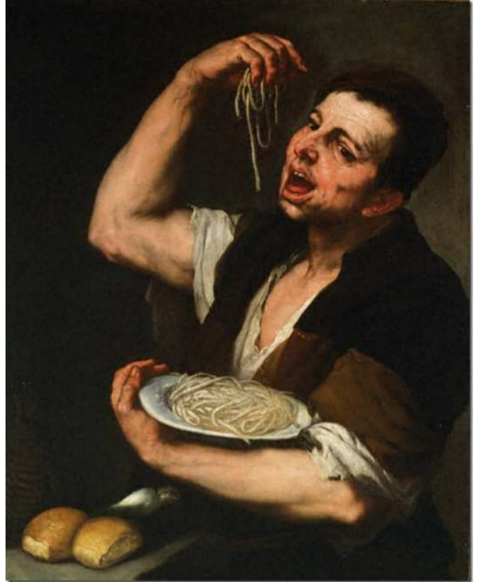
Figure 9. Luca Giordano, le mangeur de pâtes , 1660