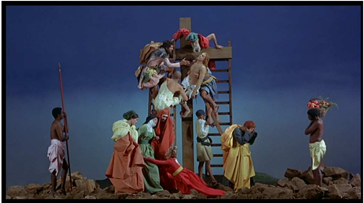
Figure 4. Capture d'écran. La ricotta , Pier Paolo Pasolini, 1963