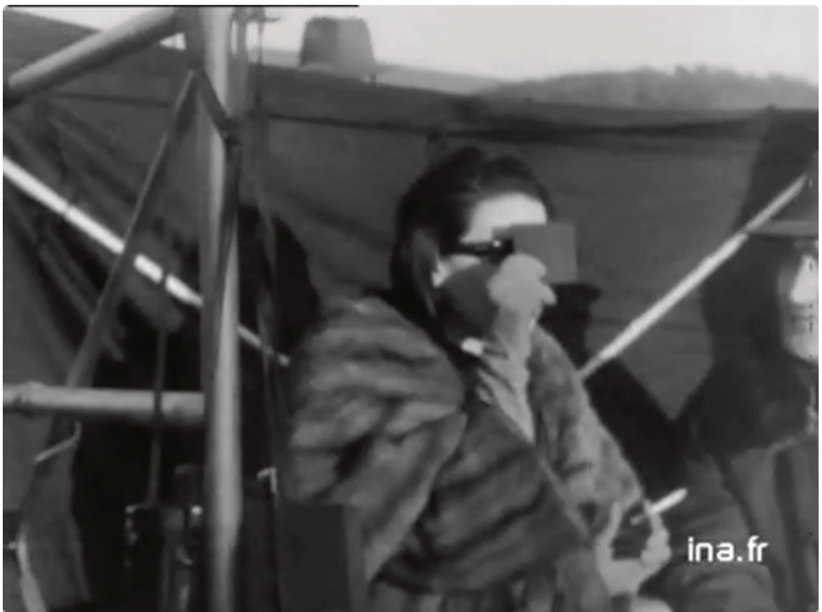
Figure 15. Capture d'écran. Silvana Mangano observant l'éclipse pendant le tournage de Barabbas .