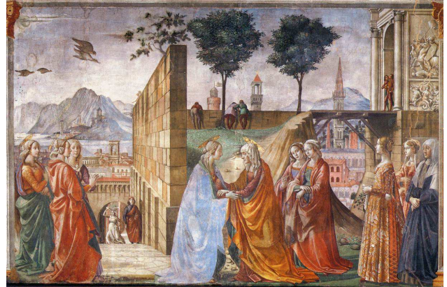
Figure 7. Domenico GHIRLANDAIO, la visitation , 1486-90, fresque de la chapelle Tornabuoni, Santa Maria Novella, Florence. A gauche : détail.