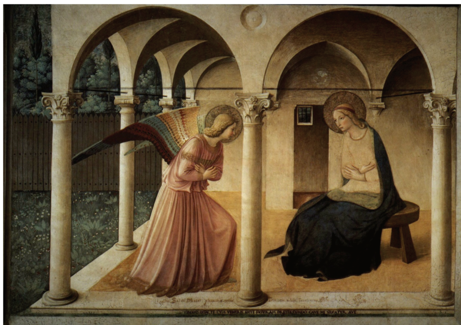
Figure 2. L'Annonciation , Fra Angelico, vers 1437, couvent San Marco, Florence