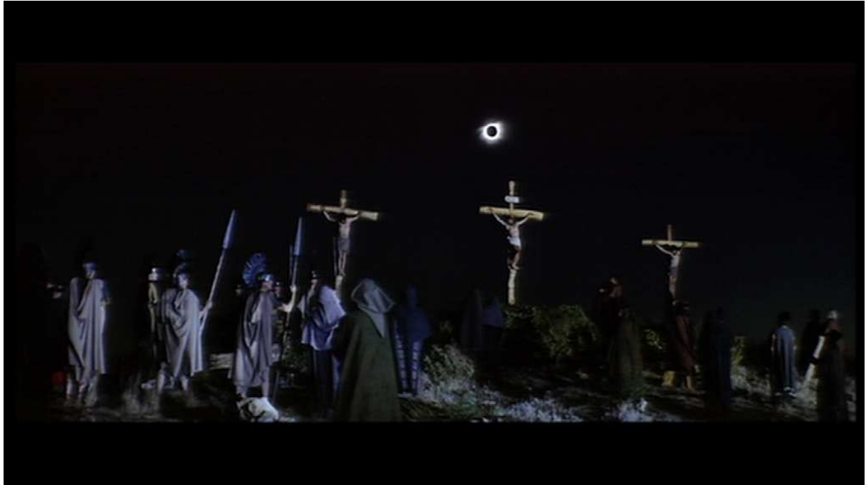
Figure 12. Capture d'écran. Barrabas , Richard Fleischer, 1962, la crucifixion.