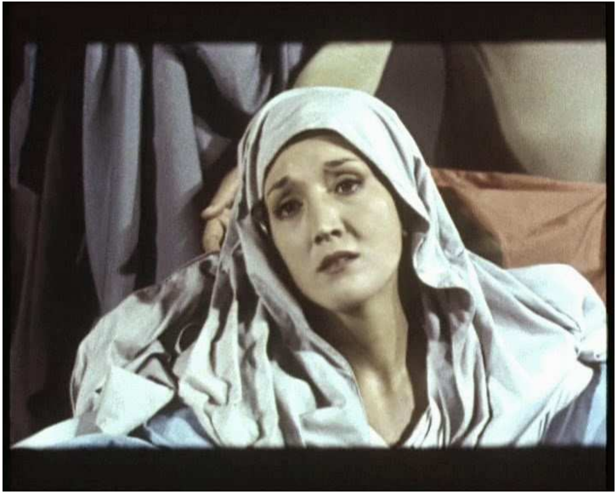
Figure 16. Capture d'écran. Edmonda Aldini dans La ricotta , Pier Paolo Pasolini, 1963

Edmonda Aldini (née en 1934 à Reggio Emilia) se fit connaître très précocement par ses performances théâtrales dans des rôles d'une très grande difficulté (Suora Costanza dans i Dialoghi dei Carmelitane , 1953). Elle mena ensuite une très riche carrière théâtrale et interpréta, notamment aux côtés de Vittorio Gassman, des rôles exceptionnellement variés. Elle fut également chanteuse, et se tourne à présent vers la poésie. Dans les années 1960, elle s'illustra sur le petit écran notamment dans le très populaire jeu des héros de télévision (1963), grand succès auprès de la critique comme du public, dans lequel elle endossait tous les rôles féminins, depuis la reine Atossa dans les Perses d'Eschyle jusqu'à Marie dans les Pleurs de la Vierge de Jacopone da Todi. Dans La ricotta , c'est une lecture de ces mêmes lamentations qui provoque les rires des figurants lors de la reconstitution de la Déposition de Rosso Fiorentino, Edmonda Aldini apparaissant dans celle de Pontormo.