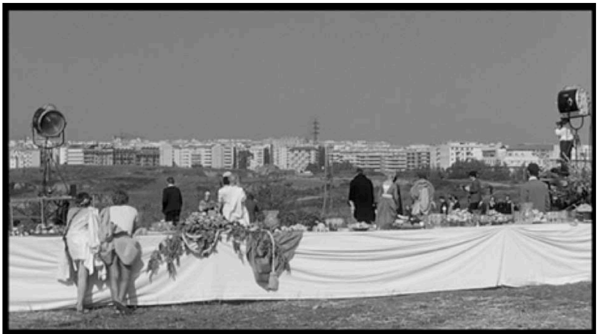
Figure 8. Capture d'écran, La ricotta , la visite des producteurs.