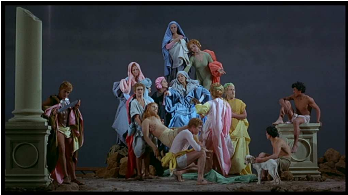
Figure 6. Capture d'écran. La ricotta