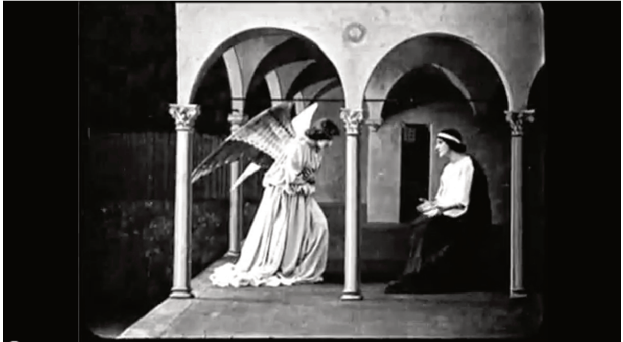
Figure 1. Capture d'écran, Christus , Giulio Antamoro, 1916