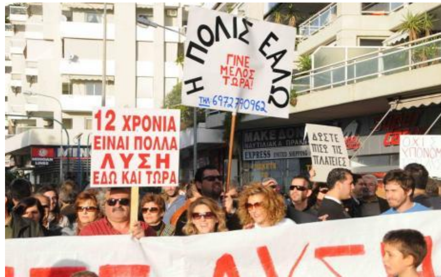
Manif de la Polis ealo . Sur les pancarte on lit : Rendez-nous nos places/ 12 ans c'est beaucoup, solution ici et maintenant 922 .