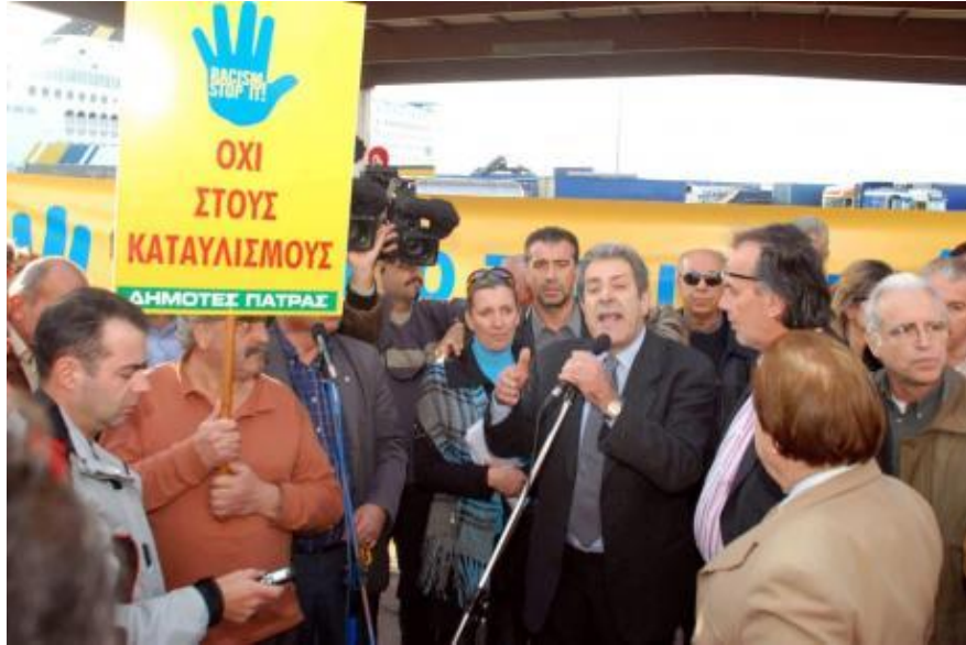
Le maire de Patras pendant la protestation contre l'existence du khaimaga . Sur la pancarte on voit un dessin écrivant : RACISM/ STOP IT !! En bas du dessin il est écrit en grec : Non aux campements. La signature de la pancarte : Citoyens de Patras