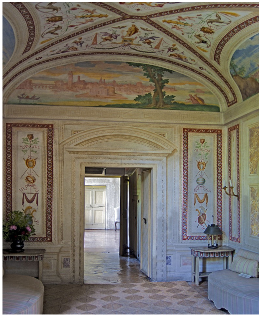
Plafond en grotesque et vue d'ensemble d'une pièce, villa Foscari, Vénétie, Italie.

Par conséquent, le grotesque accompagne le maniérisme dans la mesure où il procède du même éloignement vis-à-vis de la réalité et de sa reproduction fidèle ; ses images et leur redécouverte sont contemporaines du maniérisme pictural, et tous deux permettent à l'artiste de jouer avec les règles esthétiques classiques, de s'en amuser et de faire étalage de sa virtuosité. Alessandra Zamperini mentionne même « la désinvolture, pour ne pas dire la complaisance, à montrer des images irréelles, jamais vues dans la nature » 102 . Par ailleurs, l'utilisation du grotesque dans le cadre plus large du maniérisme littéraire est souligné par Géralde Nakam dans son article sur la « maniera » de Montaigne 103 . Elle y étudie comment le style ornemental grotesque se reflète dans l'organisation du texte : « Montaigne l'applique à ses Essais , par autodépréciation et avec humour : il va encadrer de figures indéfinissables et risibles une grande œuvre centrale. » Cette même tendance à l'ornement est-elle également présente chez John Donne ?