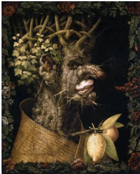
L'Hiver, Arcimboldo, 1573, musée du Louvre, Paris.