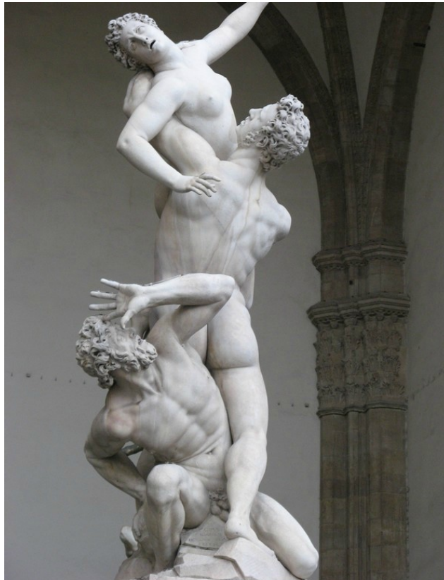
L'Enlèvement des Sabines , Giambologna, 1579-1583, Florence, Italie.

Le monde décrit par John Donne dans le First Anniversary constitue un tableau défaillant et laid, dont les lignes, les couleurs et les proportions ne sont pas harmonieuses et provoquent son échec : « For the world's beauty is decayed, or gone, / Beauty, that's colour, and proportion. », « Such divers down-right lines, such overthwarts, / As disproportion that pure form » (vers 249-250 et 256-257). Ce même texte contient une référence à la ligne « serpentine » (« He comes no more, but with a cozening line, / Steals by that point, and so is serpentine », vers 272) ; ce qui indique une connaissance des théories esthétiques et picturales de l'époque selon certains critiques. En effet, la linea serpentinata en italien était un des traits caractéristiques de la peinture et de la sculpture maniériste, illustrée par exemple par l' Enlèvement des Sabines de Giambologna.