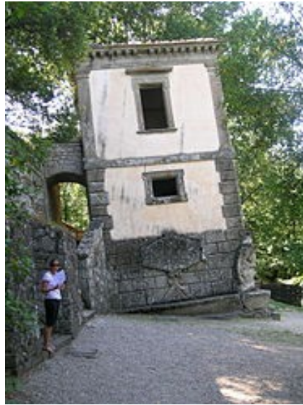
La Maison Penchée, jardins de Bomarzo, Latium, Italie.

La notion de dévoiement est utilisée par Tony Gheeraert, qui dresse un parallèle entre le décentrement esthétique opéré par la création maniériste et « la crise de l'univers ptoléméen », remplacé par « la vision copernicienne de l'univers et l'élimination définitive du géocentrisme » 114 . L'artiste maniériste décentre son sujet et le projette vers un univers flou et instable, ce qui reflète le bouleversement provoqué par les découvertes astronomiques de l'époque.