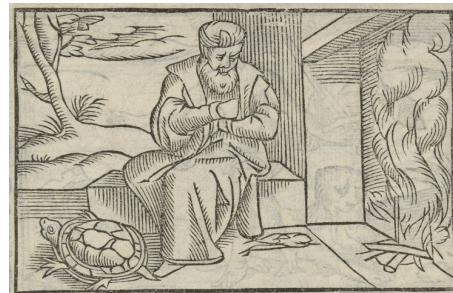
« Phlegma »