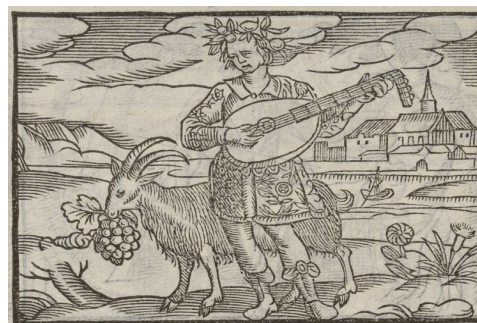
« Sanguis »

En définitive, avant même de constituer un état d'esprit singulier, voire même un élan