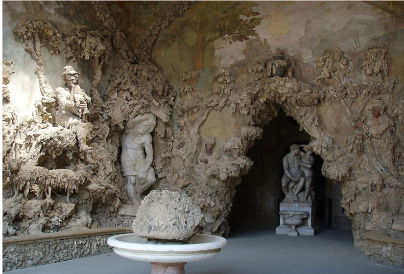
Grotte de Buontalenti, jardins de Boboli, Florence, 1550-1593

afin de l'imiter de façon exubérante et fantasque. Le visiteur est moins frappé par la ressemblance avec une vraie grotte que par l'idée de l'artiste.