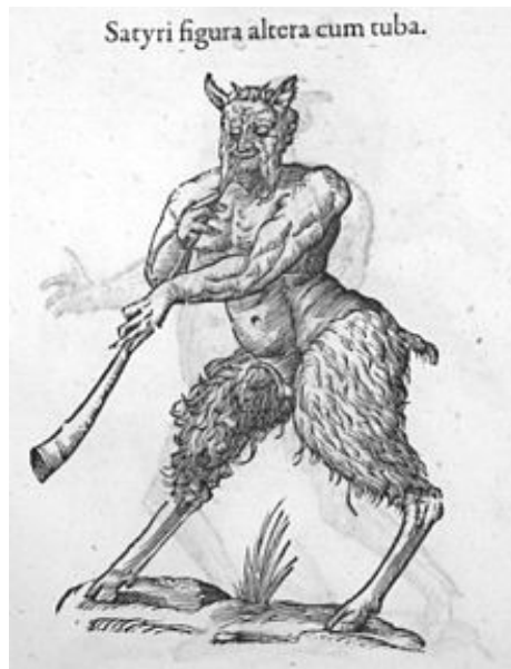
Dessin d'un satyre, Monstrorum Historia , Ulisse Adrovendi, Bologne, 1642.