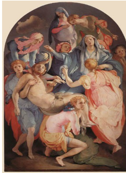
La Déposition de Croix , le Pontormo, 1526-1528, Eglise Santa Felicita, Florence

Dans le First Anniversary , le déséquilibre et donc l'absence de régularité et d'harmonie ne sont pas seulement moraux ou cosmiques, il sont aussi esthétiques. A l'instar de la Maison Penchée des jardins de Bomarzo, dont la réalisation débuta en 1550, le déséquilibre est évident et cultivé en tant que tel ; un édifice normalement voué à la solidité et à la stabilité est ici comme « dévoyé ». La structure penchée de la maison amuse tout d'abord avant de mettre nettement à distance la fonction première et pragmatique du bâtiment : le spectateur y voit un trait d'esprit architectural, qui se soucie peu de réalisme ou d'un quelconque aspect pratique.