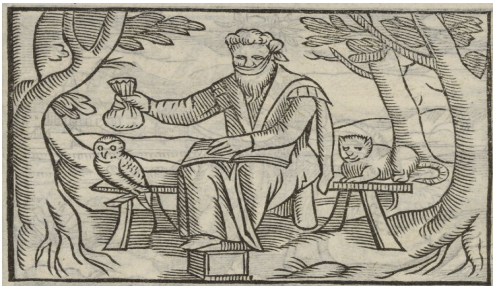
« Melancholia »

Les quatre tempéraments sont illustrés de façon individuelle dans l'ouvrage de Henry Peacham Minerva Britannia (1612) :