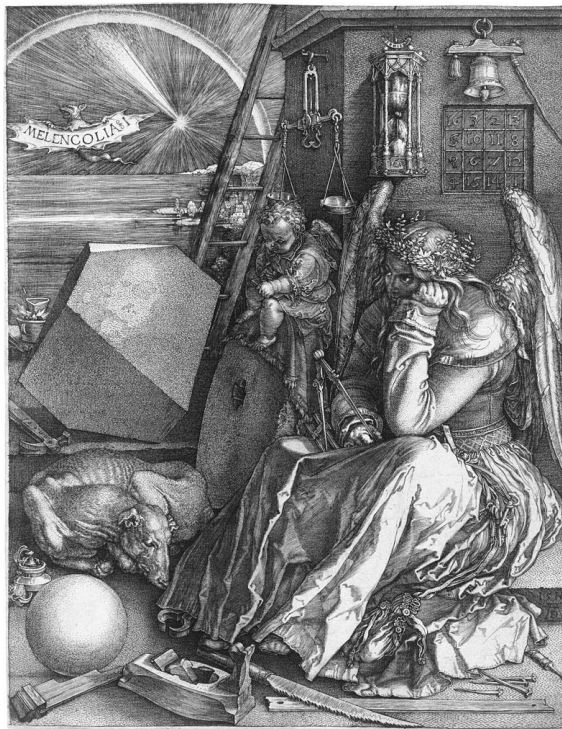
La Melencolia , Albrecht Dürer, 1514, musée Condé, Chantilly