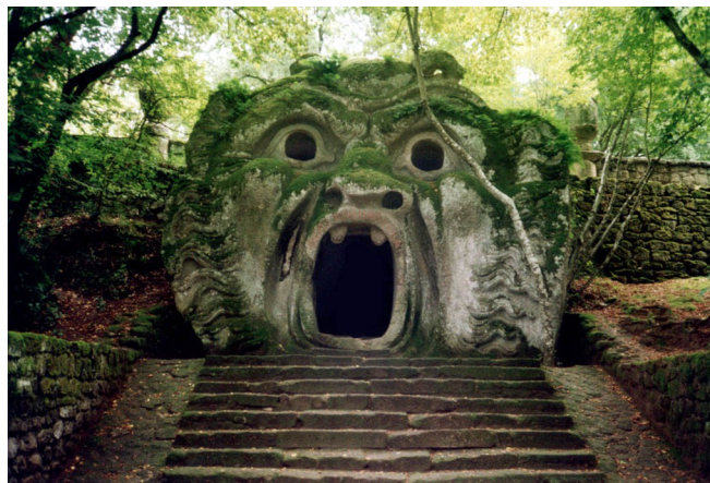
La Porte de l'ogre (ou Entrée des Enfers), jardins de Bomarzo, construits entre 1548 et 1580, province de Viterbe, Italie

Le poème s'interroge sur une question typiquement maniériste, celle du faux-semblant et de l'artifice. L'angoisse exprimée ici provient d'une inquiétude née de l'apparence : et si Dieu ne voyait pas les signes extérieurs de la foi ? Et si celle-ci était trop masquée, dissimulée ? Au contraire, saurait-il démasquer les imposteurs, ceux qui affichent les signes extérieurs de la foi sans la ressentir réellement ? Au beau milieu de cette réflexion, une métaphore surprenante surgit au quatrième vers : « That valiantly I hell's wide mouth o'erstride ». Sans rapport direct avec le propos du reste du poème, l'image d'une bouche béante qui conduit aux enfers s'impose aux yeux du lecteur et rappelle la sculpture dite de l'Entrée des Enfers des jardins maniéristes de Bomarzo en Italie.