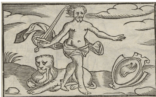
« Cholera »