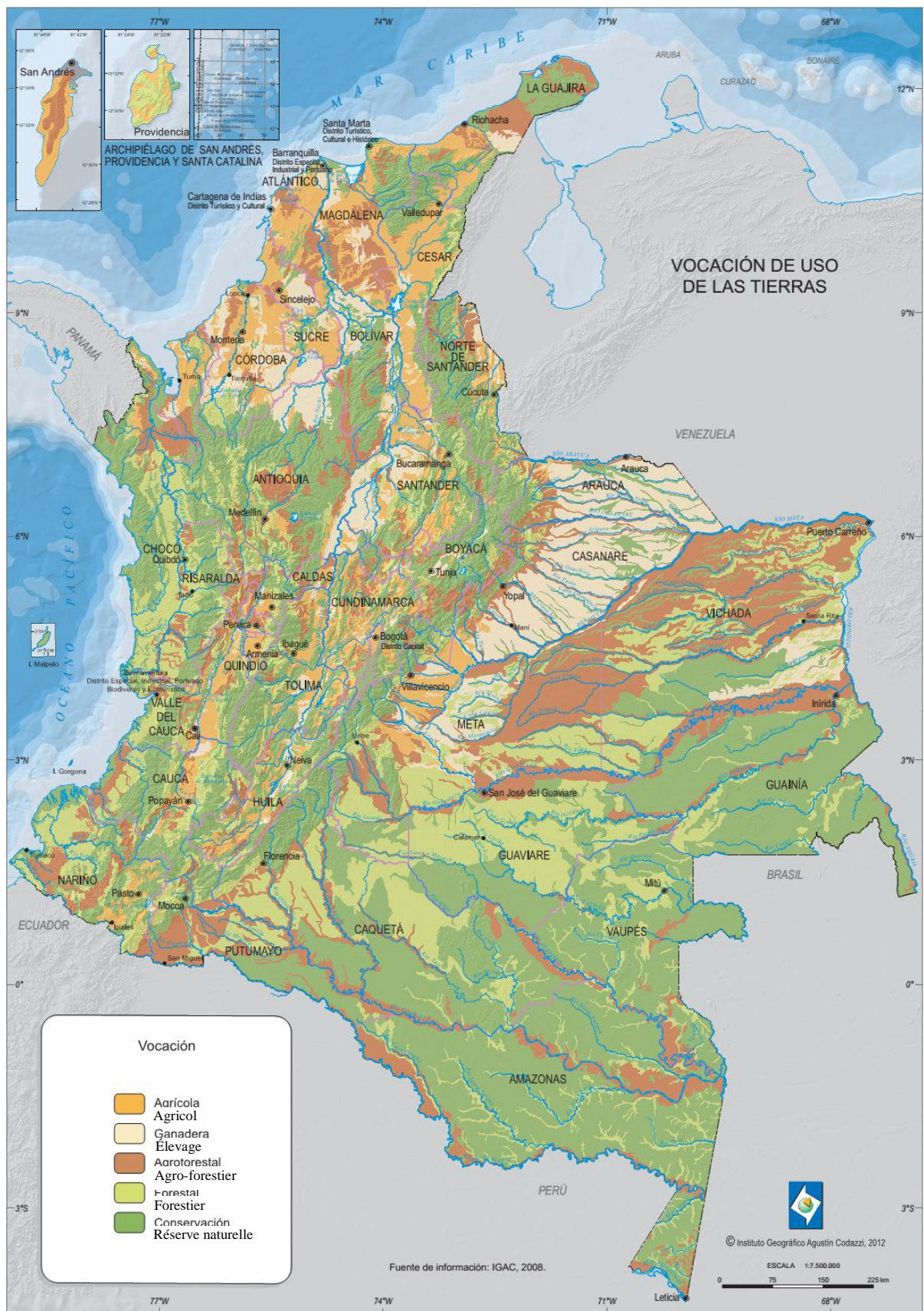
Carte n° 2 : vocation des terres en Colombie