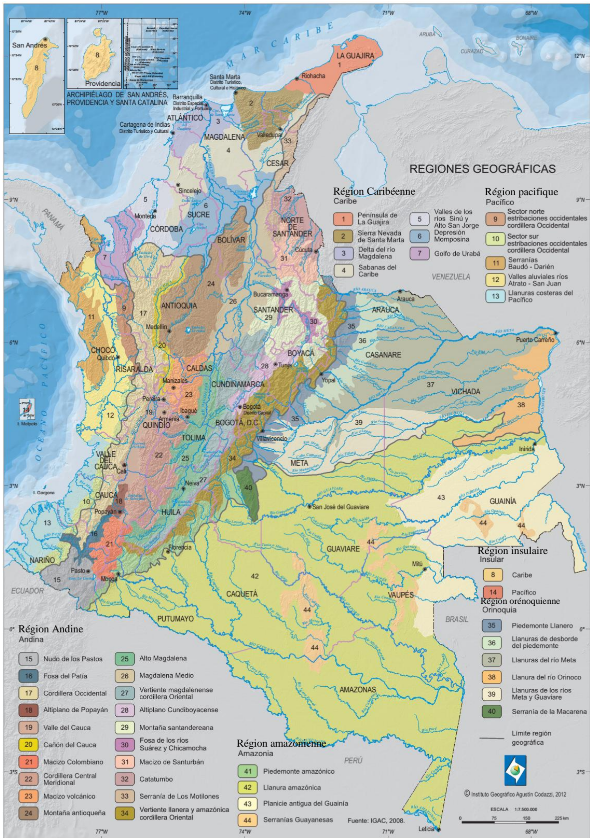
Carte n° 1 : régions géographiques de la Colombie