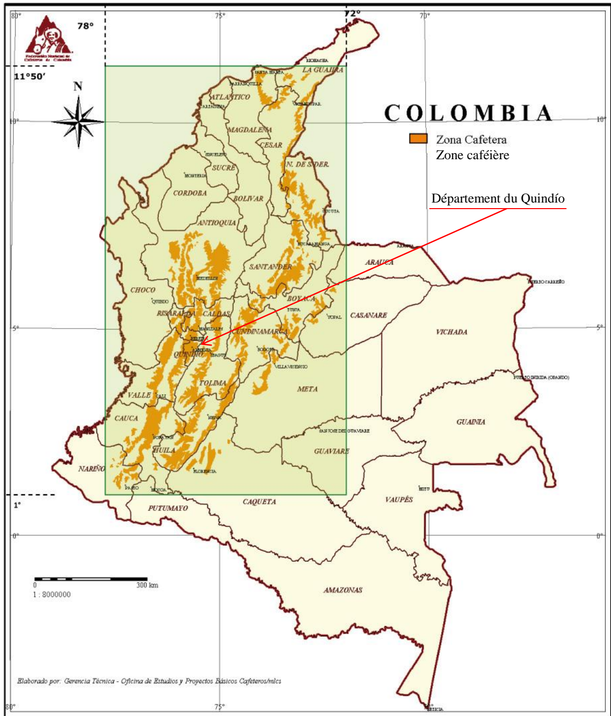
Carte n° 3 : distribution géographique des zones caféières (en orange) en Colombie et localisation du département du Quindío