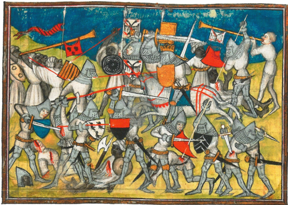
La bataille de Nájera (3 avril 1367) – CUVÉLIER, La chanson de Bertrand Du Guesclin , British Library, Yates Thompson 35, f° 177 (fin du XIV e s.)

A resposta de Henrique foi enviada quando já estava em Nájera e nela o Trastâmara se mostra injuriado pelos feitos de Pedro e não aceita de modo algum resignar-se, afirmando que tem o apoio dos senhores de Castela. Como acreditava ter o auxílio divino a seu lado e buscando mostrar sua valentia, infelizmente, segundo Ayala, que carregava por Henrique o pendão da Banda, este não tomou a melhor decisão e não manteve a vantagem do terreno, já que atravessou o rio Najerilla, afluente do Ebro, e instalou seus efetivos diante da cidade, no campo que ficava entre Nájera e Navarrete. Aquela noite, portanto, seus homens passariam a postos e à primeira hora do dia de sábado uma batalha impiedosa teria lugar.