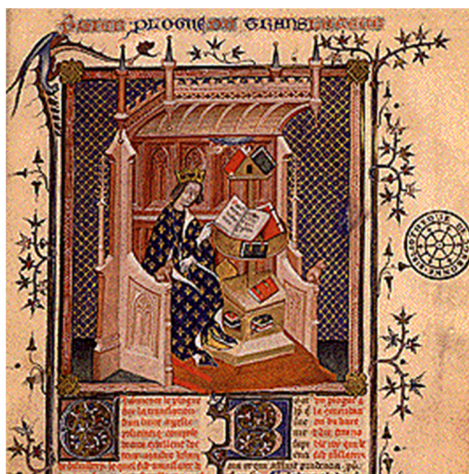
BnF, manuscrits, Français 24287, f° 1.

Como a obra de Cuvelier atendeu tão bem ao horizonte de expectativas de seu público, logo recebeu uma adaptação para a prosa que, aliás, assegurou uma melhor difusão da narrativa sobre o cavaleiro 432 . O que denota o interesse da nobreza pela matéria e por que não pela leitura silenciosa, mais íntima, para os que sabiam ler, dispensando assim o intermédio dos menestrelis e dos grandes serões da corte com seus músicos e outros artistas, ou então, aqueles que dispunham de um letrado para lhes fazer tal leitura, ter a possibilidade de uma atividade mais particular 433 . Na figura a seguir, por exemplo, a cena retratada é do rei Charles V em sua roue à livres lendo o Antigo Testamento. A ilustração está no prólogo da obra Policraticus de John of Salisbury, traduzida para o francês por Denis Foulechat. O que nos chama à atenção, obviamente, não é o exemplar escolhido pelo rei, mas sua atitude de leitura silenciosa e solitária, muito embora a obra afirme o “poder do príncipe, garantia do interesse público, forte com uma majestade que não se lesa impunemente, limitado, no entanto, pela lei de Deus que está acima de tudo” 434 .