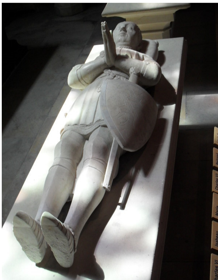
Escultura tumular, datada de 1397, sobre a sepultura de Bertrand Du Guesclin, violada durante a Revolução e reposicionada na Basílica de Saint-Denis, ao lado da de Charles V e de Jeanne de Bourbon

O favor do rei Charles V sobre Bertrand Du Guesclin não se limitaria à sua existência terrena. Após receber a notícia da morte de seu condestável, o monarca ordenou que, ao contrário do que o próprio cavaleiro havia expressado em seu testamento, como veremos nas linhas que seguem, o corpo de Du Guesclin ganhasse uma sepultura digna da família real francesa na basílica de Saint-Denis, necrópole reconhecida há séculos 290 , e ainda determinou que o local fosse aos pés da tumba que havia encomendado para si mesmo aos vinte e sete anos de idade, vê-se aí a manutenção da relação entre o mestre e seu servidor. Nada seria mais notório entre as homenagens que o bretão viria a receber.