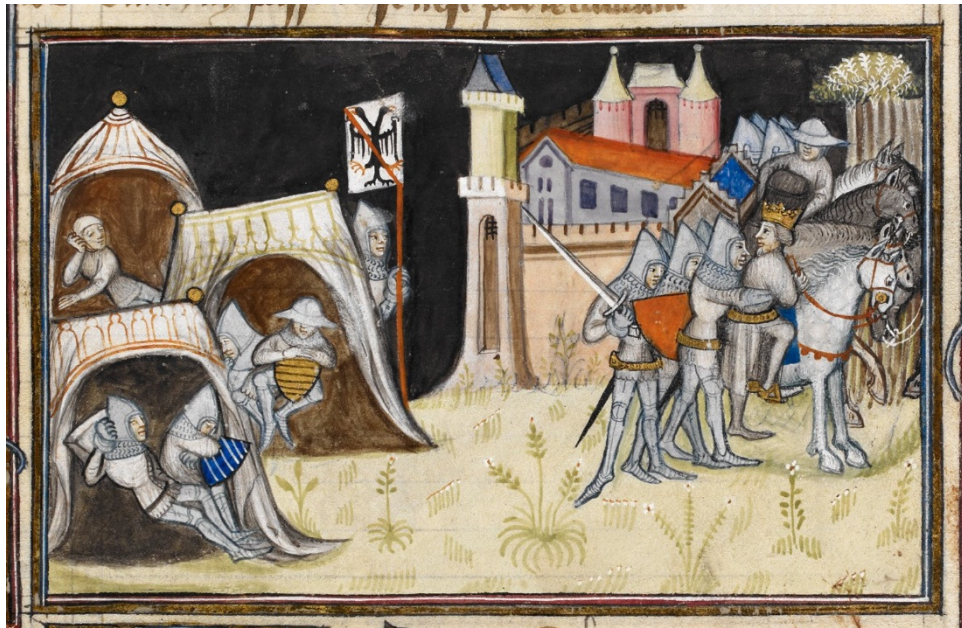
Capture de Pierre I (23 mars 1369) – CUVELIER, La chanson de Bertrand Du Guesclin , British Library, Yates Thompson 35, f° 246 (fin du XIV e s.)

Muito distante da narrativa de Ayala, o relato de Cuvelier continua com imagens bastante impiedosas ao contar como o corpo de Pedro foi tratado: sua cabeça teria sido estocada em uma lança e levada a Sevilha e seu corpo desnudo teria sido colocado em um saco e pendurado em uma das torres do castelo de Montiel. Tal retrato é deveras cru e está longe da exaltação que Ayala, mesmo pertencente ao campo adversário, registrou em seu texto: na opinião do cronista castelhano, morria um rei de 35 anos de idade, muito ardido, amante de mulheres, bom caçador, esforçado, bom guerreiro e rico homem, mas havia matado muitos pelo reino “por lo qual le vino todo el daño que avedes oido”. Assim, ao engrandecer um rei, exaltava o sucessor: Henrique alcançara o seu objetivo e era senhor absoluto de Castela.