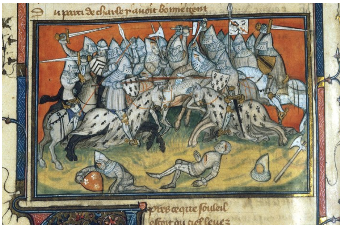
CUVELIER., La Chanson de Bertrand du Guesclin , British Library, Yates Thompson, 35, f° 90 v° ( http://www.bl.uk/catalogues/illuminatedmanuscripts/record.asp?MSID=8125 )

Froissart relata o episódio exaltando as qualidades de Chandos e principalmente sua autoridade diante de seus homens, características muito apreciadas em tais relatos, todavia o que salta aos olhos, é a capacidade de reflexão atribuída ao chefe das batalhas, sinal de sensíveis mudanças, de que já dera provas Du Guesclin, como vimos em Cocherel.