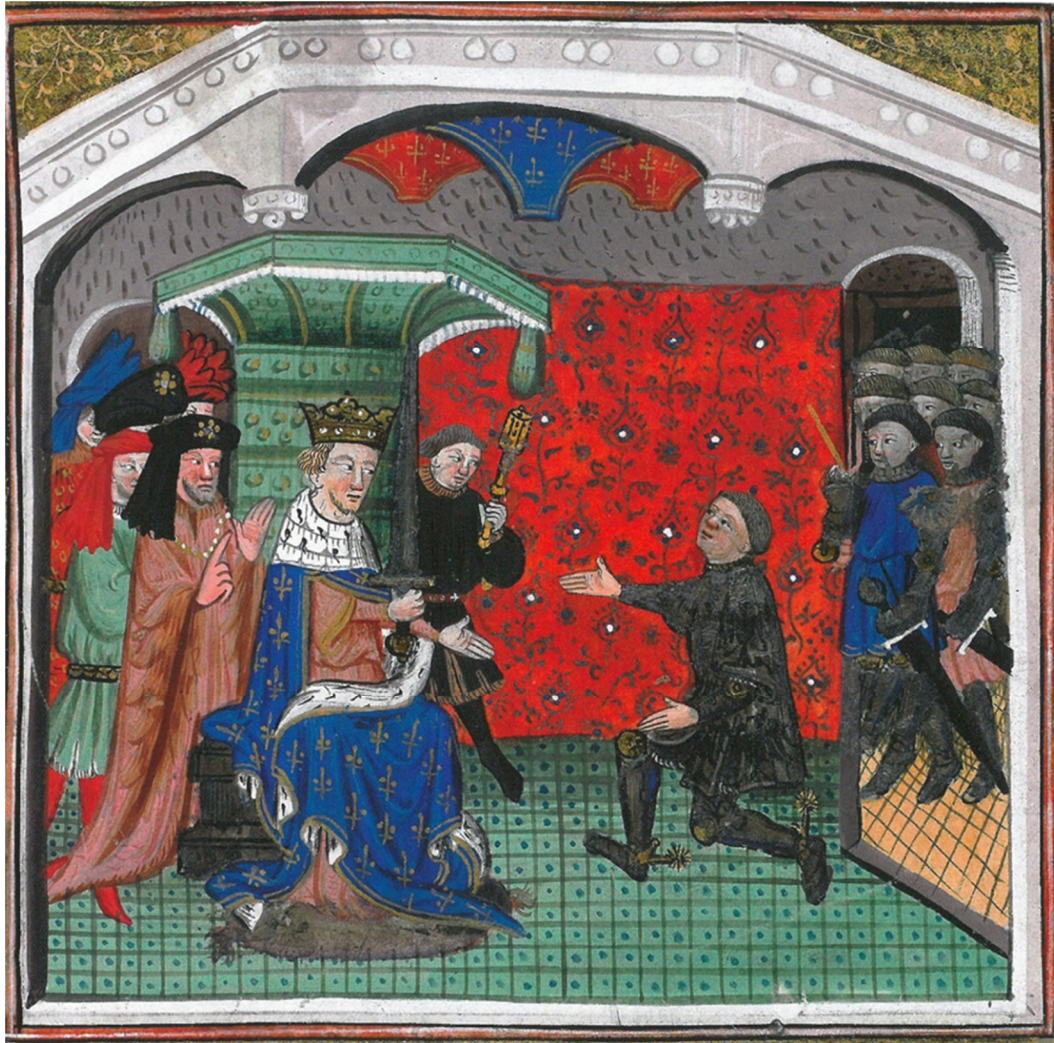
Du Guesclin nommé connétable – Chronique de Bertrand Du Guesclin , (début du XV e siècle), Bibl. mun. Rouen, ms. 1143, f o 4.

A iluminura acima atesta a importância dada aos conselheiros do rei no momento da eleição de Du Guesclin a condestável. Devemos dizer que, na data da realização da obra, os conselheiros do rei Charles VI haviam sido depostos pelos tios, haja vista suas recorrentes crises de demência, dessa forma, o manuscrito ainda coloca em grande importância uma realidade já não mais vista, o que pode até mesmo significar uma crítica ao contexto por que passava o frágil reinado do sucessor do rei sábio.