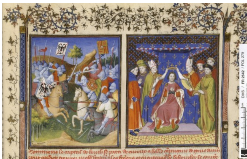
Bataille de Cocherel – Chroniques de Jean Froissart, Bibliothèque Nationale de France, ms fr. 2642, folio 279, séc. XV.

encontro à comitiva de Charles V para lhe fazer “ villenie, vieulté, ennuy ” (humilhação, tormento, tristeza, dor). Froissart e Christine de Pizan ainda atribuem a ideia de impedir a coroação ao próprio Captal. Conforme vemos na iluminura a seguir, que ilustra as Crônicas de Froissart no século XV, a ênfase dada à batalha que ocorreria em Cocherel é a associação direta com a coroação de Charles V, confirmando que a ideia desenvolvida por seus escritos ainda era observada no século seguinte. O que poderia denotar uma continuidade dos valores cavaleirescos tão exaltados pelo cronista de Valenciennes.