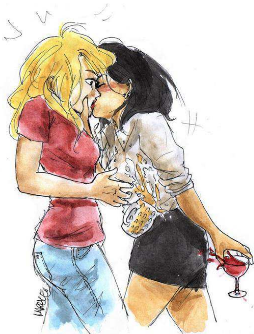
Illustration 1 : @MaryneeLahaye, "Someone had a little too much wine.. #SwanQueen #OUAT #MyArt (a lil bonus in the actual post)", Twitter , 3 septembre 2014.