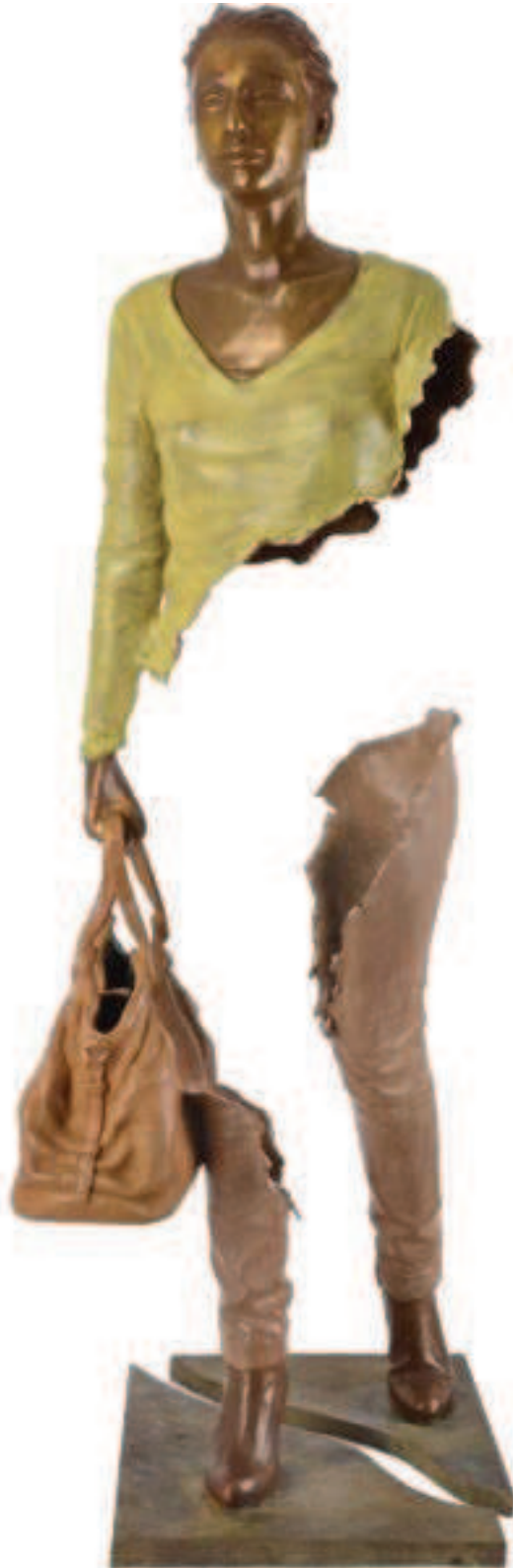
Figure 4 : « sans nom » De la série : Les voyageurs