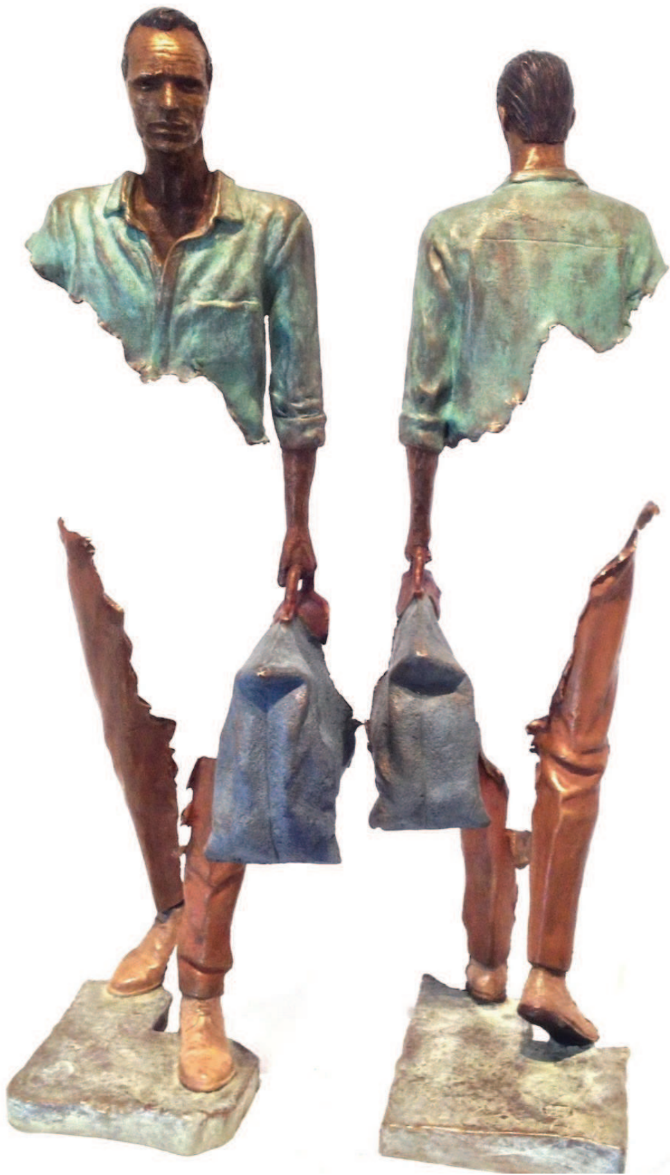
Figure 3 : « sans nom » De la série : Les voyageurs