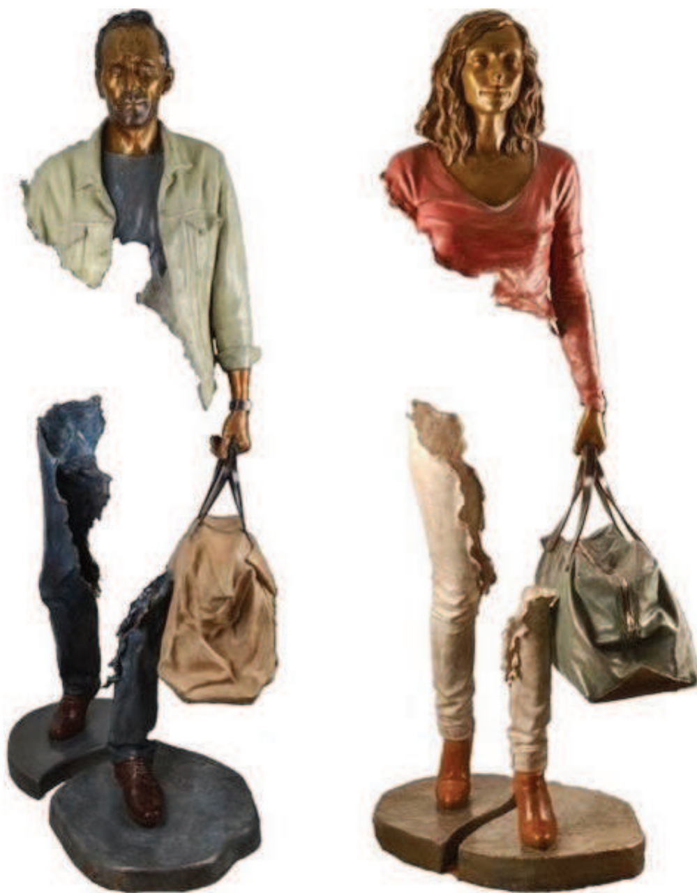
Figure 1 : Bruno Catalano (1960 - ), Moi-même et Emilie , sculpture en bronze original. Tirage limité à 12 exemplaires. De la série : Voyageurs . Sans date 1 .