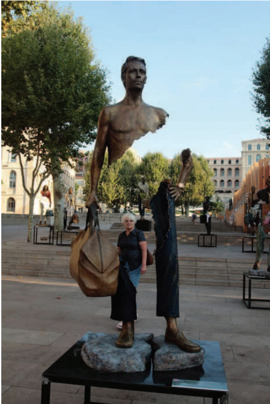
Figure 2 : Exposition à Marseille.