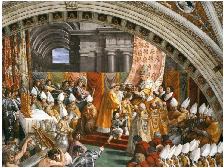
Incoronazione di Carlomagno Raffaello Sanzio 1516. Stanza dell'incendio di Borgo. Musei Vaticani

physionomie à François I er 563 . Sur un cartel s'affichent les mots : « Carolus Magnus Ro(manae) Ecclesiae Ensis Clypeusq(ue) », Charlemagne, glaive et bouclier de l'Église romaine. La ressemblance paraît telle que même Giorgio Vasari crut voir dans la peinture l'illustration du couronnement du Valois 564 .