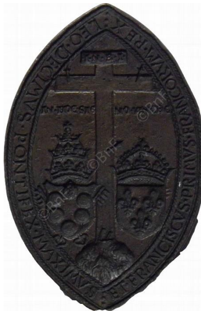
Matrice du sceau de la croisade. France, 1516-1517. Alliage cuivreux à patine translucide. Longueur : 57 mm ; largeur : 36 mm, hauteur : 18 mm. Bnf, département des Monnaies, Médailles et Antiques, inv. M 12

Premièrement, elle souhaite afficher la communion d'esprit qui doit exister entre le roi et l'Église. Deuxièmement, elle suggère une sorte d'égalité entre les deux autorités. Pour finir – élément qui nous intéresse de près ici –, ce sceau se fait véritable allégorie et propose un rapprochement incontestable entre le premier empereur chrétien et François I er . Ainsi faisant, elle investit de légitimité les prétentions au trône impérial que celui-ci manifeste déjà et, qui plus est, elle laisse sous-entendre la bénédiction pontificale 571 .