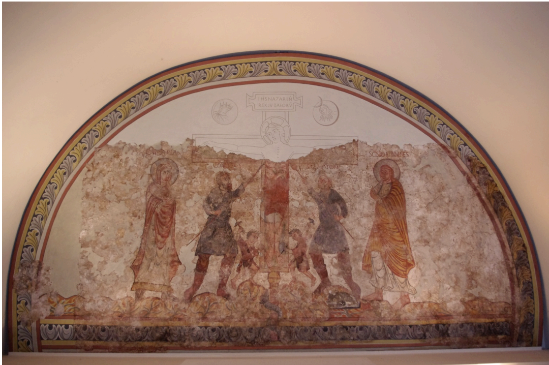
Figure 106 : Trèves, église de Sankt Maximin, crypte, salle médiane, mur occidental, tympan, Crucifixion , peinture conservée au Museum am Dom de Trèves

Situation actuelle : Allemagne, Rhénanie, Trèves