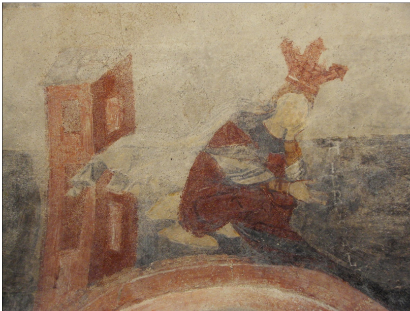
Figure 98 : San Vincenzo al Volturno, la personnification de Jérusalem