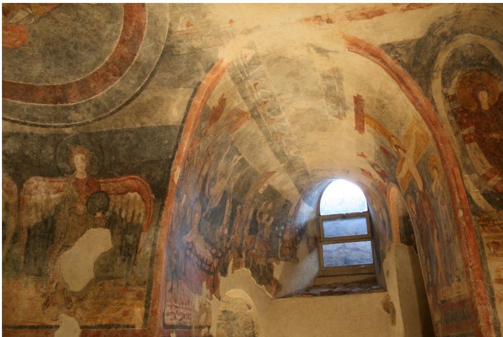
Figure 103 : San Vincenzo al Volturno, bras nord : Crucifixion, Christ entouré de deux saints (niche), Saintes Femmes au tombeau (paroi droite), Martyres de saint Laurent et de saint Étienne (paroi gauche)