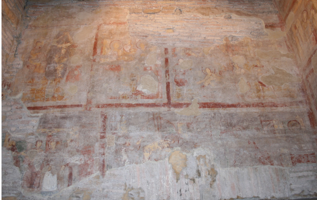
Figure 73 : Ss Nereo e Achilleo, peintures de la paroi nord-ouest, scènes de martyres

Ce cycle est donc manifestement de type hagiographique. Cependant, alors que certains identifient cet ensemble à la Passio légendaire des deux saints patrons, d'autres y voient davantage un triple cycle hagiographique consacré à saint Sébastien, sainte Cécile et saint Urbain 264 , auquel s'ajouteraient quelques panneaux à caractères votifs, dont la Crucifixion 265 . Quelle que soit l'identification des autres scènes, il n'en reste pas moins qu'il s'agisse d'un ou plusieurs cycles hagiographiques, mis en parallèle avec l'exemple premier du martyr, celui du Christ sur la croix.