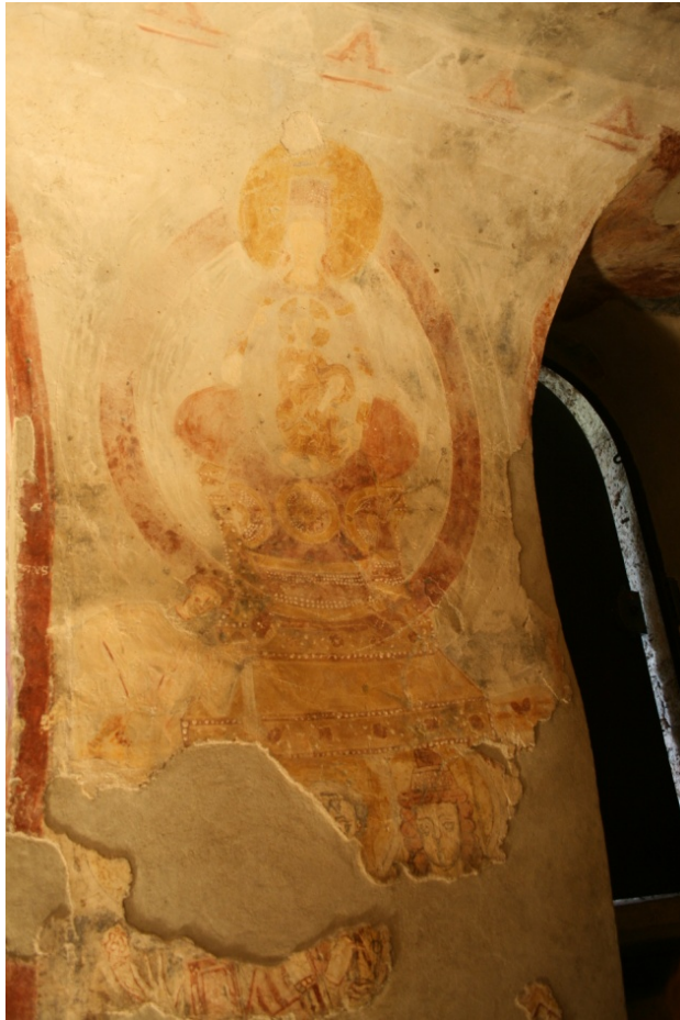
Figure 100 : San Vincenzo al Volturno, bras sud : Vierge à l'Enfant et religieux prosterné