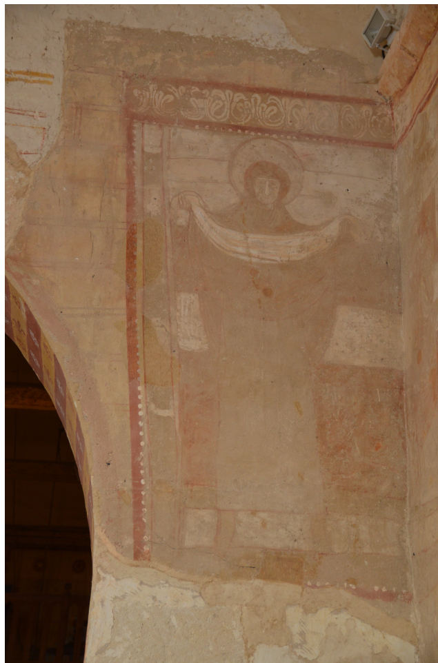
Figure 86 : Saint-Pierre-les-Églises, Maria Jacobi