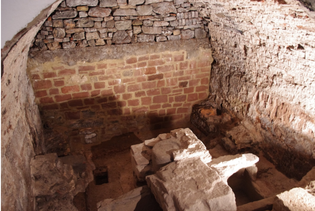
Figure 108 : Trèves, vue actuelle de la crypte en direction de l'est, avec le sarcophage et l'autel au premier plan