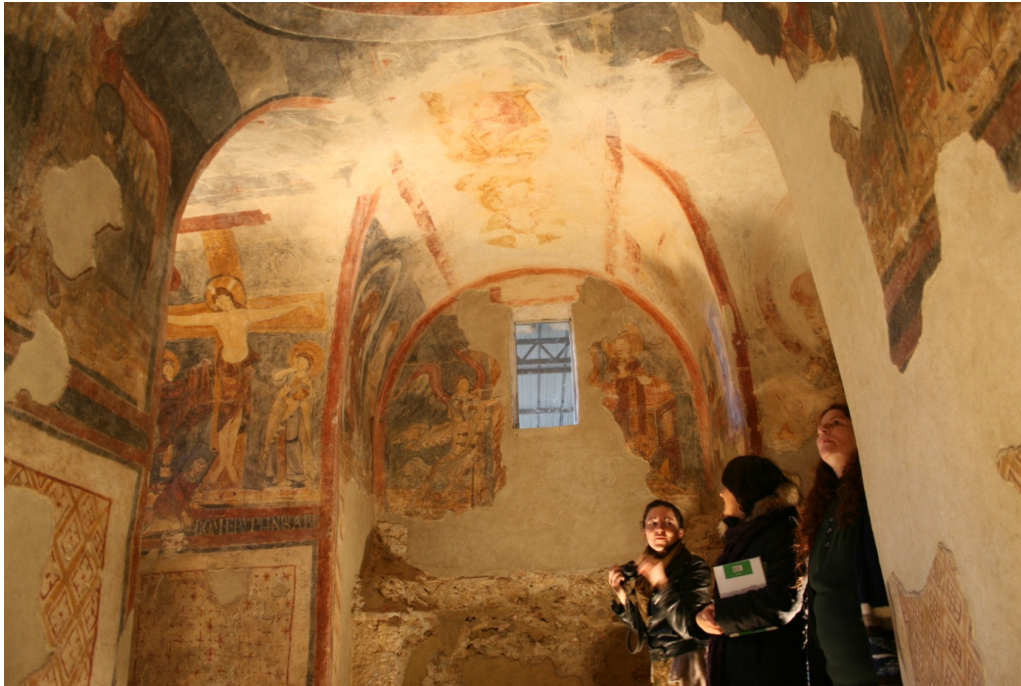
Figure 102 : San Vincenzo al Volturno, bras est : Annonciation, Nativité (sur la paroi de gauche), Bain de l'enfant (à droite) et Christ trônant sur un globe sur la voûte