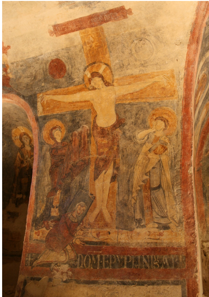
Figure 91 : San Vincenzo al Volturno, église Santa Maria in insula (?), crypte, transept droit, mur est, Crucifixion

Situation actuelle : Italie, Molise, San Vincenzo al Volturno