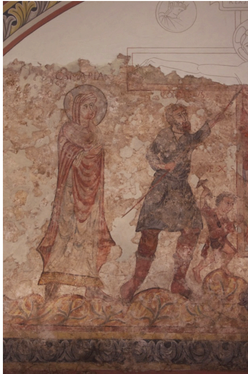
Figure 110 : Trèves, Crucifixion , détail : la Vierge, Longin et le soldat de gauche