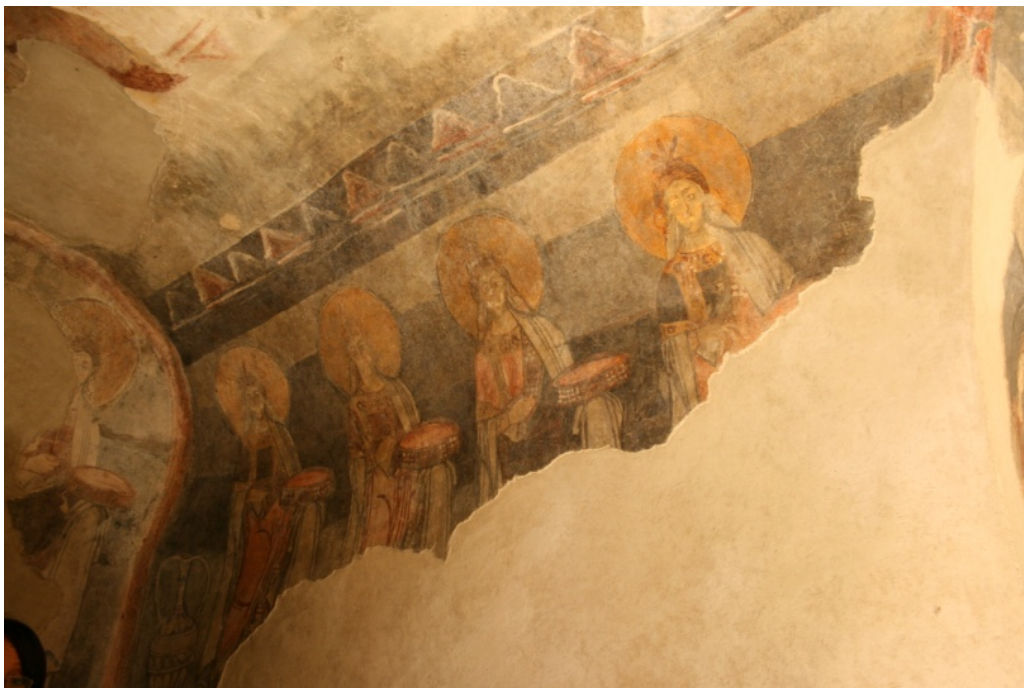
Figure 101 : San Vincenzo al Volturno, bras sud, Théorie de saintes