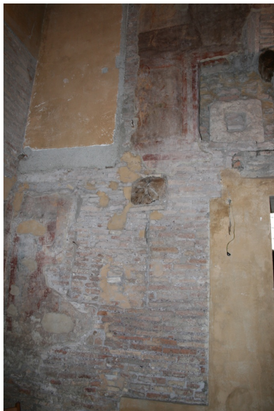
Figure 72 : Ss Nereo e Achilleo, paroi sud-ouest avec les quelques restes de peintures