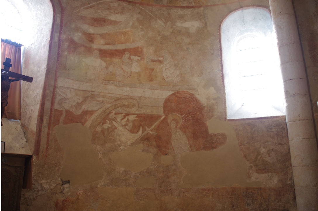
Figure 89 : Saint-Pierre-les-Églises, Bain de l'Enfant (registre supérieur) et Combat de Michel contre le dragon (registre inférieur)