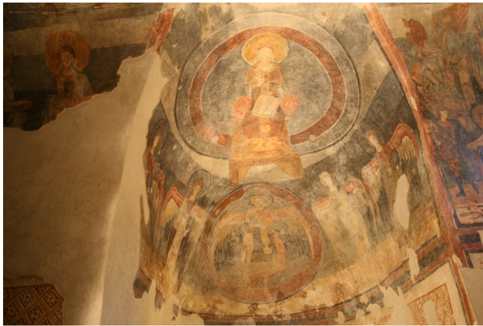
Figure 104 : San Vincenzo al Volturno, bras ouest, Théorie d'archanges et Vierge trônant

L'ensemble constitue une savante composition réunissant un cycle christologique dont le début se situe à l'Annonciation et la fin à la scène des Saintes Femmes au tombeau (bras est et bras nord), des scènes hagiographiques, avec la représentation des deux martyres, le tout associé à des personnages en majesté (Vierge à l'Enfant, Christ trônant et Christ en majesté) accompagnés de processions d'archanges et de saintes.