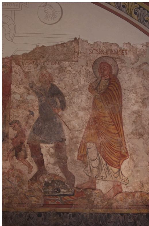
Figure 111 : Trèves, Crucifixion , détail : Stephaton, Jean et le soldat de droite