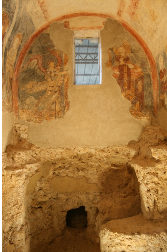
Figure 95 : San Vincenzo al Volturno, vue intérieure de la crypte : bras est avec les restes d'une construction (tombe ? autel ?) et la fenestella ouvrant sur la nef de l'église