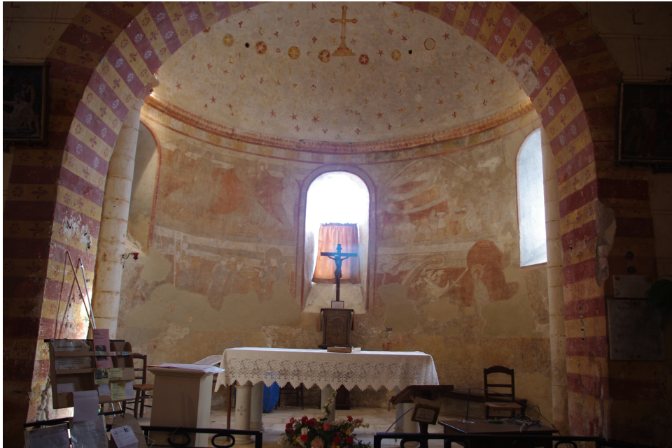
Figure 85 : Saint-Pierre-les-Églises, vue du chœur depuis la nef