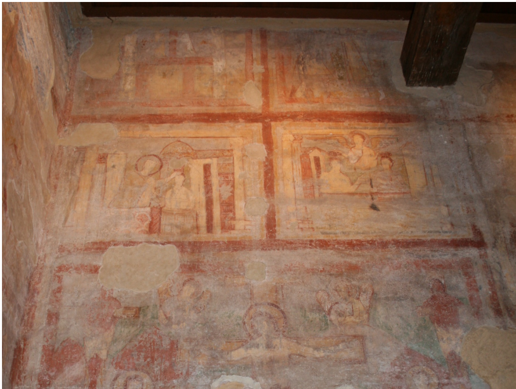
Figure 70 : Ss Nereo e Achilleo, peintures de la paroi nord-est avec la Crucifixion , un baptême et un couronnement