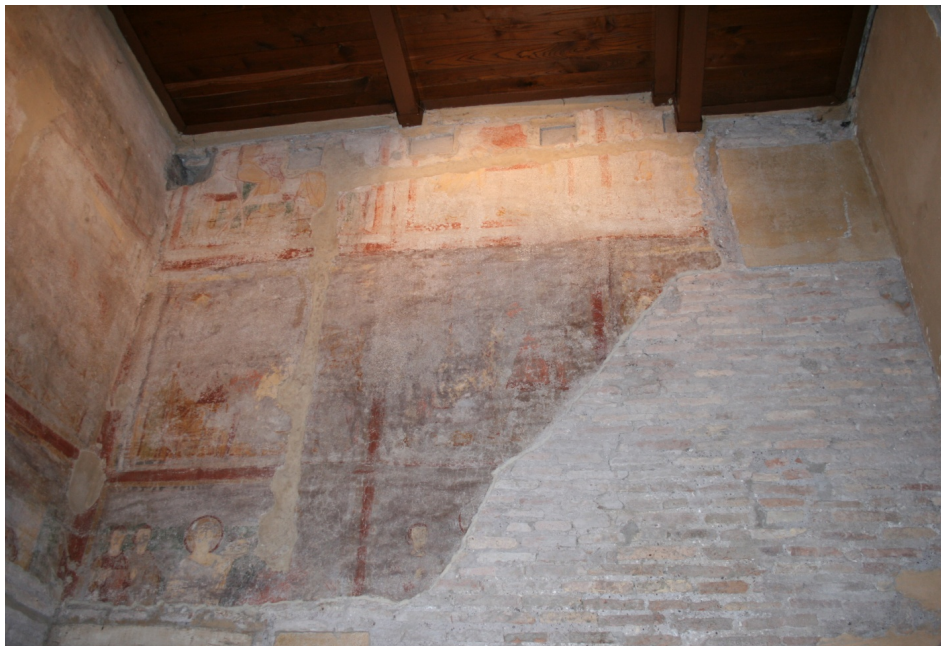
Figure 71 : Ss Nereo e Achilleo, peintures de la paroi sud-est