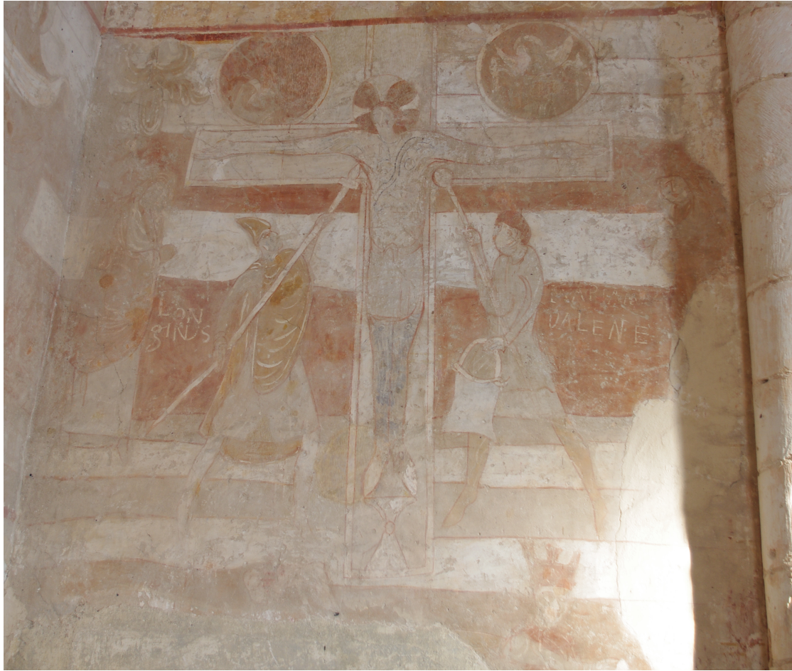
Figure 81 : Chauvigny, église de Saint-Pierre-les-Églises, chœur, mur nord, Crucifixion

Situation géographique : France, Poitou, Chauvigny