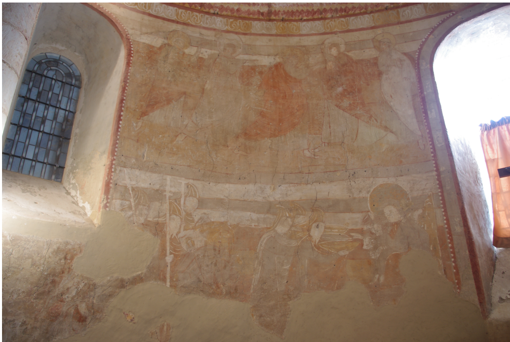
Figure 88 : Saint-Pierre-les-Églises, Visitation (registre supérieur), Chevauchée des Mages et Adoration des Mages (registre inférieur)