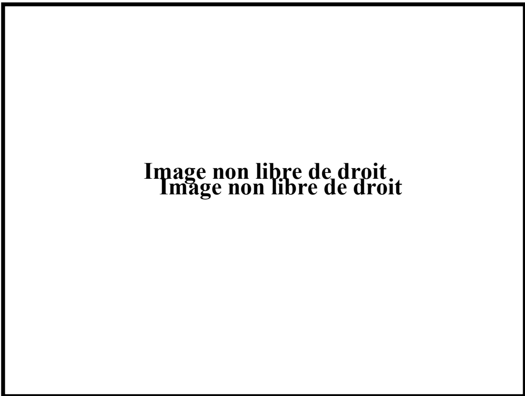
Figure 109 : Trèves, vue de la crypte vers l'ouest et son décor avant le détachement des fresques (d'après M. EXNER, 1989, p. 263, ill. 38)