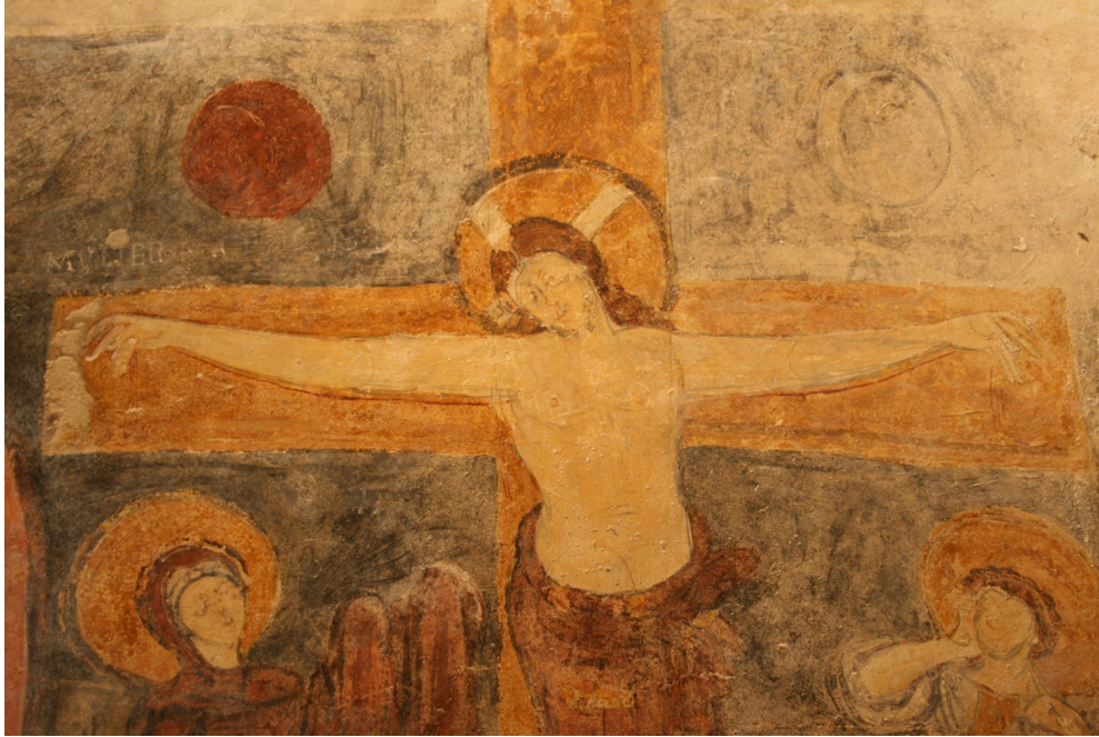
Figure 97 : San Vincenzo al Volturno, Crucifixion , détail de la partie supérieure de la composition