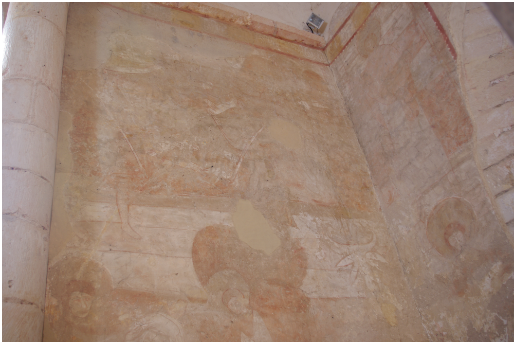
Figure 90 : Saint-Pierre-les-Églises, scènes difficilement identifiables de la paroi sud et saints en pied sur le mur de droite