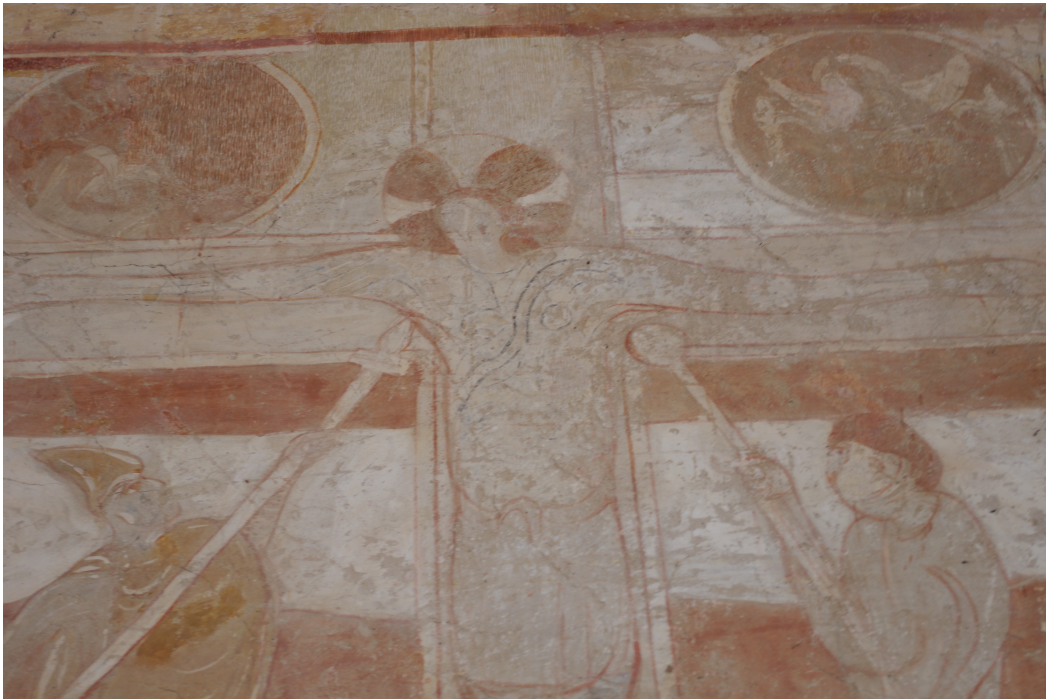
Figure 84 : Saint-Pierre-les-Églises, Crucifixion , détail du haut de la scène