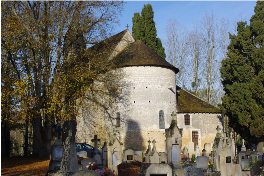
Figure 83 : Saint-Pierre-les-Églises, vue de l'église depuis l'est (cliché J. MERIECA, 2012)