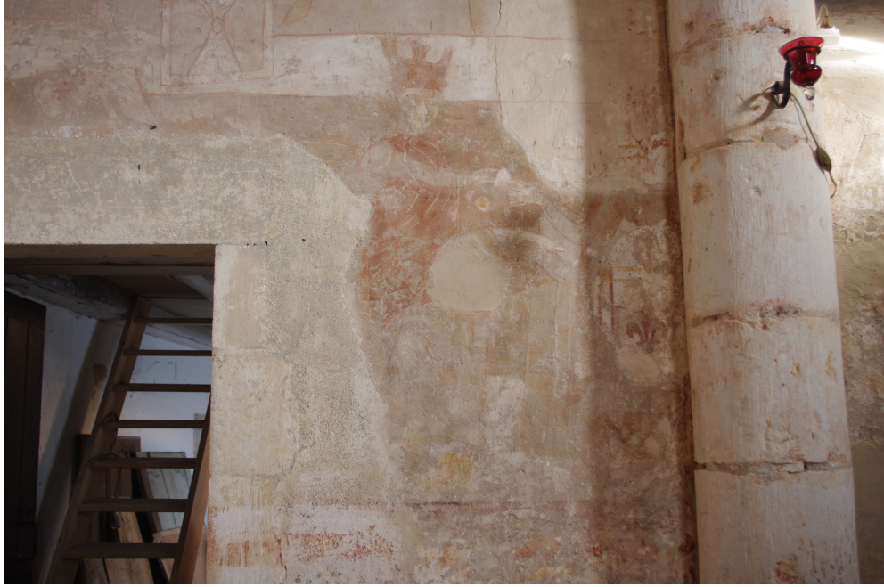
Figure 87 : Saint-Pierre-les-Églises, Hérode ?