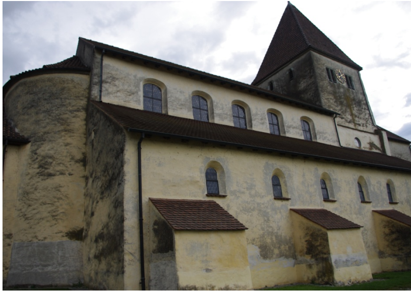
Figure 33 : Reichenau, vue du flanc sud de l'église St Georg