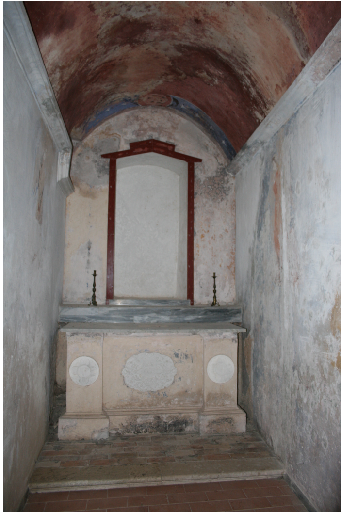
Figure 54 : Roccasecca, vue du bras gauche du transept avec son autel