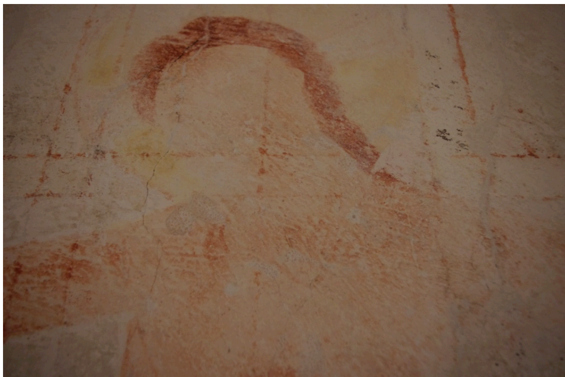
Figure 35 : Reichenau, Christ en croix sud , détail du haut du corps

Toujours est-il que le choix iconographique de cet ensemble est un hapax, puisque visiblement aucun des personnages habituellement représentés au pied de la croix (la Vierge, Jean, Longin, Stephaton,...) n'est figuré. L'association des deux saints avec les Christs en croix rappelle cependant l'iconographie ancienne de la Croix glorieuse, que l'on trouve notamment dans les édifices romains (Santo Stefano Rotondo par exemple) 161 .