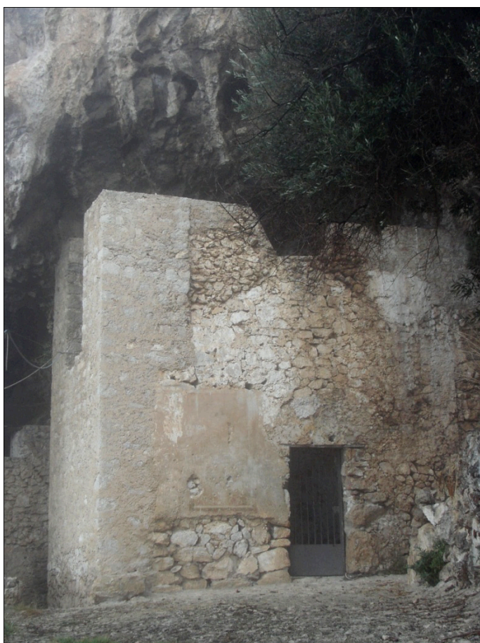
Figure 51 : Roccasecca, vue de la chapelle San Michele

Selon Simone Piazza 208 , il est indéniable que la structure a subi de nombreuses modifications. En observant les murs, on peut distinguer une phase de construction plus ancienne, correspondant à la phase primitive visible dans la zone centrale du mur est : elle est matérialisée par un niveau constitué de blocs calcaires de taille plus grosse. Il est possible que la couverture d'origine ait été faite de tuiles. L'abside et le mur du fond du bras droit du transept appartiennent à la phase la plus ancienne de la construction. Il n'est pas improbable que l'édifice primitif était constitué d'une nef unique, terminée par une abside, et protégé par une couverture à deux pans.