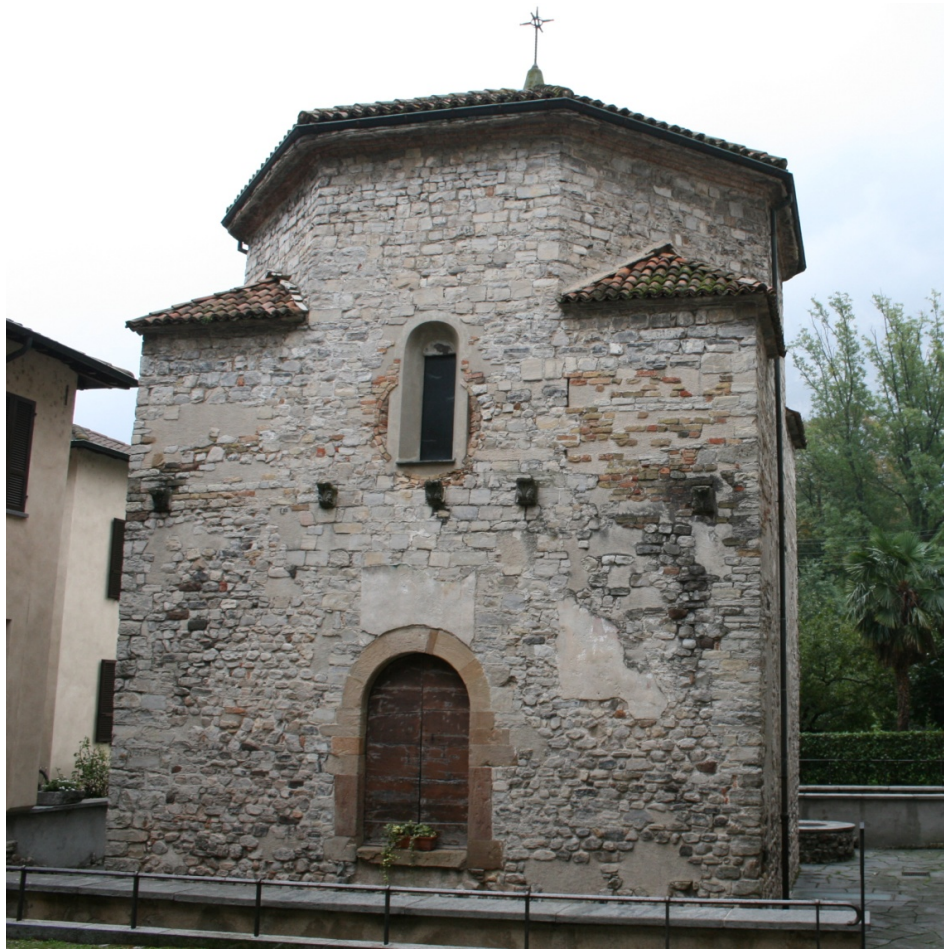
Figure 41 : Riva San Vitale, baptistère vu de l'ouest avec les fondations du mur qui en faisait le tour