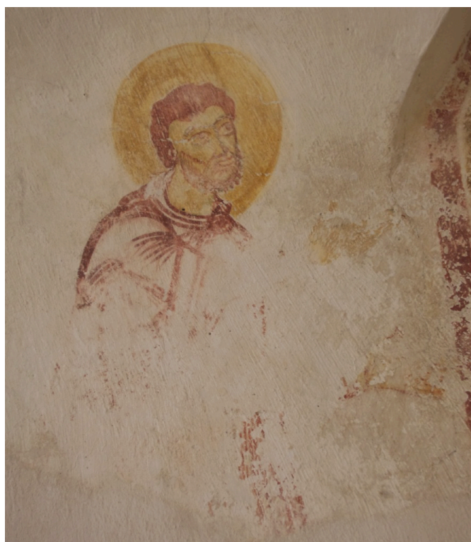
Figure 37 : Reichenau, figure de l'« adorant » sud (cliché J. MERCIÉCA, 2011)