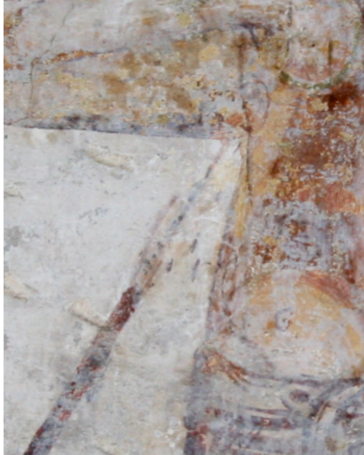
Figure 45 : Riva San Vitale, détail de la lance avec ses deux « extrémités » visibles et des gouttes de sang (?)