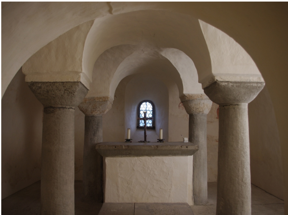
Figure 34 : Reichenau, vue de la crypte en direction de l'est