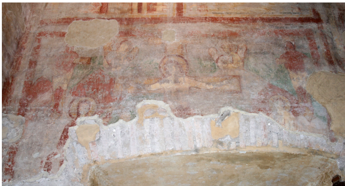
Figure 65 : Ss Nereo e Achilleo, tour nord, niveau inférieur, mur est, Crucifixion

Situation actuelle : Italie, Latium, Rome