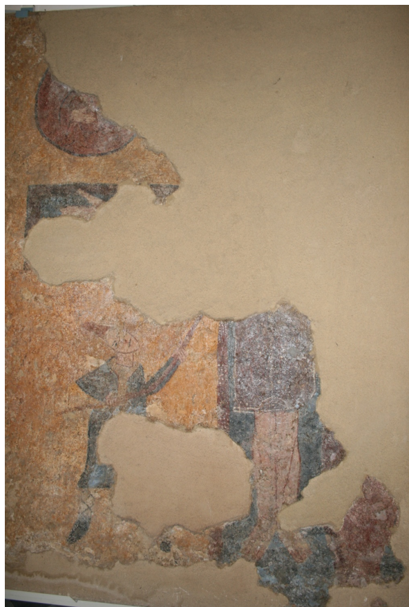
Figure 49 : Roccasecca, Crucifixion provenant de l'église Sant'Angelo in Asprano (bras droit du transept), aujourd'hui conservée dans l'église de Caprile