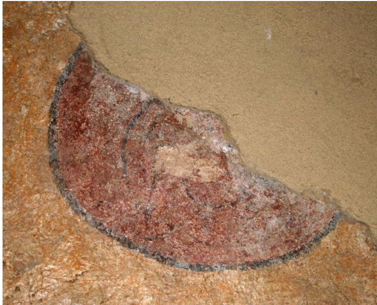
Figure 55 : Roccasecca, Crucifixion , détail du Soleil

La présence du Soleil implique probablement celle de la Lune de l'autre côté de la croix. De même, un autre personnage faisait probablement pendant à Longin à la gauche du Christ. La tradition iconographique associe généralement Stephaton, le porte-lance. Néanmoins, la présence d'une masse rouge au bas de la composition à droite de la croix tend à exclure cette hypothèse, Stephaton étant toujours représenté avec une tunique courte. Habituellement, Jean est figuré à cet emplacement, cependant, on ne peut écarter la possibilité que la Vierge fût représentée, l'association entre Marie et Longin au bas de la croix se retrouvant dans la peinture plus tardive de Monte Monaco di Gioia, située non loin de Roccasecca. Du reste, la présence d'un donateur est aussi envisageable 211 .