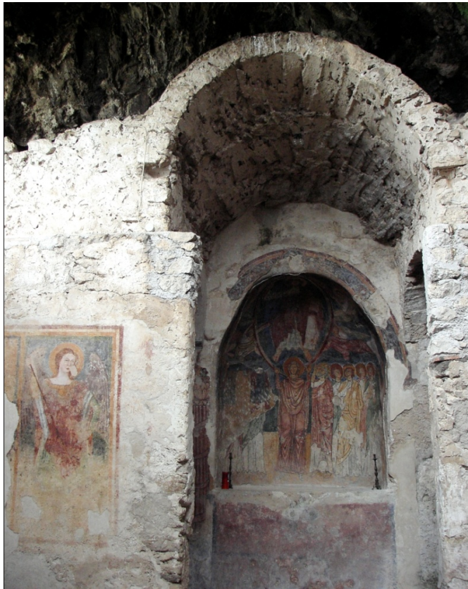
Figure 52 : Roccasecca, vue du chœur et du transept avec sa couverture