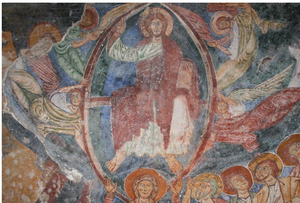
Figure 56 : Roccasecca, Ascension peinte dans l'abside

Christ trône dans une mandorle portée par quatre anges et surmontant un cortège de personnages, dont la Vierge au centre en position d'orante entourée de chaque côté des apôtres. L'ensemble était encadré d'une frise ornée de motifs ornementaux et végétaux, ainsi que de deux colonnes. Cette décoration est attribuée au XII e siècle 212 . L'autel contient aussi quelques traces picturales qui semblent être les restes de représentation de vela dont la datation nous est inconnue. Dans la partie gauche de l'abside, une partie de l'enduit s'est détachée, mettant au jour une couche picturale manifestement plus ancienne et qui serait contemporaine de la Crucifixion. Sur un fond ocre-jaune, un personnage nimbé en pied est représenté. Il porte une longue barbe pointue et tient une croix dans sa main droite. Il s'agit donc d'un martyr. À sa droite, un peu plus haut, il reste la partie inférieure d'un autre personnage. Selon S. Piazza 213 , cette décoration initiale devait réunir une théorie de martyrs encadrant peut-être une Ascension.