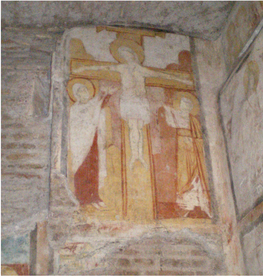
Figure 58 : San Clemente, église basse, nef, mur est, Crucifixion

Situation géographique : Italie, Latium, Rome