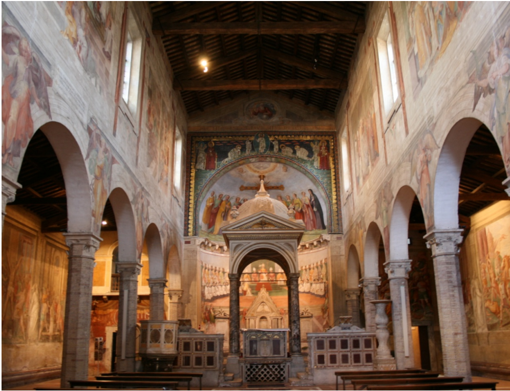
Figure 67 : Ss Nereo e Achilleo, vue de la nef et de ses décors refaits sous Sixte IV