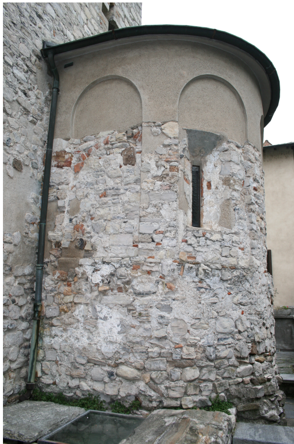
Figure 44 : Riva San Vitale, mur extérieur de l'abside orientale