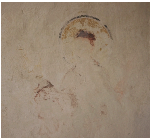
Figure 36 : Reichenau, figure de l'« adorant » nord (cliché J. MERCIÉCA, 2011)