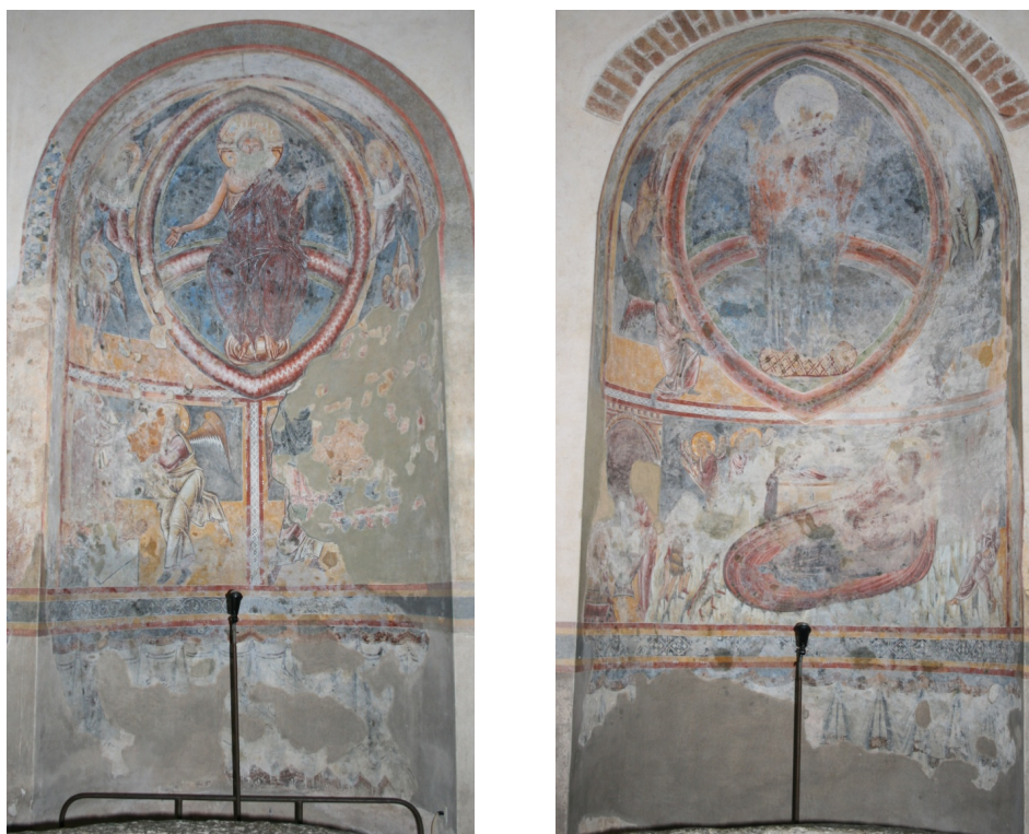
Figures 47 et 48 : Riva San Vitale, absides nord-est et sud-est avec leurs décors (clichés J. MERCIECA, 2010)

baptistère. Le décor pouvait donc être vu au moment du baptême, créant un lien entre l'événement fondateur du sacrement baptismal et de l'Eucharistie et son actualisation dans le temps présent du rituel. En outre, quelle fonction avait l'abside, son autel et son décor dans le baptistère ? Est-il possible que la communion suivant le baptême ait été pratiquée à cet endroit ? À moins que cet autel, contenant les reliques de saint Jean au XVI e siècle, ait servi (également ?) d'oratoire secondaire où était célébrée la messe 198 ?