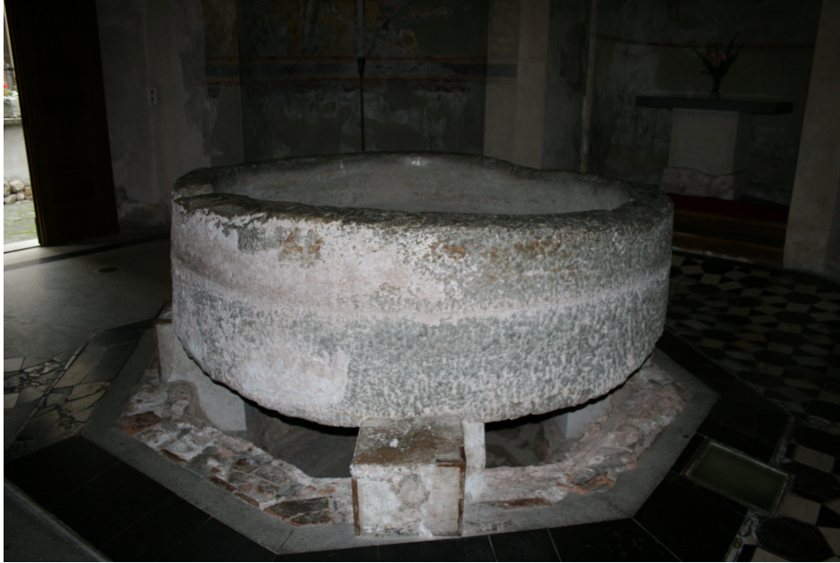
Figure 43 : Riva San Vitale, vue des deux vasques baptismales (cliché J. MERCECA, 2010)