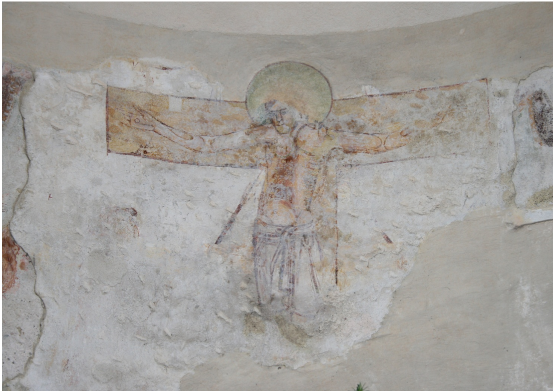
Figure 39 : Riva San Vitale, baptistère, abside, Crucifixion

Situation actuelle : Suisse, Canton du Tessin, Riva San Vitale