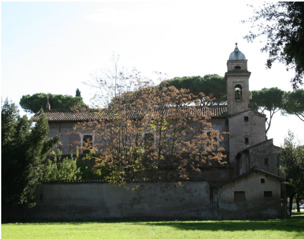
Figure 68 : Ss Nereo e Achilleo, vue de l'église depuis le côté nord-ouest