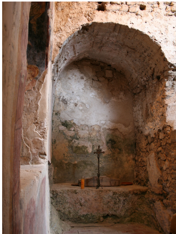
Figure 53 : Roccasecca, vue du bras droit du transept avec la maçonnerie (un autel ?)