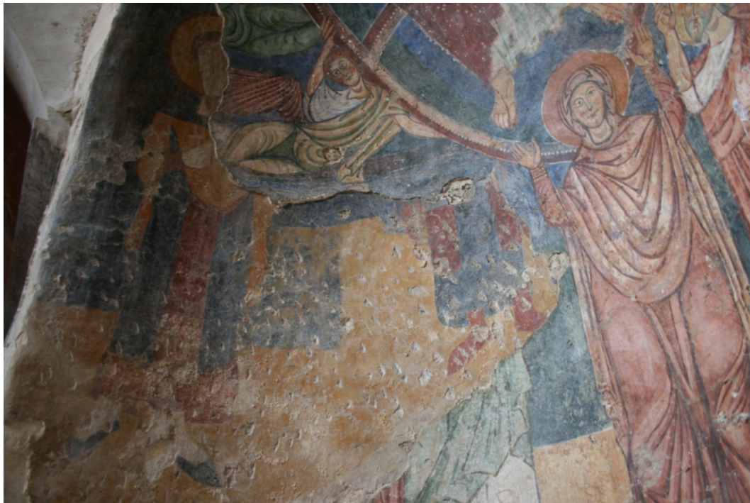
Figure 57 : Roccasecca, vue de la couche inférieure de la peinture dans l'abside avec les saints martyrs en pied

Compte tenu de l'état détérioré des peintures et surtout des nouvelles scènes peintes qui ont recouvert les plus anciennes, il n'est pas évident de restituer la scénographie originelle et la lecture ne peut être complète. Y avait-il d'autres scènes qui complétaient cet ensemble glorifiant le Christ ? Il est indéniable que la Crucifixion était représentée au plus près du chœur. Une autre lecture est aussi possible compte tenu de l'emplacement initial du décor au-dessus de cette plateforme maçonnée : si l'on considère que cette dernière avait une fonction d'autel, alors cette partie de l'édifice pouvait servir d'oratoire secondaire, de lieu dévotionnel, voire de lieu où était pratiquée l'Eucharistie. Dans ce cas, comme à Trèves, la Crucifixion surmontait l'autel, créant ainsi une dialectique visuelle et spatiale entre le sacrifice du Christ et le sacrifice eucharistique.