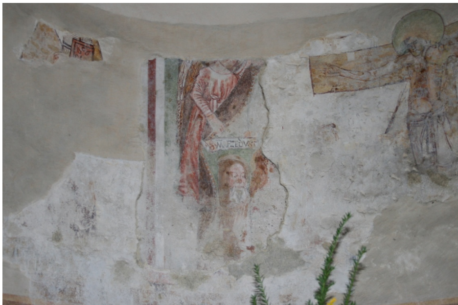
Figure 46 : Riva San Vitale, partie gauche de l'abside (cliché J. MERCECA, 2010)