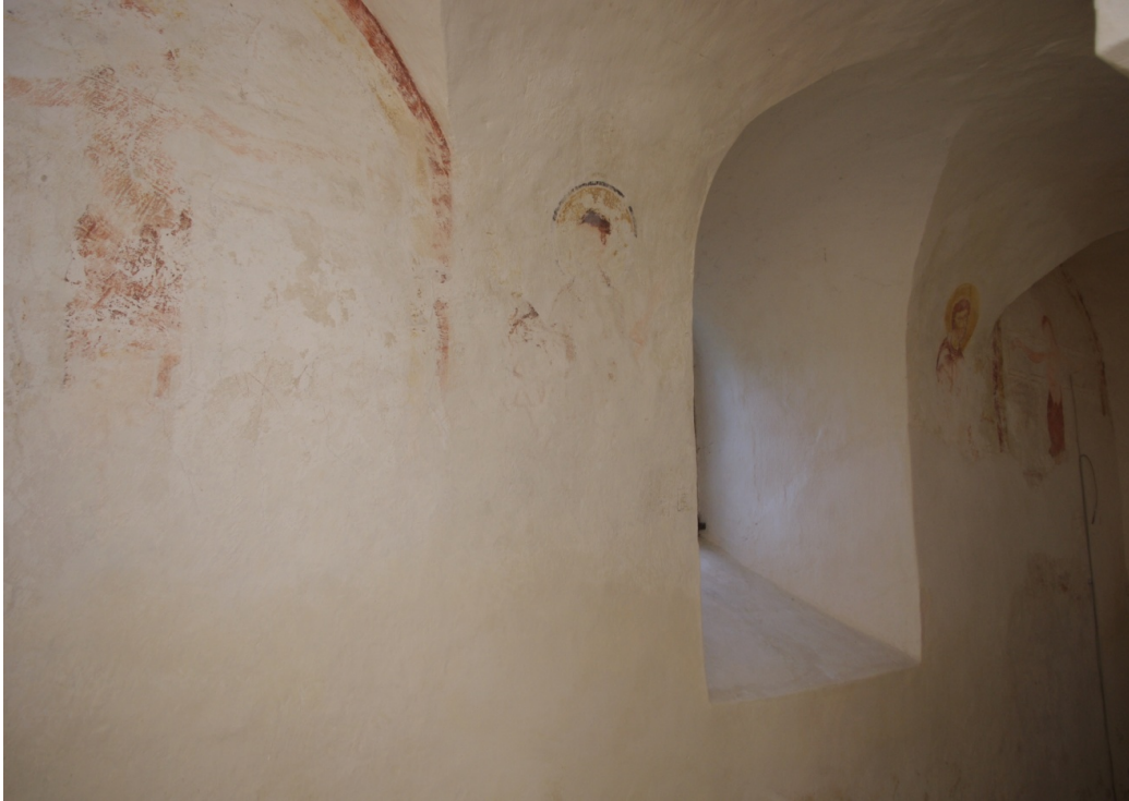
Figure 38 : Reichenau, vue des deux ensembles peints de la crypte