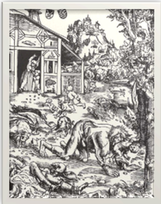
Le loup-garou , par Lucas Cranach l'Ancien, vers 1512, gravure sur bois, 162 × 126 mm, Gotha, Herzogliches Museum

tous les phénomènes de la possession 578 ». D'après ce texte, on constate que le diable ordonne au sorcier d'agir. Il manipule pour se faire servir, prenant plaisir à aller contre la nature des possédés. Loin des courants psychologiques du XX e qui y auraient vu une manifestation de l'inconscient, les intellectuels de l'époque y voient la manifestation du malin devant la faiblesse des hommes