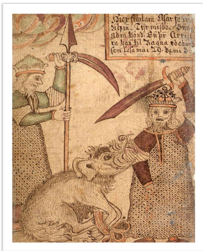
Fenrir arrache la main de Tyr, manuscrit Sàm 66, 1765, Copenhague, bibliothèque royale. Gleipnir comme un ruban de soie.

font aucun bruit en se déplaçant, on comprend mieux ce que cela peut avoir d'extraordinaire. Les autres morceaux reposent sur un principe contradictoire identique, gage de la puissance de l'entrave. Le deuxième morceau est ainsi constitué de poils de barbe de femme, le troisième des racines des montagnes, le quatrième de nerfs d'ours, le cinquième d'haleines de poissons et le dernier de crachats d'oiseaux. Ces éléments, une fois assemblés, forment un lien semblable à de la soie mais infiniment plus solide, ce qui crée la stupeur et la joie auprès des dieux, qui y voient enfin le moyen d'attacher Fenrir.