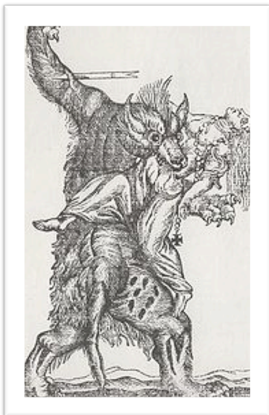
Un loup-garou sur une gravure du XVIIIe siècle

prêtre et théologien, Nicolas de Malebranche est un cartésien convaincu qui mêle tout autant Dieu que sciences médicales pour concevoir une approche rationnelle de la religion, fondation de toute chose, y compris du cogito (je pense) de Descartes. Malebranche fait ainsi un lien ténu pour expliquer que si Dieu intervient sur les loups garous ce n'est pas en les transformant physiquement