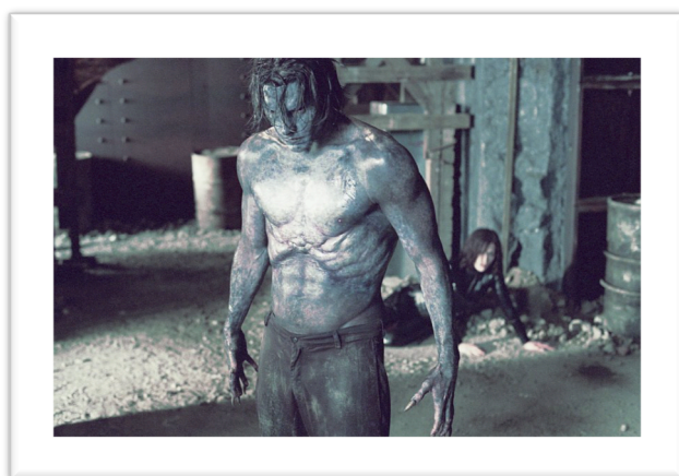
Michael Corvin sous sa forme hybride

assoiffé de sang qui habite ces créatures rend toute tentative de les commander vaine et nécessite bien sûr de les éradiquer pour limiter les pertes humaines qui montent rapidement.