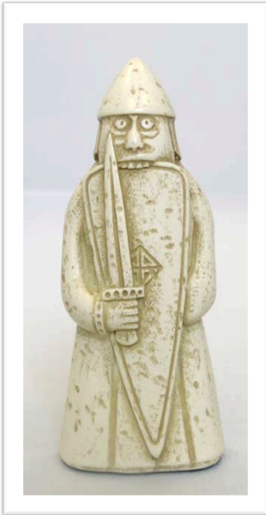
Statue guerrier berserk, musée national d'Ecosse

Dans la mythologie nordique, on rencontre fréquemment des références aux guerriers berserker , des guerriers-prêtres particulièrement puissants. Si l'origine exacte du terme semble discutable, en revanche, la plupart des explications qui en sont données tendent vers la même considération. Deux d'entre elles marquent particulièrement les esprits : la première viendrait du