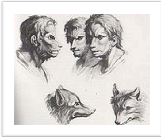
Gravures du Traité de physiognomonie de Charles Lebrun et Morel d'Arleux, 1806 scientifiquement démontré.

Toutefois, de nombreux médecins évoquent également l'absorption de substances hallucinogènes, donnant cette impression relatée par certains de « flotter au-dessus de leur corps 607 ». Dès lors, l'explication de ces comportements étranges