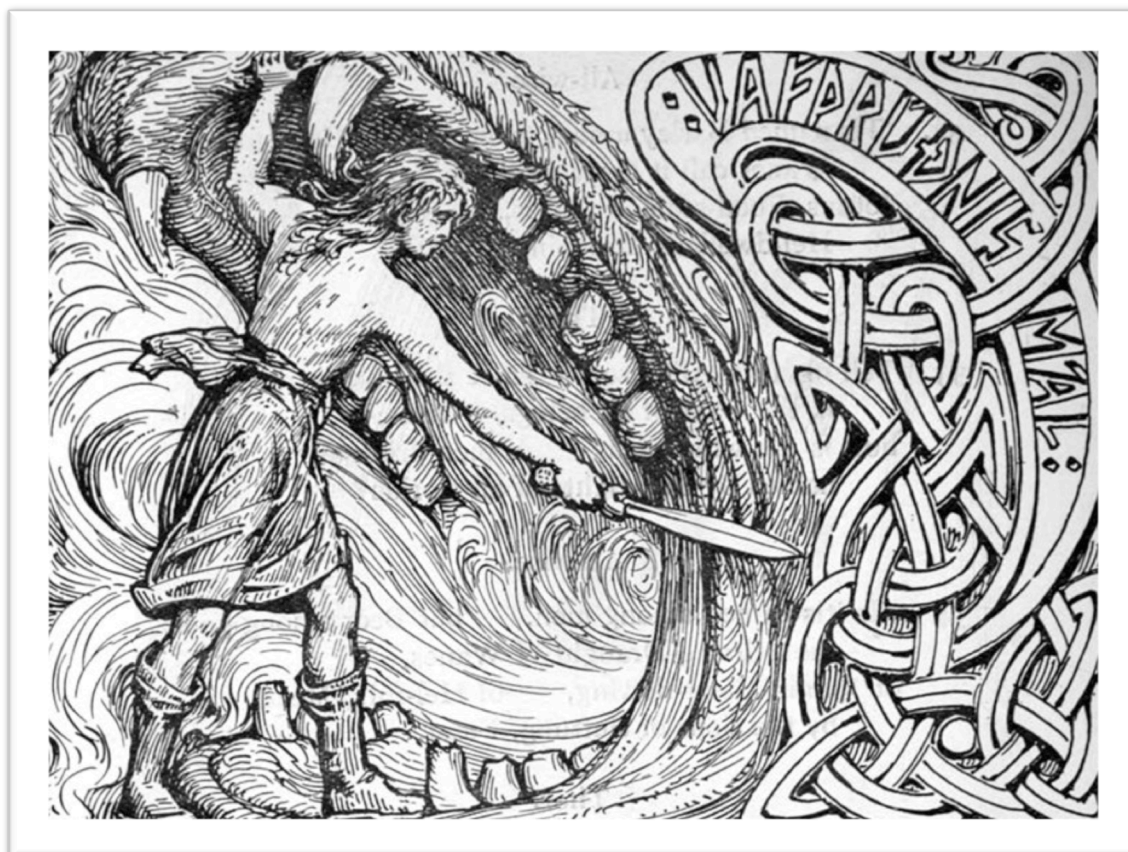
Vidar combattant Fenrir, W. G. Collingwood, 1908

Malgré tous les efforts des dieux d'Asgaard, le combat final, Ragnarök 85 , va tout de même se produire. Après quatre hivers particulièrement effroyables, sans été pour équilibrer les choses, le loup Skol réussit à atteindre et à dévorer Sol, entraînant la disparition de la chaleur et de la lumière, tandis qu'Hati dévore la Lune, faisant disparaître la clarté et la beauté. Les hommes souffrent et leur nombre se réduit rapidement. Les étoiles disparaissent à leur tour, comme dévorées par des fauves. Cela cause bientôt des tremblements de terre violents,