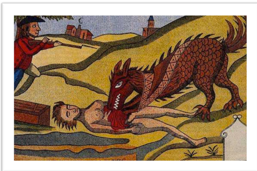
La bête du Gévaudan dévorant une femme, gravure du XVIII e siècle