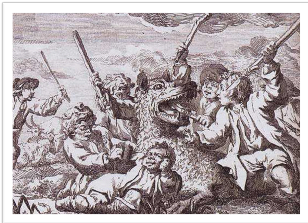
Gravure de 1764 « figure de la bête féroce »

Cette fois, c'est en haut lieu qu'on s'inquiète des ravages de cette bête qui défie les hommes. A son tour, le conseiller du Roi mandate l'un des plus grands chasseurs de loups du royaume, le sieur Denneval pour augmenter encore son tableau de chasse, comptant déjà plus de 1 200 loups officiellement abattus.