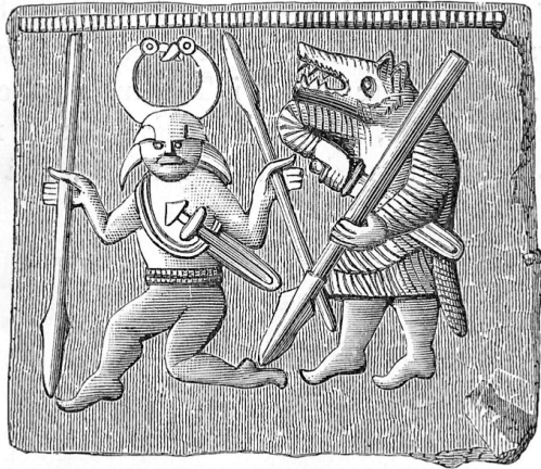
Figure 1 Matrice de Torslunda 1

Pour Sénèque, il y a une sorte de propension à être sauvage dans le nord, ce qui fait de ces hommes des gens très indépendants, mais de ce fait des peuples incapables de se gouverner. Les tempêtes du ciel seraient alors un reflet des échanges entre populations et tourments qui animent ces hommes à la limite de la sauvagerie, sorte de chaînon manquant entre l'homme et l'animal : ni tout à fait l'un, ni tout à fait l'autre.