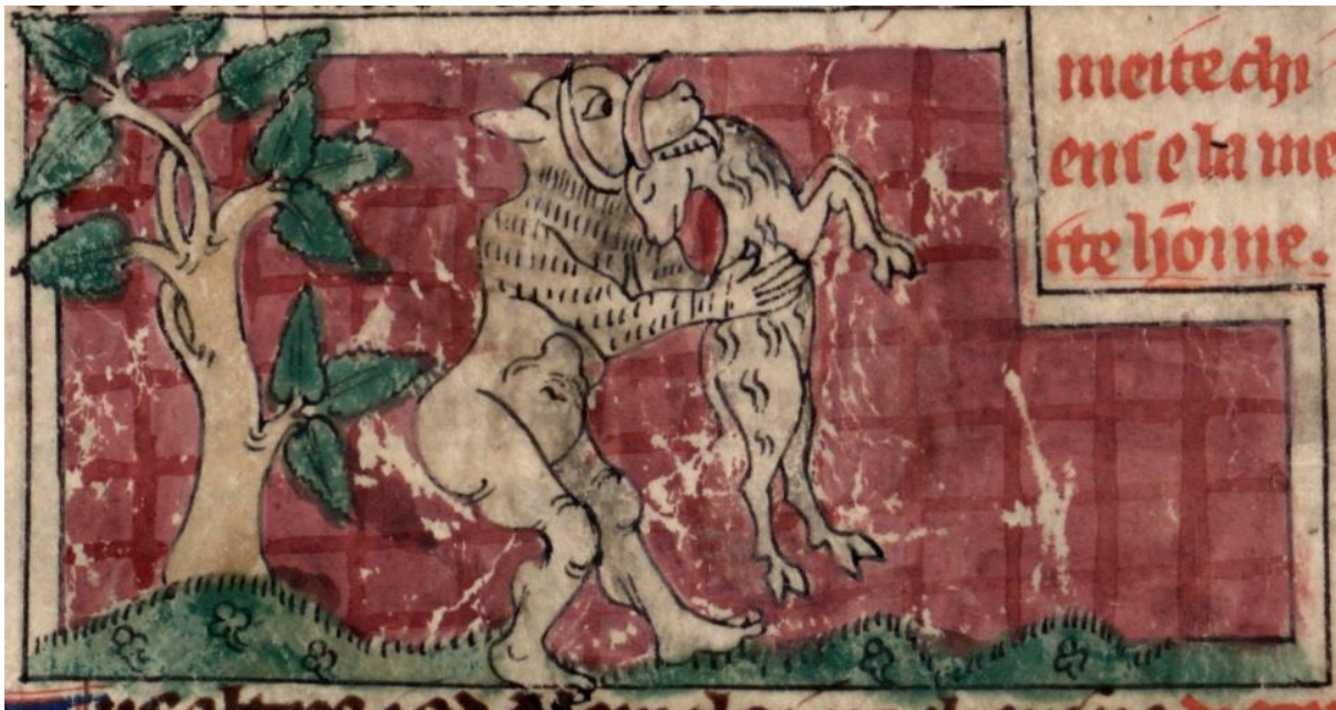
Figure 9 : BNF fr. 24364, folio 51, « de la gent moitié chiens e moitié hommes », c. 1308-1312