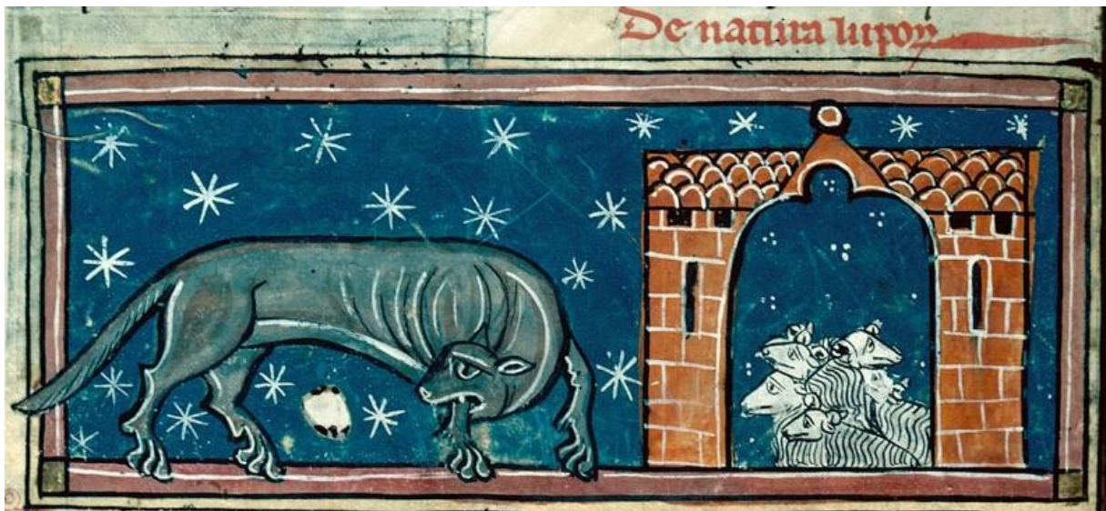
Figure 7 : BM Chalon-sur-Saône, ms. 14, f° 85v, c. 1280, France (nord), De nature luporum

Dans les citations qui précèdent, l'autophagie du loup est donc liée au bruit qu'il fait (« qui noise fache » ( Bestiaire d'Amour ) ; « fait noise au passer » (Anonyme de Cambrai) ; « qui noise face » ( Bestiaire , version longue). Cela nous de renouveler la correspondance son/dévoration, déjà relevée lors de l'étude de la dimension verbale de l'incarnation physique de la monstruosité lupine dans le texte 1377 .