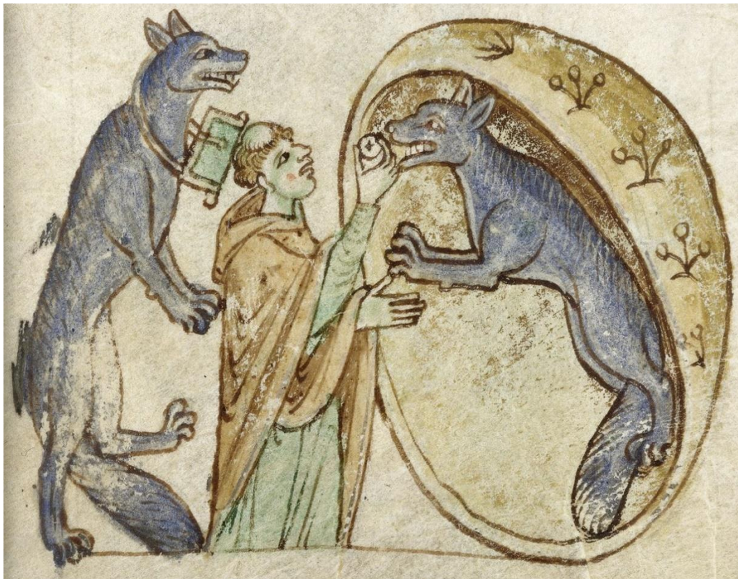
Figure 2 : Royal 13 B VIII f° 18r - XIII e siècle

Que le garou soit croyant, cela n'a rien d'étonnant. En effet, la christianisation des êtres surnaturels est un topos de la littérature permettant l'intégration d'un merveilleux païen au merveilleux chrétien. Certaines fées par exemple déclarent être chrétiennes pour assurer au héros, et à l'auditoire, qu'elles ne sont pas diableries. Cependant, la peur du prêtre devant cet animal – certes chrétien, mais loquace – se comprend, car même lorsqu'ils sont des humains métamorphosés, les loups, en général, ne parlent pas et s'expriment plutôt par gestes. Le motif de la parole animale n'est pas dénué de sens dans ce texte, puisque l'abbé ayant maudit ce peuple s'appelle justement Natalis, c'est-à-dire Noël 377 , comme nous l'apprend le loup :