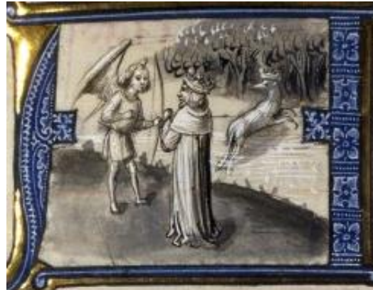
Figure 3 : BnF fr. 137, f° 6, avant 1480

Inversant le procédé allégorique, certains textes affirment du loup qu'il est sauvage à cause de Lycaon. Ainsi, le premier mythographe du Vatican, ou fabularius , écrit vers le milieu du XII e siècle rapporte au sujet du loup : « qui et adhuc mores in rabie et nomen Lycaonis in appellatione seruat 410 ». Faut-il comprendre que le loup n'est jamais un simple animal et que sa sauvagerie est toujours un reste d'humanité ? L'iconographie médiévale souligne en tous les cas cette ambiguïté. En effet, elle donne à l'homme devenu loup l'apparence d'un simple animal, comme il apparaît dans un manuscrit produit dans les pays-bas bourguignon au XV e siècle [Figure 3]. Sur cette image, Lycaon ne se différencie du loup ordinaire que par la couronne qu'il porte sur la tête. Son humanité ne se reconnaît qu'au rang social qu'il a, un temps, occupé.