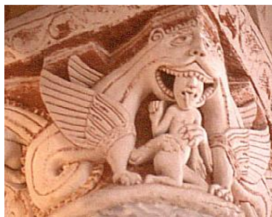
Figure 13 : Chapiteaux, Colégiale de Saint-Pierre de Chauvigny, XIIe siècle

Peu connue sous ce nom, la Bigorne de Villeneuve-Lambron semble pourtant, de par sa figuration iconographique, tout aussi répandue que le loup dévorant, car elle est du même type