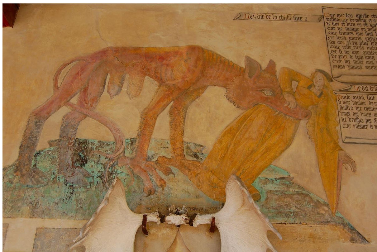
Figure 14 : Chicheface, Fresque, Villeneuve-Lambon, 2de moitié du XVe siècle

Dans les textes en ancien français, comme la Bigorne , la Chicheface se décrit elle-même dans plusieurs dits qui lui sont consacrés. Vers 1537, nous apprenons de la propre bouche/gueule du monstre : « Chicheface suis appelée, / Mesgre, seiche et desolee 1684 . »