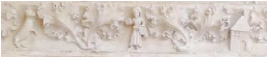
Figure 4 : Le Petit chaperon rouge, Palais Jacques-Coeur, Bourges, xve siècle

Du point de vue de l'articulation dévorant / dévoré, il faut noter que Robert le Diable est partiulier. En effet, ces trois textes ( Robert le Diable , Guillaume d'Angleterre , le conte estonien) ont pour point commun un couple mère ou nourrice / enfant, mais le nourrisson de Robert le Diable montre que le principe dévorant peut être incarné aussi bien par la femme nourricière ( Guillaume d'Angleterre ) que par l'enfant ( Robert le Diable ). Rappelons ici que dans certaines versions orales du conte du Petit Chaperon Rouge (AT 333), dont nous savons qu'il était connu au moins à la fin du xv e siècle par une pierre gravée figurant dans le palais Jacques-Cœur à Bourges [Figure 4], la fillette mange sa mère-grand en compagnie du loup.