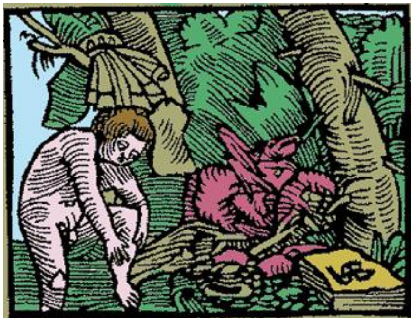
Figure 8 : Hie schmirt sich Seyfrid vnd wirdt aller hürnen, dann zwischen den schultern nicht 1638 .

La légende est connue. Seyfrid s'enduit du sang des vers qu'il vient de tuer, mais il ne peut atteindre un point de son corps derrière l'épaule ( Ibidem , strophe 11 : « Das er ward aller hürnen / Dann zwischen den schultern nit »).