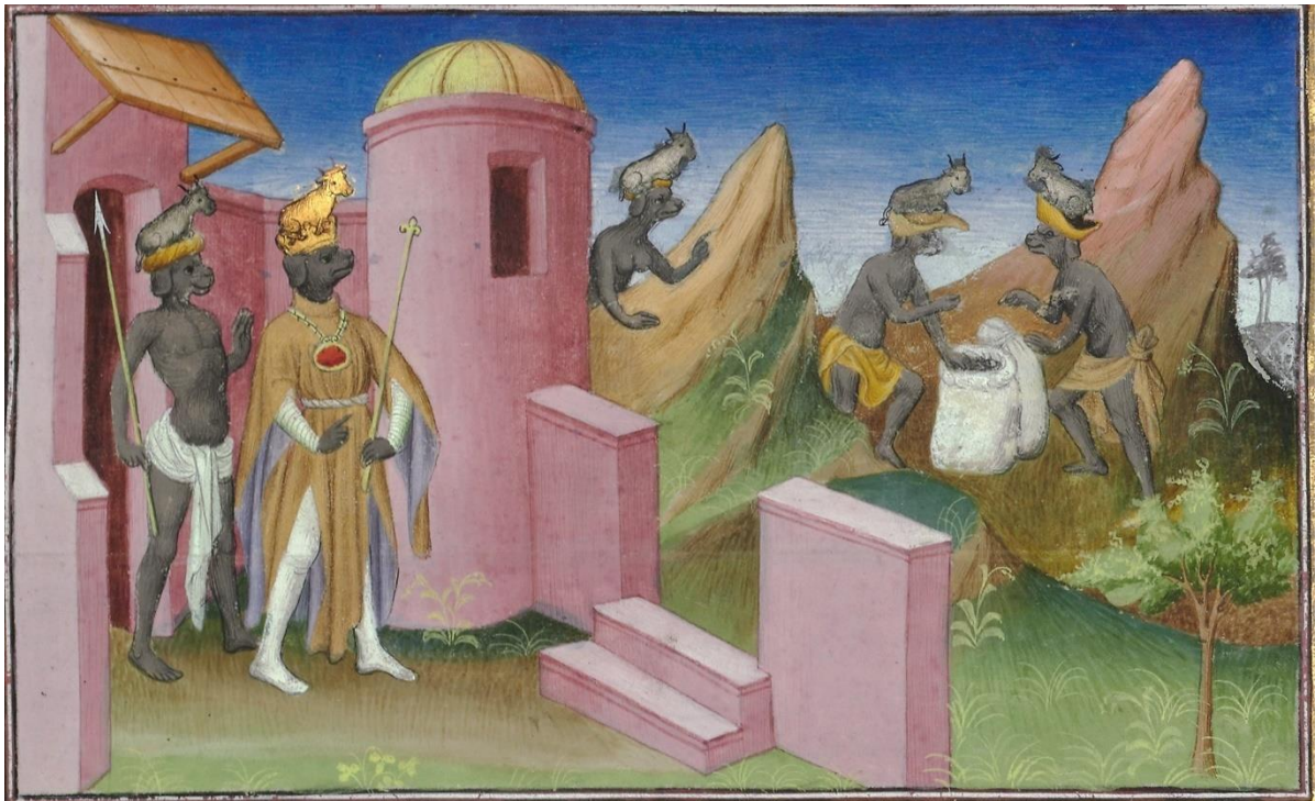
Figure 10 : BNF fr. 2810, fol. 106, Peuple des cynocéphales de Nicobar, c. 1410-1412

Des exemples que nous venons de citer, seul le moyen haut allemand permet d'affirmer que les cynocéphales ont pu être affublés d'une peau de corne ( horn ; die mit dem hürninen fel ). Mais cela signifie que la traduction de l'ancien français cor en moyen haut allemand horn est tout à fait plausible pour l'auteur s'exprimant en allemand. Pour ce qui est de l'ancien français, la matière « corne » pouvant s'écrire aussi cor il se peut qu'il y ait eu une confusion entre l'adjectif cornu et l'homme au corps nu se faisant par la même occasion relais d'une correspondance entre la nudité et la protection. Quant à l'aspect corné, résistant, de la peau, il a été remplacé par un bouclier de par une similarité de fonction : protéger.