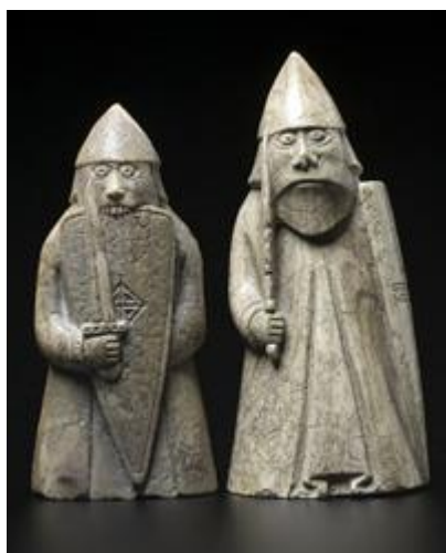
Figure 5 : Pièce d'échec, XII e siècle

clier, est parfois comparé à la morsure des chiens et des loups, par exemple dans la Saga des Ynglingar ( Ynglinga saga ) écrite vers 1225 par Snorri Sturluson (1179-1241) : « hans menn [...] váru galnir sem hundar eða vargar, bitu í skjöldu sína 1318 ». Ce détail fait partie de la description type du guerrier berserkr et il fut même représenté dans les arts picturaux. Ainsi, un jeu d'échec sculpté probablement en Norvège dans la seconde moitié du XII e siècle 1319 comporte des tours figurées par un berserkr mordant son bouclier [Figure 5].