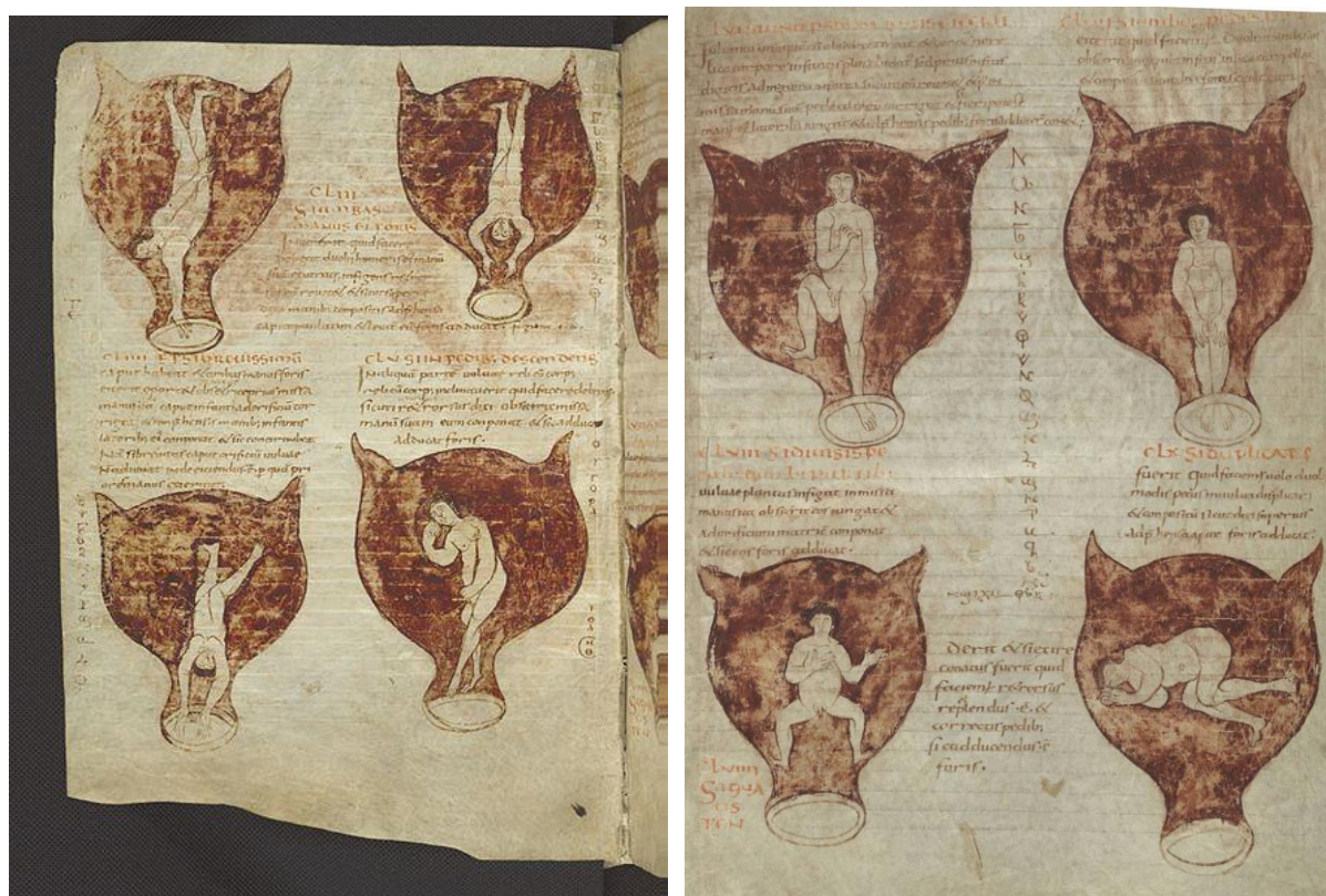
Figure 6 : Brussels, Bibliothèque royale inv. 3714

Le rapprochement, fondé sur une quasi homophonie de wulfa et vulva , est hasardeux, mais il est peut-être bon de rappeler également que le mot lupa a, lui aussi, désigné la prostituée avant de désigner la louve 1352 . La gestation et la naissance ont fixé un imaginaire dévorant, cela est connu, et les illustrations que l'on trouve dans un manuscrit datant du IX e siècle [Figure 6], contenant la traduction que Muscio a faite du traité de Soranos d'Ephèse, traduisent cette imaginaire en images. On y voit un fœtus entouré d'un placenta ou d'une matrice dont la représentation est inhabituelle et évoque une tête de loup vue de face, notamment à cause des trompes représentées comme des oreilles pointues. De sorte que l'enveloppe pourrait, avec un peu d'imagination, ressembler à une tête de loup ou de chien.