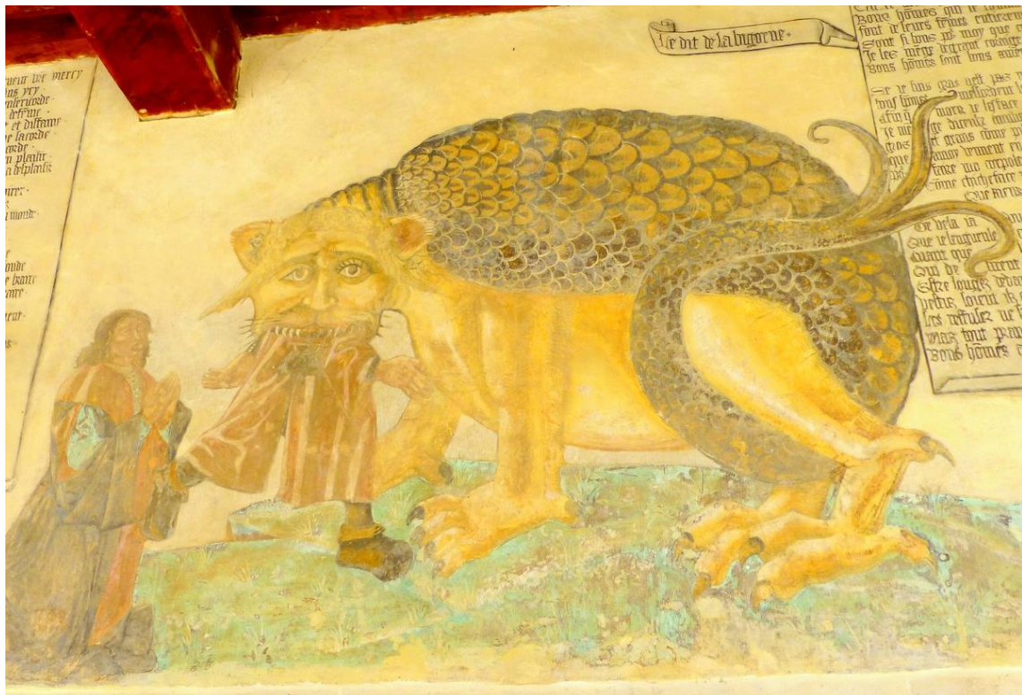
Figure 12 : Bigorne, Fresque, Villeneuve-Lambron, 2de moitié du XVe siècle

Replet, le monstre Bigorne de la fresque du château de Villeneuve-Lambron (ci-dessus), dont la ressemblance avec la Tarasque a été soulignée par Georges de Soultrait 1669 , est hybride. Ses pattes sont à mi-chemin entre le fauve et le rapace et elle dispose d'une queue fourchue. Le dos de la Bigorne est couvert d'écailles et sa face léonine aux oreilles rondes et aux sourcils proéminents fait face au spectateur. Le monstre tient un homme dans sa gueule tandis qu'un autre attend, priant à ses pieds dans une attitude qui tient, étrangement, plus de l'adoration que de l'effroi. La position du dévoré, dans la continuité de la tête du monstre, pourrait avec un peu d'imagination donner l'impression que la tête du dévorant est aussi celle du dévoré. L'un et l'autre forment donc une sorte d'hybride : la frontière entre l'homme et le monstre, est la gueule du monstre, dont les dents pointues, caractéristiques de la dévoration, sont bien visibles.