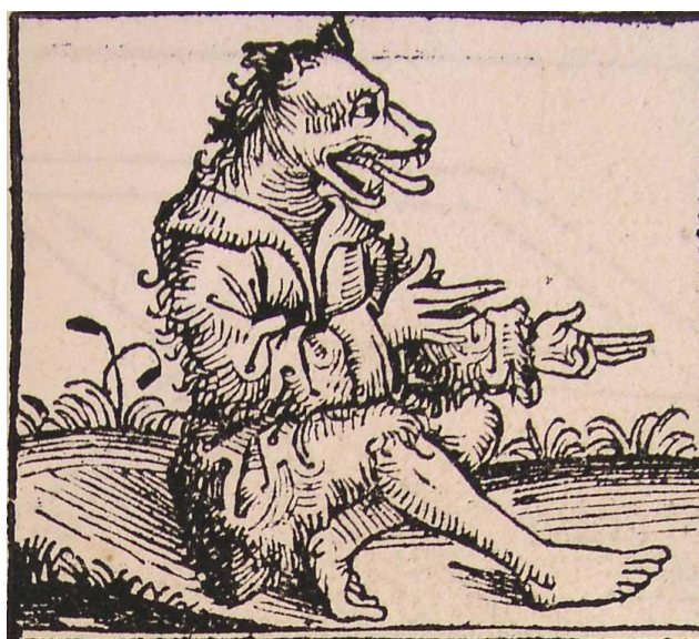
Figure 15 : Kynokephale, Schedel'sche Weltkronik, XVe siècle

À dire vrai, l'image de la Bigorne engloutissant sa proie peut, avec un peu d'imagination, faire penser à celles des guerriers ayant revêtu une peau de bête ou bien des hybrides humains à têtes monstrueuses, comme les Cynocéphales, telle celle que l'on peut voir dans la Chronique du Monde d'Auguste Schredel ( Schedel'sche Weltkronik ) : la double nature du loup-garou mériterait certainement d'être reformulée au sein d'une relation de paré-drie : du dévorant et du dévoré, lequel est le Double de l'autre ?