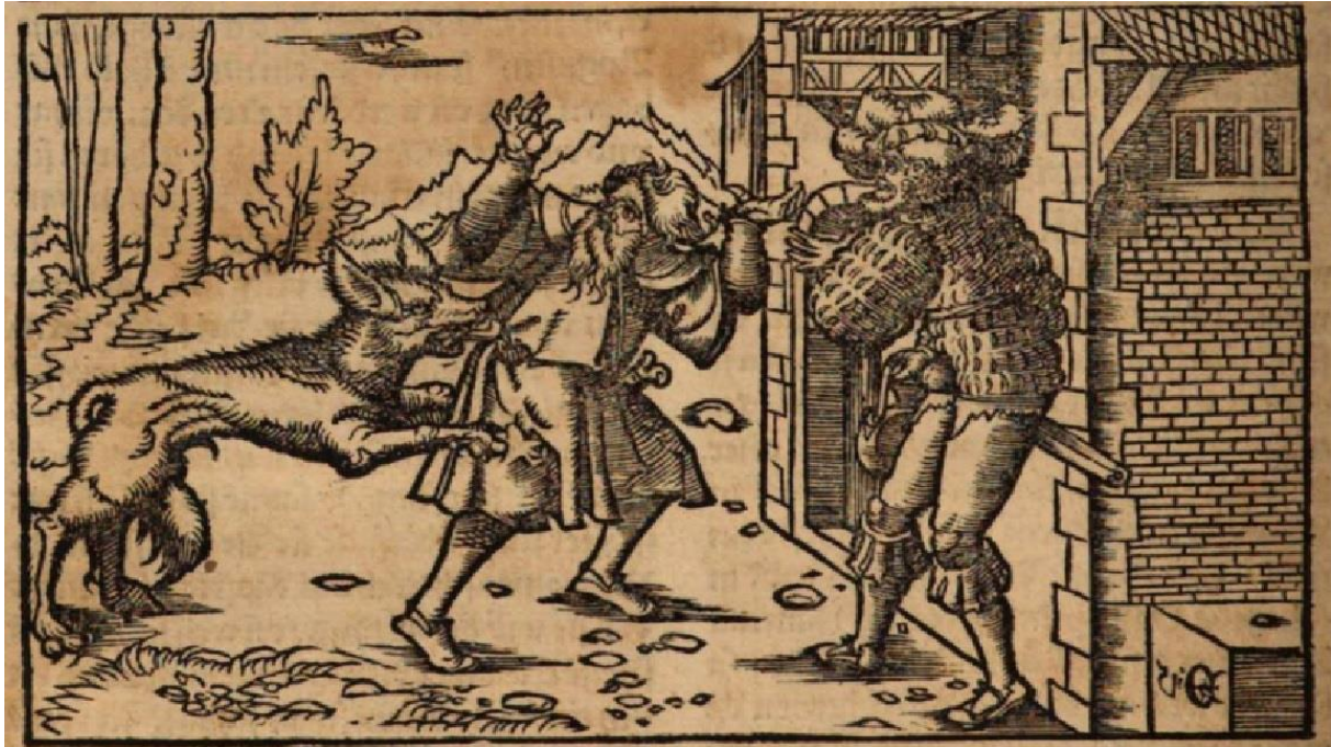
Figure 1 : Johannes Geyler von Kaysersberg, Die Emeis , début XVI e siècle

Ce garou-là n'a rien de surnaturel. De fait, le sens le plus courant du mot en moyen haut allemand en fait un simple loup anthropophage. Un dictionnaire latin-allemand de la seconde moitié du xv e siècle, le Variloquus , donne : « Antropophagi [:] ein berwolf 201 ».