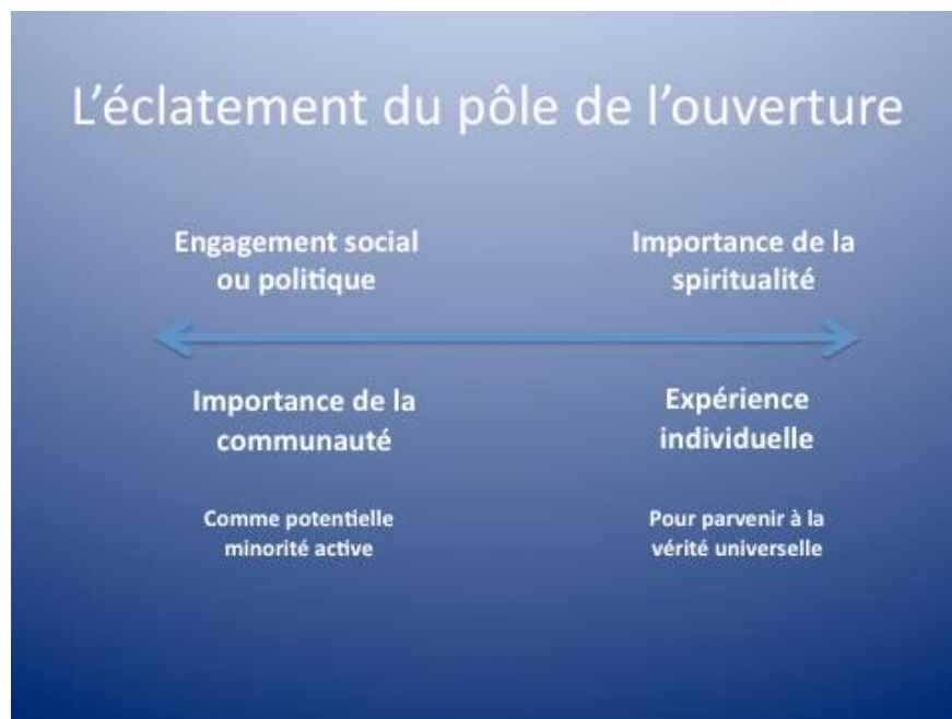
Figure 3 : L'éclatement du pôle de l'ouverture.

dogmatique qui incite chaque communauté à se perfectionner, un second groupe insiste davantage sur l'idée de perfectionnement individuel pour parvenir à une vérité universelle.