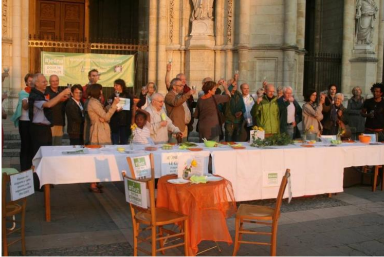
Image 3 : Jeûne Climatique devant la Cathédrale d'Orléans, le 1er octobre 2014. (Source : https://twitter.com/jeuneprleclimat , post du 29 octobre 2014).