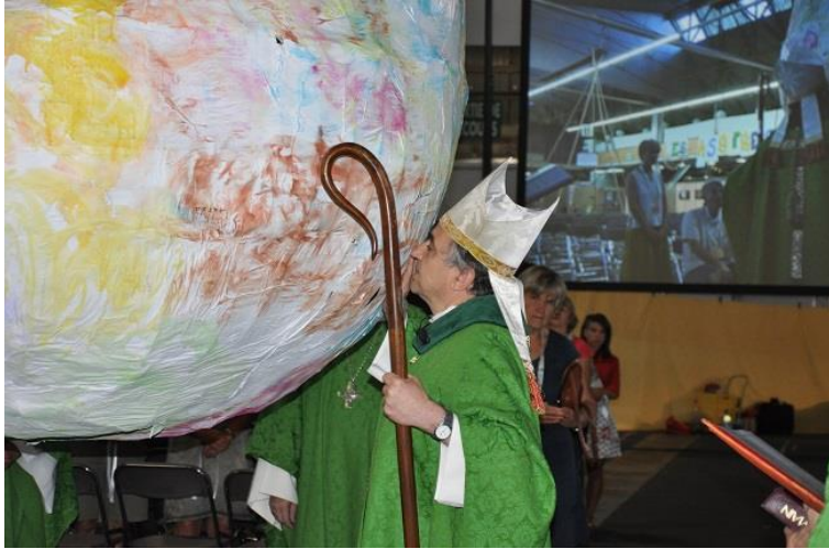
Image 5 : Mgr Lebrun, évêque de Saint-Étienne, bénissant une terre dégonflée, en prélude à la messe du dimanche 30 août 2015, lors des secondes Assises chrétiennes de l'écologie.