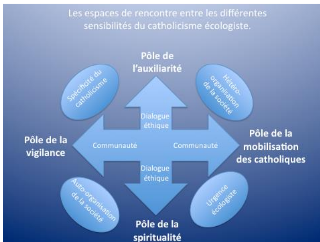
Figure 5 : Les espaces de rencontre entre les différentes sensibilités du catholicisme écologiste.

La typologie s'inscrit comme nous l'avons noté dans la méthodologie webberienne de l'idéal-type. L'identification à un pôle étant rarement exclusive pour un individu en particulier, la circulation d'un espace à l'autre est donc tout à fait envisageable. En complément de cette mobilité individuelle, il convient de noter que des espaces de rencontre sont susceptibles d'émerger. Les différents pôles peuvent ainsi stratégiquement se retrouver sur des sujets. Certaines combinaisons que nous allons évoquer ici seront illustrées par des exemples concrets, d'autres plus hypothétiques sont déduites du modèle théorique que nous proposons.