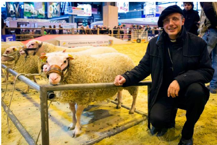
Monseigneur Jean-Marc Eychenne, au Salon de l'agriculture, lundi.