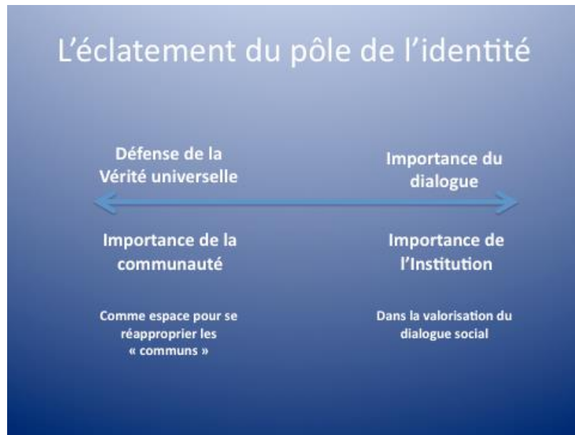
Figure 2 : L'éclatement du pôle de l'identité.

Pour le dire autrement, alors que les militants du « courant pour l'écologie humaine » ne voient pas dans l'institution un acteur stratégique pour défendre la vérité, d'autres militants vont défendre une approche plus institutionnelle, au nom de la recherche de consensus. De fait, le pôle de l'identité éclate, ou plutôt, on ne le retrouve pas à proprement parler chez les militants catholiques écologistes. Les militants qui auraient pu habituellement être identifiés à ce pôle ne s'entendent plus sur les deux éléments constitutifs du catholicisme d'identité.