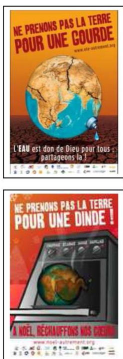
Image 1 : Campagne « Vivre Autrement » pilotée par Pax Christi France, Affiches de l'été et Noël 2009 (Source : site de Pax Christi France : http://www.paxchristi.ccf.fr/v2/campagne-vivre-autrement/ ).