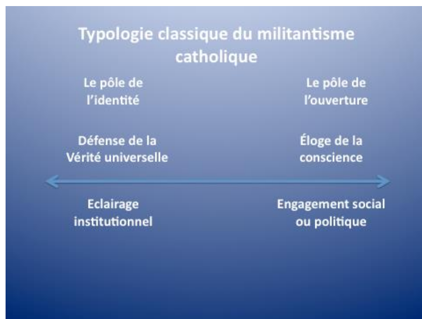
Figure 1 : Typologie classique du militantisme catholique.

Le catholicisme d'identité, traversé par un courant charismatique et un autre restitutionniste, attribue inversement à l'individualisme la responsabilité d'un déclin civilisationnel, si bien que le politique est invité à suivre les prescriptions de l'Église appelée à retrouver « son statut traditionnel de guide de la cité 1415 ». Ses militants adhèrent ainsi au « régime de la Vérité 1416 ». Engagés dans des partis politiques de droite, ou dans des associations « familiales, caritatives, humanitaires, souvent axées sur la « protection de la vie » 1417 », les militants catholiques d'identité sont décrits par Philippe Portier comme étant proches de l'institution catholique, par la convergence de deux dynamiques : tout d'abord, il est à noter que cette mouvance fournit désormais le gros des « bataillons » de laïcs, diacres et prêtres. Par ailleurs, ce catholicisme d'identité a été largement soutenu sous les pontificats de Jean-Paul II et Benoît XVI par une théologie, celle de la « nouvelle évangélisation » et une politique de nomination d'évêques « conservateurs » 1418 .