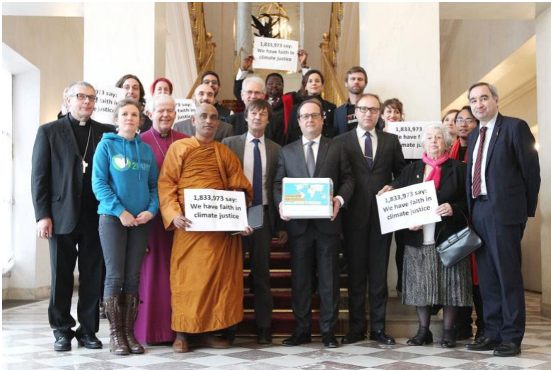
Image 4 : Remise officielle des pétitions spirituelles recueillies en préparation de la Cop21 au président de la République Française, le 10 décembre 2015 à l'Élysée.