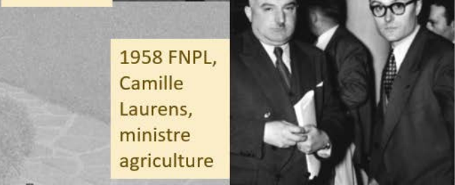
1958 FNPL, Camille Laurens, ministre agriculture