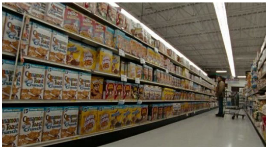
Fig. 1 : l'embarras du choix

ou quand il lui téléphone sans pouvoir dire un mot après avoir extrait une bombe du corps d'un jeune garçon. Il n'est pas étonnant que les pouvoirs exceptionnels du héros lui interdisent une vie sereine. Ce sentiment de n'être pas à sa place, le film l'illustre dans un supermarché, au rayon des céréales, dans un plan (cf. fig. 1) qui n'est pas sans évoquer Heaven and earth (cf. fig. 2), sur lequel nous nous pencherons en étudiant le cas des traumatisés de guerre. Mais déjà, le clivage entre un monde réglé par la paix et celui érigé par la guerre apparaît, et le héros appartient incontestablement à la guerre. The Hurt Locker délivre donc ici un discours relevant de l'ambivalence caractéristique du sujet : si la guerre est une drogue, elle est la drogue préférée des héros.