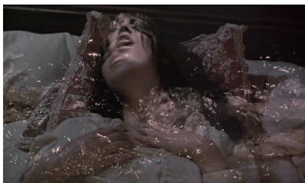
Fig. 19 : confusion des destins

transcendant les frontières vise précisément à combattre. Nous avons là, offerte à la contemplation, une représentation presque totale de l'objet des craintes du Régime diurne de l'image, à savoir l'eau ténébreuse qui figure aussi bien l'obscurité, la chute, l'animation accélérée que la gueule dévorante. Tels sont en effet les grands motifs par lesquels Durand analyse la valorisation négative des symboles nyctomorphes, ce qui lui fera dire que « le sens tout entier du Régime Diurne de l'imaginaire est pensée “contre□ les ténèbres, est pensée contre le sémantisme des ténèbres, de l'animalité et de la chute, c'est-à-dire contre Kronos, le temps mortel 1 . »