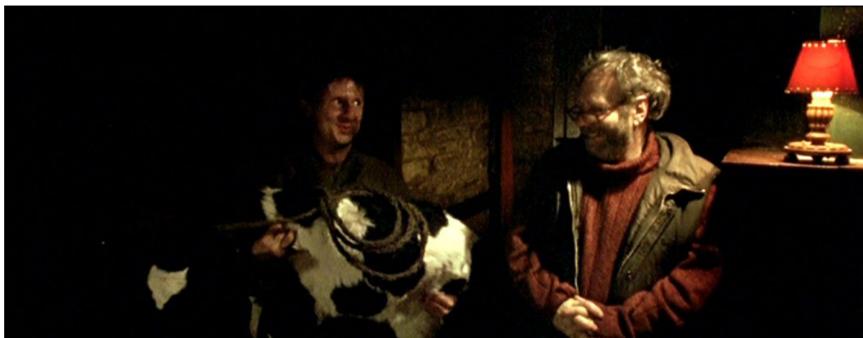
Fig. 12 : unis dans l'aveuglement

La mise à l'écart dont nous parlions plus tôt constitue une étape préalable commune à bien des récits de transformation ; ici, l'absence de tout garant de l'ordre public sert avant tout à permettre aux protagonistes de sombrer entièrement dans leur aveuglement, à le faire sans filet, à se perdre eux-mêmes en eux-mêmes. Car l'image qu'ils trouvent en autrui gagne à être éclairée de nos propos précédents sur le deuil : l'amant, l'amante et le fils que respectivement Lara, Bartel et Jeanne trouvent en un autrui plus ou moins consentant, ils le connaissent intimement. C'est son absence qui les ronge, nous l'avons dit, mais son absence au sens où ils constituent une partie d'eux-mêmes, soit l'amputation qu'est l'absence. Lara rit aux plaisanteries qu'elle imagine dans la bouche de son homme, Bartel rappelle constamment à « Gloria » qui elle est, ce qu'elle aime, ce qu'elle veut : il joue à la poupée, de même Jeanne voit son fils dans les plus grotesques avatars et reproduit avec eux le rôle dont l'absence du fils la prive : celui de mère. Plus qu'un amant, Lara et Bartel trouvent donc dans leur amant fictif l'opportunité d'un rôle – il en va de même pour Jeanne –, et c'est ce rôle dont ils tirent la plénitude à laquelle, enfin, ils parviennent (« T'entends le rire de Bartel ? L'enthousiasme retrouvé ? Eh bah ça c'est grâce à toi ! » dit Bartel à sa victime après leur « nuit de noces » – 51'10'').