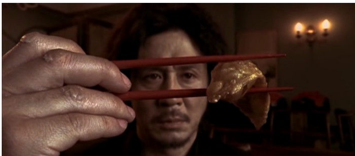
Fig. 18 : face à face entre Dae-su et son unique source de nutrition pendant quinze ans

nourri à chaque repas, et qui reviennent plus tard lors de la traque des responsables. Si l'on est ce que l'on mange, alors Oh Dae-su sortant de réclusion est, de fait, chrysalide. Geum-ja quant à elle connaît une évolution spirituelle fondamentale en prison, où elle acquiert les deux surnoms de « bienveillante » et « sorcière », de la même manière qu'Oh Dae-su pense à l'être créé par l'incarcération comme « monstre » (en référence à Frankenstein ). Et si Lee Geum-ja et Oh Dae-su ne sont que des vers au début, de majestueux papillons à la fin, notre utilisation de la psychanalyse permet d'associer pertinemment la chrysalide à cet état transitoire qu'ils connaissent dans la quête de vengeance.