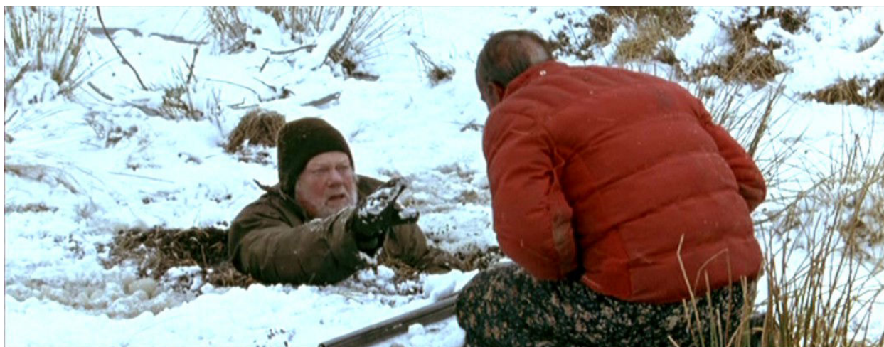
Fig. 21 : « Dis-le-moi que tu m'as aimé ! »

Ici la conversion au Régime nocturne n'est que donnée en aperçu comme possiblement apaisante. Le cri qui ponctue le générique de fin s'assure de sceller son ambiguïté. Mais elle est bien aperçue, et plus tard développée dans Vinyan : c'est une paix dans la confusion, dans l'embrassement de l'inconditionnel en tant que tel, parce qu'on voit à son endroit quelque chose de bénéfique – et l'objet halluciné, en fin de compte, importe peu.