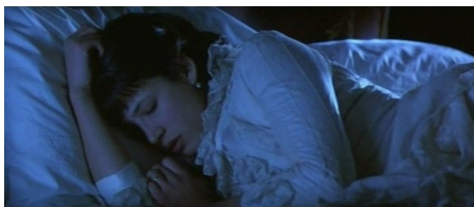
Fig. 3 : Anna Karenina

Figure récurrente dans le mélodrame, celle que nous appellerons la belle au linceul est à rapprocher mais non à confondre avec celle qui la conditionne, plus répandue et extérieure au genre, à savoir : la belle morte. Au contraire d'une Juliette figée dans l'immobilisme du trépas sous son voile funèbre, la belle au linceul doit être vivante pour souffrir, et c'est dans ce contexte là qu'elle le fait le plus spectaculairement (cf. fig. 3, 4 et 5). Composition horizontale, pâleur de l'image et de la peau, caractère éventuellement érotique du lit féminin, ici tout vise à centrer le désir du spectateur sur le bonheur et donc le rétablissement de l'héroïne.