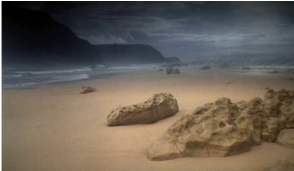
Fig. 7 : le caractère poétique de cet image contraste avec l'action

occurrence du plan onirique présentant la côte du septième continent (pays des morts), située à la fin du premier acte, semble, d'après le bref échange qui suit, illustrer un songe de Georg, suggérant ainsi que le projet naisse dans son esprit (cf. fig. 7). Les propos tenus par Anna dans sa dernière lettre, relatant son évocation sereine de la mort lors d'une réunion de famille, peuvent également laisser supposer qu'elle soit l'instigatrice du drame. Mais le rôle actif de Georg dans le troisième acte, tout particulièrement la manière dont ses mains et sa voix mènent l'exécution du ravage de la maison, témoignent de son enthousiasme à la tâche. L'un comme l'autre des deux parents peut donc avoir proposé le suicide en premier : lequel, cela importe peu ; importe en revanche le consensus très vite atteint. Qu'on imagine la scène manquante, perturbante entre toutes, d'un membre du couple confiant à l'autre son désir de mourir, et cet autre l'encourageant par son adhésion à l'idée. N'ayant nulle solution à proposer à la souffrance d'autrui, sinon un inefficace sentimentalisme, la famille S. se trouverait démunie de tous moyens de lutter contre la sienne propre.