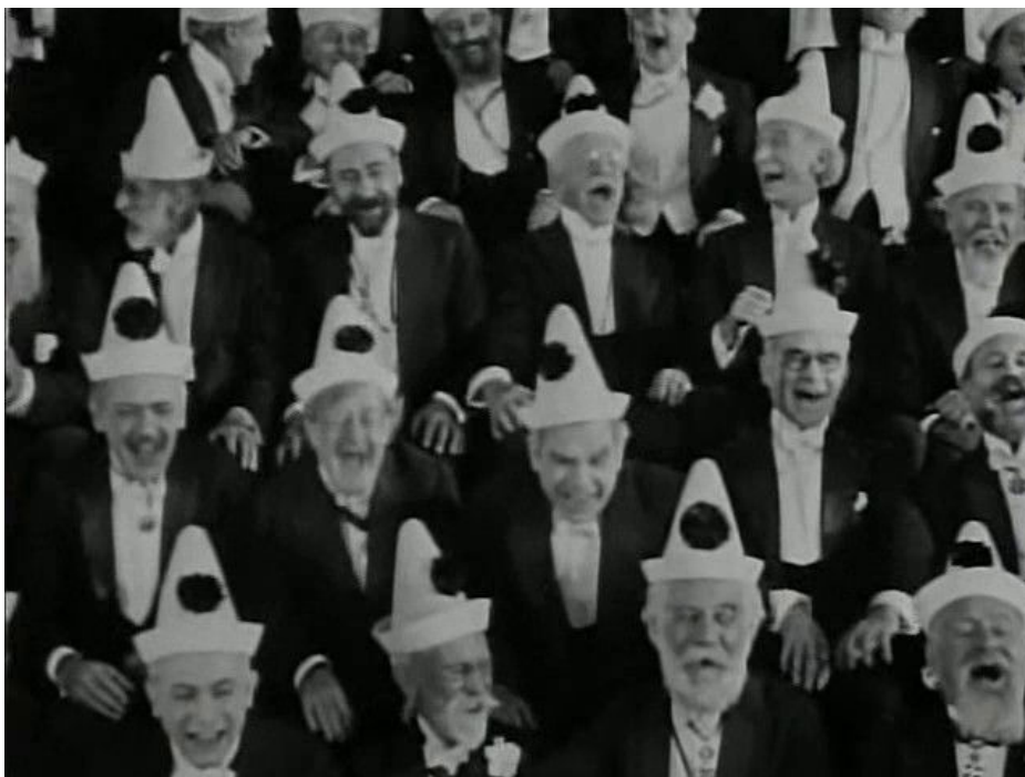
Fig. 14 : satire du monde universitaire ?

d'affirmation comme sujet que le meurtre. La perte d'intégrité psychique le mène ainsi à rejeter une convention morale essentielle au profit de principes moraux plus grands. Dans la mort tragique, il retrouve ainsi l'intégrité dont le traumatisme l'avait démuné.