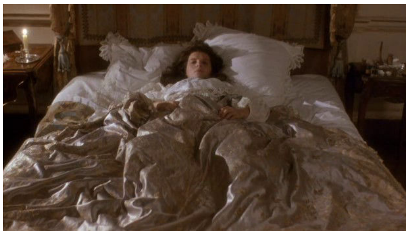
Fig. 5 : Catherine Earnshaw

Ce sont la chemise de nuit immaculée ou à la chemisette d'hôpital que le terme linceul désigne ici par analogie, mais le vêtement funèbre est bien sûr présent allusivement dans ce tableau d'une personne condamnée au dépérissement, et clouée au lit par un affaiblissement généralisé. Dans cette blancheur spectrale, la belle se donne à voir dans toute son éclatante passivité,