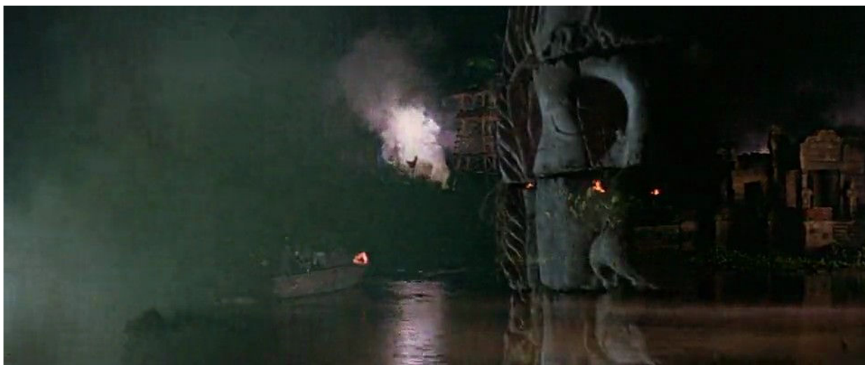
Fig. 16 : départ du bateau après l'assassinat du maître