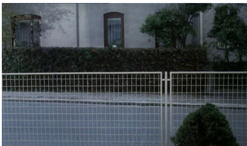
Fig. 6 : remarquons les lignes sensiblement obliques

avant qu'Anna ne déploie les grands moyens dans l'un des gros plans les plus resserrés du film, face caméra. Expriment une grande tendresse, elle assure Eva dont nous empruntons le regard qu'il ne lui arrivera rien. Le contact émotionnel semble réel, pourtant la courte durée des gros plans sur le visage de la mère maintient le doute sur ses intentions. De fait, dès qu'Eva lui avouera avoir menti, Anna laissera instantanément s'effondrer son masque de mère parfaite dans une expression de fulmination contenue, qui explosera en une gifle ; alors, le plan subjectif d'Eva est abandonné pour un plan semi-subjectif, suivi d'une coupure au noir (4'').