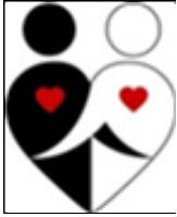
Figure 3 Le couple électif