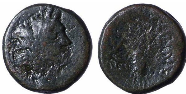
Figura 1: La serie monetaria del rey Euno-Antíoco con la efigie de Deméter de Enna. Colección del Museo Británico: 1868,0730.156