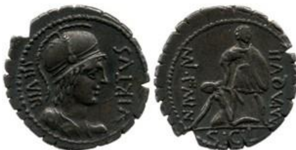
Figura 2: La serie monetaria conmemorativa de la victoria de Manio Aquilio en la segunda revuelta servil siciliana. Colección del Museo Británico: R.8578