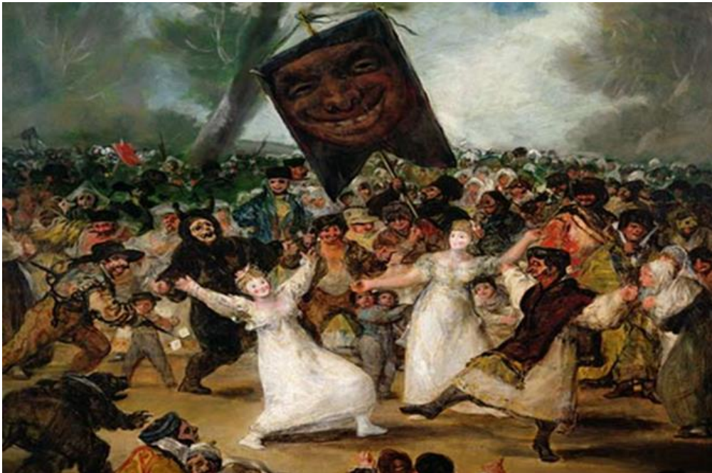
Figure 2 : « L'enterrement de la Sardine » de Goya