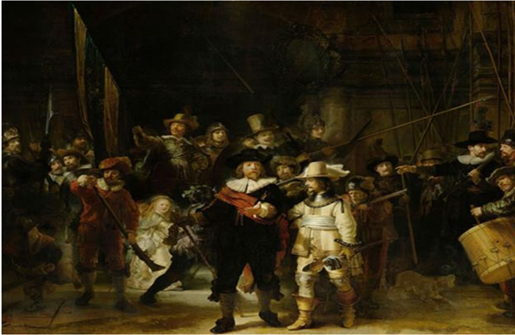
Figure 1 : « La ronde de nuit » de Rembrandt