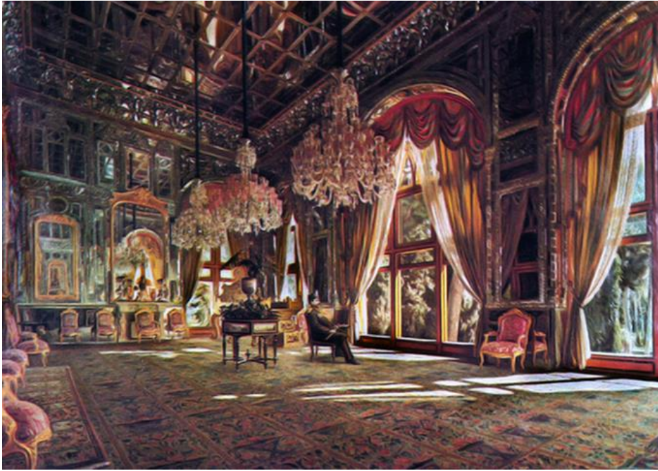
Figure 1: La salle des miroirs de Kamâl-ol Molk