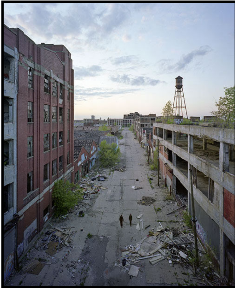
Figure 7: "Packar Motors Plan", Yves Marchand et Romain Meffre, extrait de la série The ruin of detroit . Source : marchandmeffre.com ; 2010-Yves Marchand et Romain Meffre

engendrées : immortalisées, capturées, les ruines n'expriment parfois rien d'autre que leur pure esthétique.