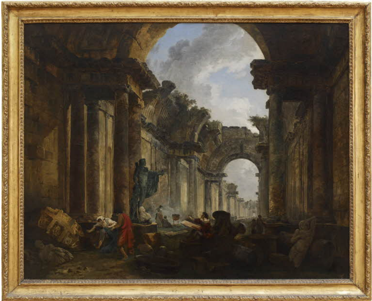
Figure 6 : "Vue imaginaire de la grande galerie du Louvre en ruines", Hubert Robert, 1796. Musée du Louvre, Paris, France.

Objet incertain, la ruine devient belle dès lors qu'elle est en mesure de brouiller les cadres de la distinction entre artificiel et naturel. Comme le souligne Georg Simmel, dans un court et fulgurant essai d'esthétique qu'il consacre au thème :