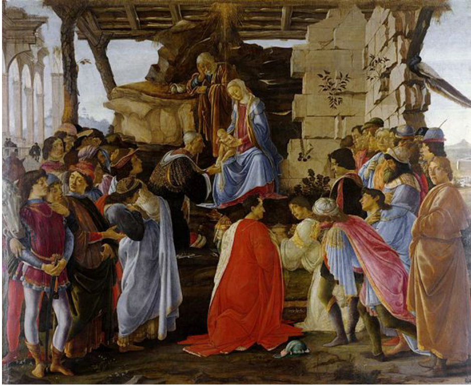
Figure 5 : "L'adoration des mages", Sandro Botticelli, aux alentours de 1475. Musée de la Galerie des Offices, Florence, Italie.

Dans L'adoration des mages , peinte aux alentours de 1475 par Botticelli, la ruine sert de décor intemporel, permettant d'associer dans un même tableau des personnages anachroniques : Médicis et Pic de la Mirandole y côtoient Marie et Jésus ; Joseph, a quant à lui les traits de Platon. Dans ce télescopage des temporalités, on remarque trois jeunes pousses végétales se glissant entre les blocs de pierre des deux seuls pans de murs du tableau. Les trois tiges feuillues se trouvent à la hauteur, comme en miroir, des trois personnages centraux de la scène. A l'arrière plan, des restes de colonnades ornées d'herbages coiffent littéralement les chapiteaux en reste. Cette présence du végétal atteste du caractère ancien, presque hors du temps du cadre dans lequel se déroule la scène. Trois siècles plus tard, chez Hubert Robert, le végétal est également un marqueur de ce travail conjoint du temps et de l'oubli. Dans sa célèbre Vue imaginaire de la Grande galerie du Louvre en ruines , l'ouverture créée par l'effondrement du toit laisse apparaître les nombreux petits buissons qui, jonchés sur les parties supérieures des arches, dominant littéralement la composition. La coprésence des restes d'un bâti déchu et de ce monde végétal en cours d'expansion mime parfaitement le travail du temps comme celui de l'effacement d'une certaine mémoire souvent perceptible dans l'espace en ruines.