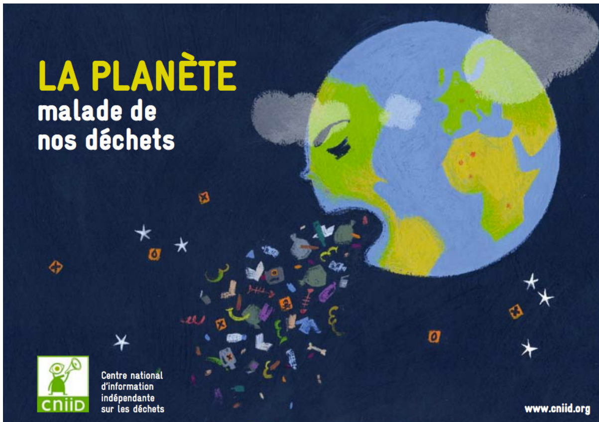
Figure 4 : "La planète malade de nos déchets" - 2011 Illustration issue d'une publication du CNIID (Centre National Indépendant d'Information sur les Déchets)

Si le déchet et la mort trouvent, dans leur prise en compte pendant la période contemporaine, un écho partagé dans cette figure du déni, c'est que l'un comme l'autre y sont assimilés à des processus pathologiques. Il apparaît que, à travers les promesses d'immortalité qui sont ici en jeu, ce sont ces deux figures de la négativité qui sont, elles-mêmes, niées. La mort devient « mortelle » et le déchet devient « jetable » : il semble possible, dans les deux cas, de s'en « débarrasser », comme il est possible de guérir d'une affection. Pour en rester à la question détritique, la négation du déchet s'institue donc dans la condamnation de son existence même. Ce déni consistant à faire du déchet un interdit empêche tant de le penser que de se confronter à sa matérialité ou à son statut d'objet. Dans ce contexte où l'utilisateur est rendu coupable d'une faute, un débat sur la portée sociale et symbolique du déchet reste impossible, tant sa caractérisation technique impose la nécessité de son « traitement ».