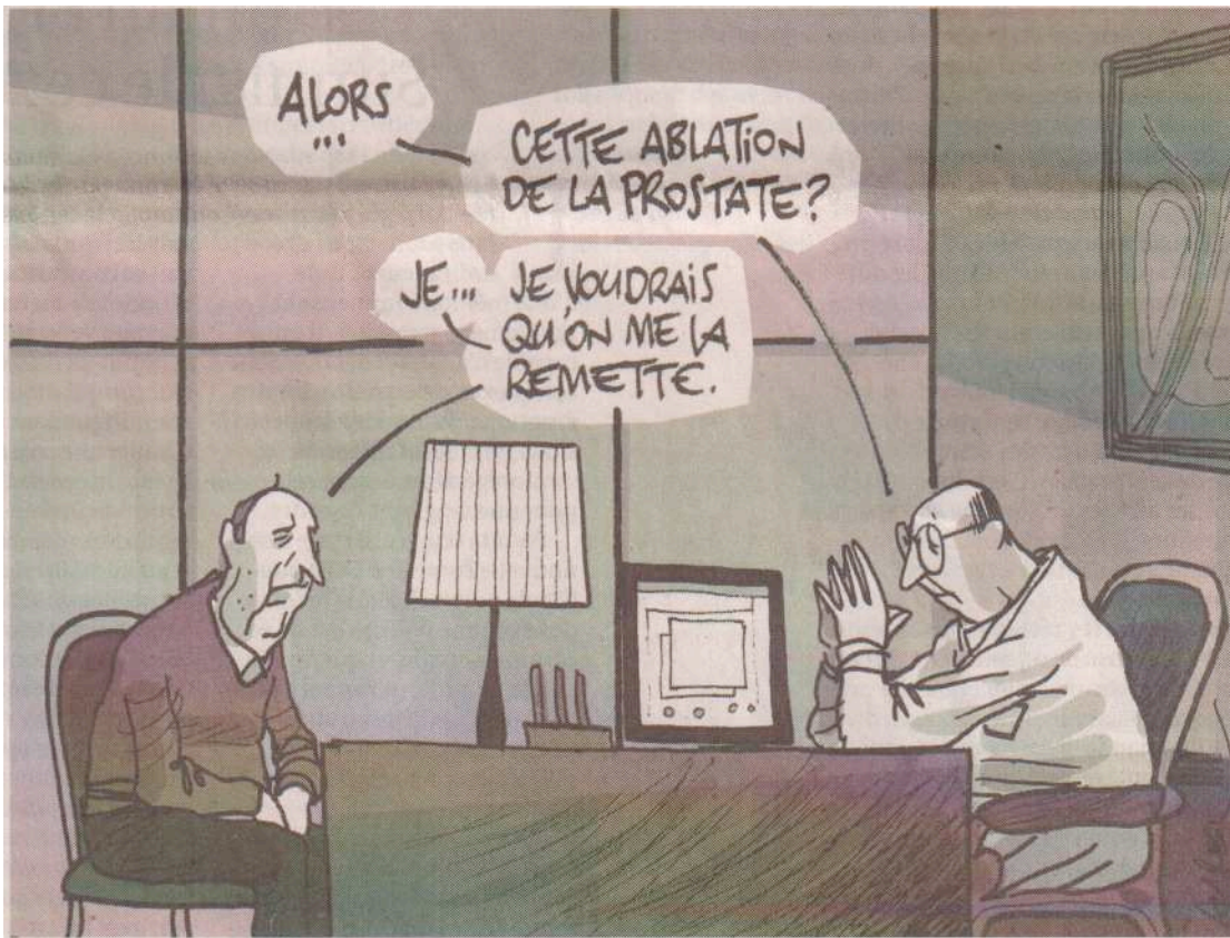
Dessin extrait du journal Le Monde , daté du 21 janvier 2012, Supplément Science & Techno, p 3, article de Sandrine Cabut, Cancer de prostate : regards croisés .