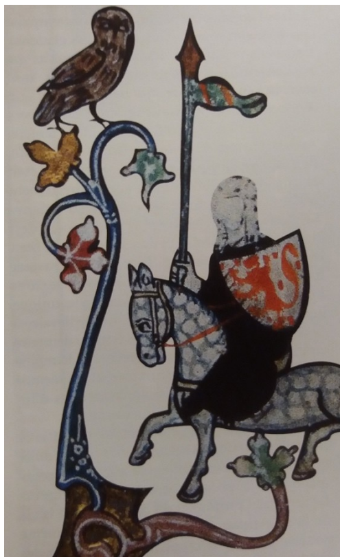
Armoirie de la famille Conflans, Vie de sainte Benoîte d'Origny , Berlin, Kupferstichkabinett, ms. 78 B 16, f. 66.