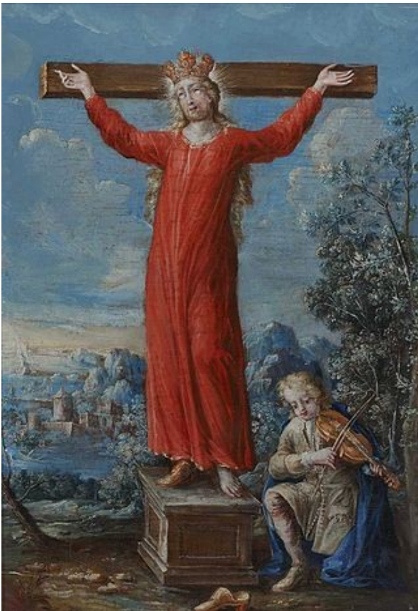
Anonyme bavarois, Sankt Kümmeris (XVIII e s.)