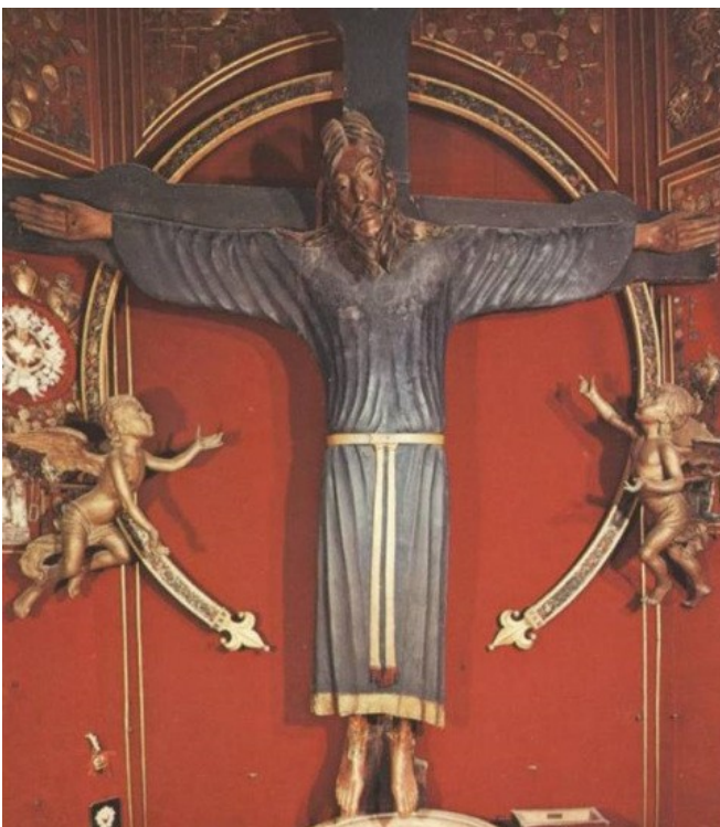
« Volto Santo », crucifix en bois, cathédrale de saint Martin, Lucques (Italie)