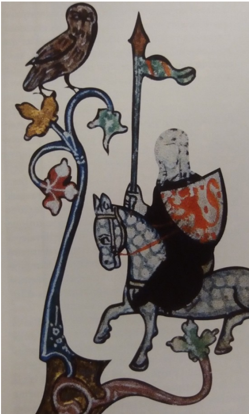
Armoirie de la famille Conflans, Vie de sainte Benoîte d'Origny , Berlin, Kupferstichkabinett, ms. 78 B 16, f. 66.