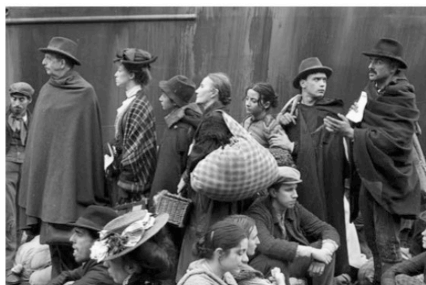
Golden Door (2006) E. Crialesse

Le cinéma du passé est une source à laquelle Garrone puise, qu'il s'agisse du cinéma de genre ou de la comédie, sans imiter les déformations bienpensantes que d'autres auteurs contemporains proposent. Dès son premier long-métrage, il est possible de dénicher des références au cinéma du passé : le troisième épisode de Terra di Mezzo nous propose une scène qui rappelle Le Grand Embouteillage de Comencini. Le pompiste Amhed se retrouve face à une longue file de voitures conduites par une série de personnages grossiers qui semblent tout droit sortis d'une comédie à l'italienne. L'auteur admet avoir été influencé par des films comme Paisà de Rossellini lors de l'élaboration de Gomorra , un film qui en effet fait ressurgir le potentiel des pratiques néoréalistes, qui privilégie une écriture scénaristique