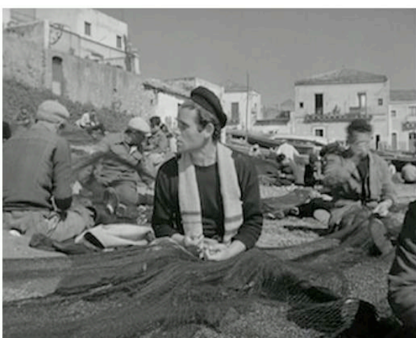
La terre tremble (1948) de Luchino Visconti