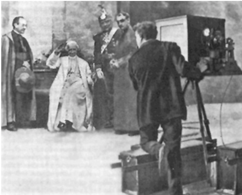
Sua santità Papa Leone XIII (1896) de Vittorio Calcina, images du tournage

Ce cinéaste pionnier n'est pas le seul à marquer les prémices du cinéma italien. D'autres opérateurs se lancent à la conquête d'images à capturer autour du monde. Pensons à un photographe tel que Giovanni Vitrotti, qui à partir de 1905 décide de filmer des images tirées du réel lors de ses voyages. Il tourne trois films en Russie entre 1909 et 1911, puis il est choisi comme chef opérateur des troupes italiennes lors de la Première Guerre Mondiale 66 .