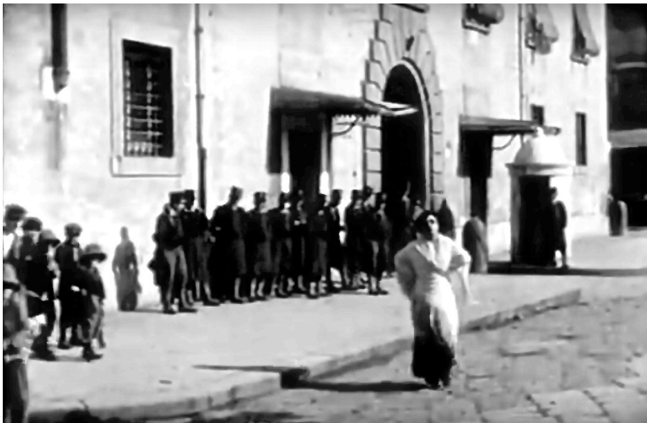
Assunta Spina (1915) de Gustavo Serena. Scène au pénitencier.

Les qualités artistiques de cette œuvre, et l'importance de sa charge réaliste, demeurent longtemps inégalées : même si le filon cinématographique vériste se bat contre les forces écrasantes de l'État et de l'industrie cinématographique nationale, il faudra attendre encore quelques décennies pour que ses qualités soient plus amplement appréciées et reconnues.