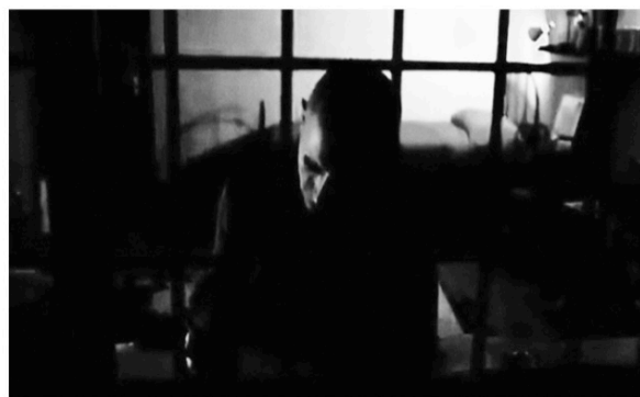
Primo amore (2004) M. Garrone