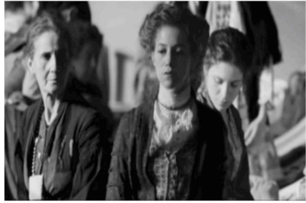
Golden Door (2006) E. Crialese (détail)

À travers cette composition, l'auteur nous rappelle le goût pour la représentation de Jean-Luc Godard qui, s'inspirant à son tour de Pasolini, nous offre une série de tableaux vivants dans le film Passion (1982).