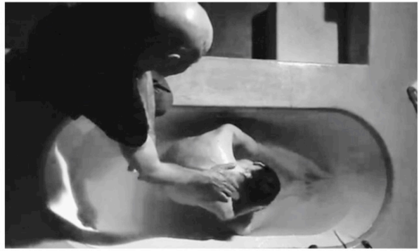
Primo amore (2004) M. Garrone

Le vampire de Murnau inspire également Sorrentino pour la création de Giulio Andreotti. Les scènes de Il divo tournées en intérieur mettent en exergue les aspects lugubres de ce personnage qui se déplace bien souvent dans le noir, déambulant de façon atypique 480 . L'auteur puise dans le cinéma muet une esthétique qu'il repropose de façon contemporaine : dans Les Conséquences de l'amour , les paysages suisses qu'il filme nous rappellent parfois les scènes expressionnistes proposées par la cinématographie de Fritz Lang. 481 L'on passe des sous-sols d'un garage aux sommets d'un building ultramoderne grâce au personnage principal du film devenu le pont entre les bas fonds de nos sociétés et les hautes sphères de la finance. Cette ascension nous rappelle visuellement celle du film Metropolis (1927), qui divise verticalement une société faite de dominés, vivant et travaillant dans les sous-sols, et de dominants, au quotidien aseptisé et dans un certain sens idyllique.