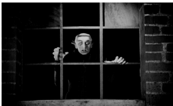
Nosferatu le vampire (1922) F.W.Murnau

Garrone est un grand cinéphile qui exploite fréquemment ses sources sans les étaler devant ses publics de façon trop voyante. Outre les formes de cinéma d'après-guerre, moderne et contemporain, le cinéaste prouve qu'il connaît le cinéma produit avant l'avènement du parlant. Il donne beaucoup d'importance au cinéma muet, parce qu'il est capable de créer des émotions principalement par l'image. Les dialogues deviennent ainsi secondaires, quoique importants, et l'expression visuelle prend du poids face à l'information 477 . Certaines images surréalistes de Estate romana , comme la scène de livraison d'un globe terrestre en papier mâché effectuée par un artiste paresseux, nous rappellent des séquences de la filmographie de Joseph Franck Keaton, plus connu sous le nom de Buster Keaton 478 . Dans Primo amore , en revanche, Garrone ne s'inspire pas de la comédie mais du cinéma d'horreur, utilisant un personnage qui, dans certaines scènes du film, nous rappelle le personnage principal de Nosferatu le vampire [Nosferatu, eine Symphonie des Grauens] (1922) de Friedrich Wilhelm Murnau. Vittorio, le personnage créé par Garrone pour ce film, possède les mêmes traits cadavériques que Dracula : étrange personnage conduit par ses démons intérieurs, il vampirise sa victime qui, dans un élan de rage, le frappe mortellement à la fin du film. La dernière image de l'homme est celle d'un corps qui se vide de son sang 479 .