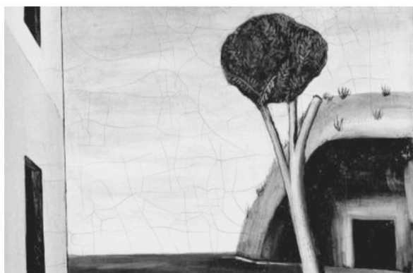
Pino sul mare (1921) C. Carrà