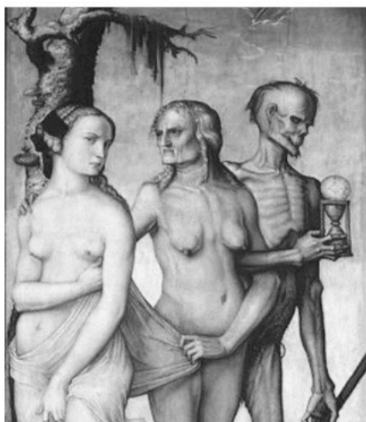
Les Trois Âges et la mort (1510) H.Baldung (détail)

Citons rapidement, en outre, les influences artistiques qui les inspirent et qui dépassent facilement des limites culturelles souvent très perméables. Crialese, par exemple, utilise une série de techniques cinématographiques issues de ses formations italienne et américaine : sa filmographie peut être considérée comme un "pont cinématographique" symbolique entre Europe et États-Unis 469 . Lors de leur séjour forcé sur Ellis Island, trois des personnages féminins de Golden Door sont filmés lentement de face à deux reprises: ayant trois âges différents, ces images nous rappellent le tableau Les Trois Âges et la mort (1510) de Hans Baldung, mais également une version féminine de Les Trois Âges de l'Homme (1500-1) de Giorgione.