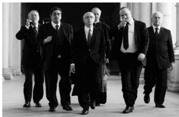
Il Divo (2008) P. Sorrentino

Comme pour beaucoup de ses contemporains, Scorsese demeure un exemple à suivre quand il s'agit de bâtir la structure d'un film. Sorrentino soigne dans le moindre détail ses mouvements de caméra, et la précision obsessionnelle de ses cadrages donne naissance à des scènes virtuoses qui déroutent et captivent ses spectateurs 488 . Les atouts esthétiques forts de ce film, qu'on retrouve dans toute la filmographie de l'auteur, s'inspirent également des œuvres de Stanley Kubrick. Les personnages d'un film comme L'ami de la famille ou ceux qu'on croise dans le palais du pouvoir fréquenté par Servillo/Andreotti, nous rappellent ceux des