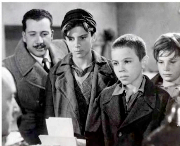
Sciuscià (1946) de Vittorio De Sica