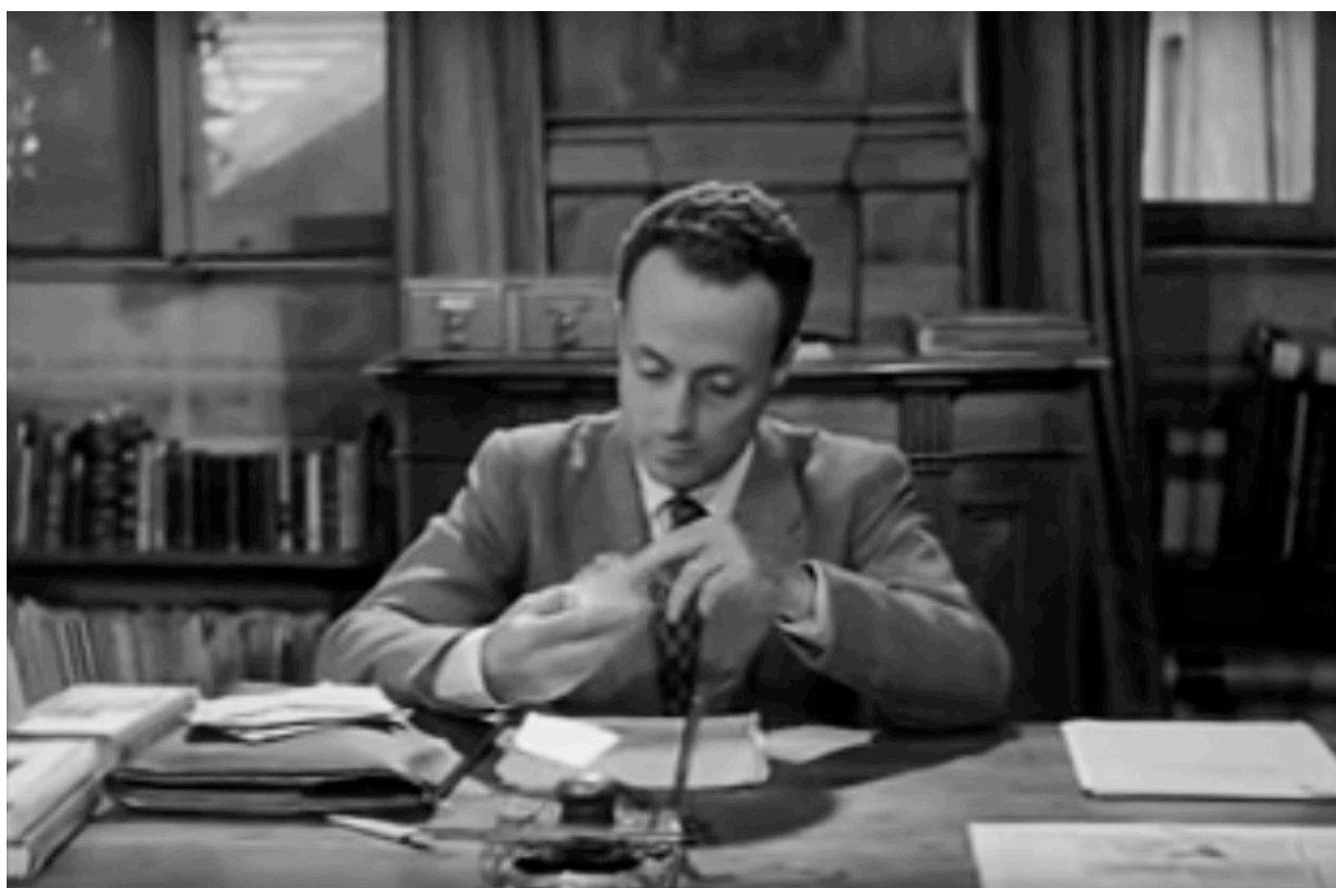
Giorgio Bassani dans Les Fiancés de Rome [Le ragazze di piazza di Spagna] (1952) de L. Emmer

Giorgio Bassani exprime son intérêt pour le cinéma à travers ses articles critiques, il s'investit comme scénariste en réadaptant des œuvres littéraires pour le cinéma, et écrit des scénarios originaux qui se ressentent de son style littéraire. Cet auteur, comme tant d'autres, ne se fige pas sur une vision monolithique du cinéma, et il ne se consacre pas à la rédaction de films d'auteurs, mais il choisit de se concentrer sur les formes populaires du cinéma des années 1950. Il est convaincu qu'à travers des films attirant le grand public il est possible de dispenser, en le vulgarisant, un savoir culturel aux racines solides. C'est ainsi que l'auteur de Ferrare collabore à l'adaptation des romans de Moravia pour le film La marchande d'amour [La provinciale] (1953). En participant au scénario du film Les Vaincus [I vinti] (1953) de Michelangelo Antonioni, Bassani continue à poursuivre son engagement social. Cette œuvre, en effet, s'inspire de faits réels et fournit une analyse sociologique de la jeunesse bourgeoise européenne de cette période.