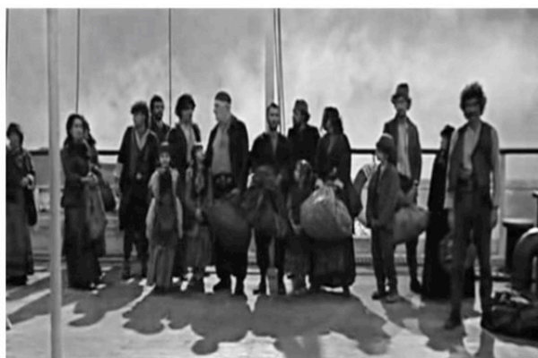
Et vogue le navire... (1984) F. Fellini

Dans Once We Were Strangers , il est possible de repérer d'autres sources d'inspirations : pensons à Permette? Rocco Papaleo (1971) de Scola qui nous décrit le quotidien d'un immigré italien occupé par la conquête d'une femme américaine pour qui il est prêt à tout. Dans ce film, comme dans celui de Crialesse, la métropole newyorkaise est perçue comme un espace étrange, hostile et incompréhensible. Golden Door n'est pas exempt de références cinéphiliques apportées par son auteur : dans une scène où la famille Mancuso pose pour un portrait photographique de famille, l'auteur fait écho à la photographie familiale du film de Scola La Famille [La Famiglia]. Le navire de son film nous rappelle celui de Et vogue le navire... [E la nave va] (1984) de Fellini, même si l'auteur nous montre uniquement les vicissitudes des passagers de troisième classe. Ces passagers subissent le même sort que ceux visibles dans Emigrantes (1949) de Aldo Fabrizi. Ce film d'après-guerre retrace le voyage migratoire d'une famille italienne qui décide de s'installer en Argentine. Bloqués initialement par une série de contrôles bureaucratiques, ils sont séparés en groupes de femmes et d'hommes, puis il risquent de perdre l'un des leurs qui a été condamné au rapatriement.