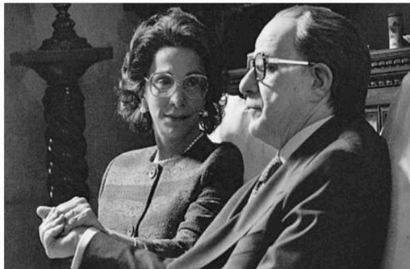
Il Divo (2008) P. Sorrentino

Les images de Les Conséquences de l'amour sont construites à travers des schémas géométriques parfaits, les lieux extérieurs filmés sont lumineux, les surfaces des bâtiments sont lisses et reflètent le monde qui les entoure, un monde presque surnaturel. Ces paysages semblent directement issus des œuvres d'art de Leonardo Cremonini, artiste bolognaise qui exploite une palette de couleurs vives et des formes stylisées. Les scènes tournées à l'intérieur de l'hôtel où réside Titta, en revanche, semblent avoir été inspirées par le courant néo-figuratif, marqué par un style expressionniste 512 . L'un des courants artistiques qui inspire majoritairement Sorrentino est la Pop art , dont on retrouve des traces parsemées partout dans sa filmographie 513 . Qu'il s'agisse de la décoration de l'appartement de Tony Pisapia dans L'homme en plus , des barils de lessive en poudre utilisés par Geremia de' Geremei pour stocker son argent dans L'ami de la famille ou des boîtes de pizzas produites en série, visibles dans un supermarché américain fréquenté par Cheyenne dans This Must Be the Place , ce courant artistique semble être omniprésent au sein de l'univers filmique de l'auteur.