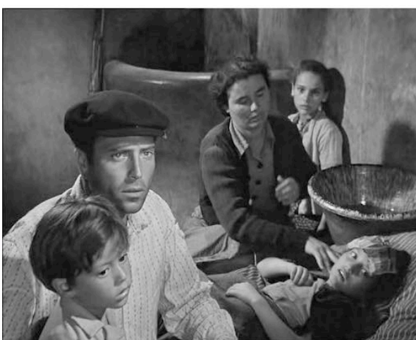
Le Chemin de l'espérance (1950) de Pietro Germi

Ces nouvelles coordonnées sont rapidement perçues par une partie de la critique, qui à l'étranger se montre bien souvent plus réceptive parce que moins influencée par les courants de pensée qui constituent les bases culturelles des critiques italiens.