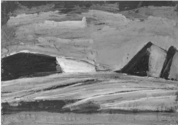
Paesaggio (1949) M. Sironi

Pour souligner la désolation de certains territoires, Garrone construit des images métaphysiques qui s'inspirent directement des œuvres de Giorgio De Chirico, Mario Sironi et Carlo Carrà. Les exemples sont nombreux, que l'on retrouve dans des films tels que L'étrange monsieur Peppino , Primo amore et Reality .