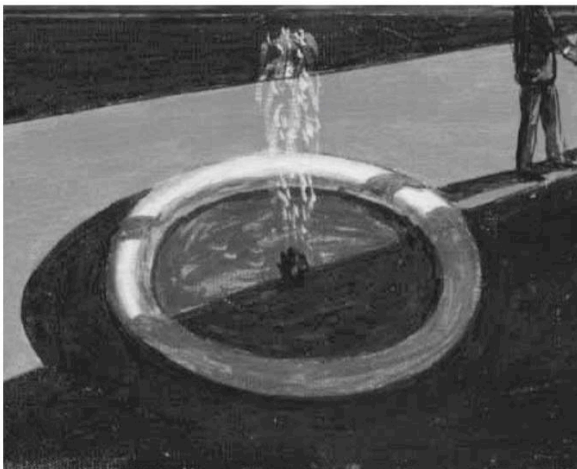
L'addio dell'amico che parte all'amico che rimane (1950)