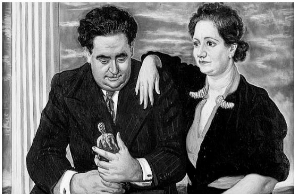
Ritratto dei coniugi Bellini (1932) G. De Chirico