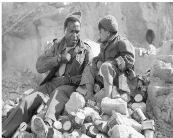
Paisà (1946) de Roberto Rossellini