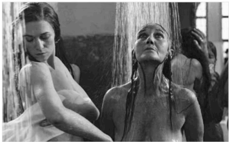
Golden Door (2006) E.Crialese