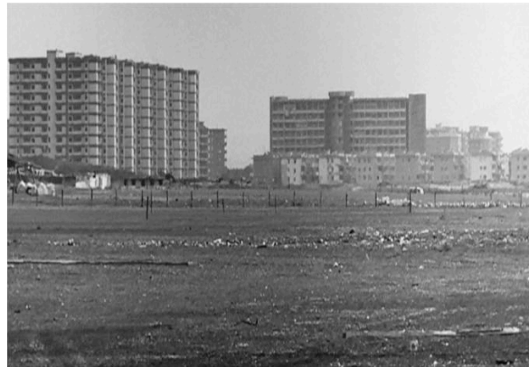
L'étrange monsieur Peppino (2001) M. Garrone