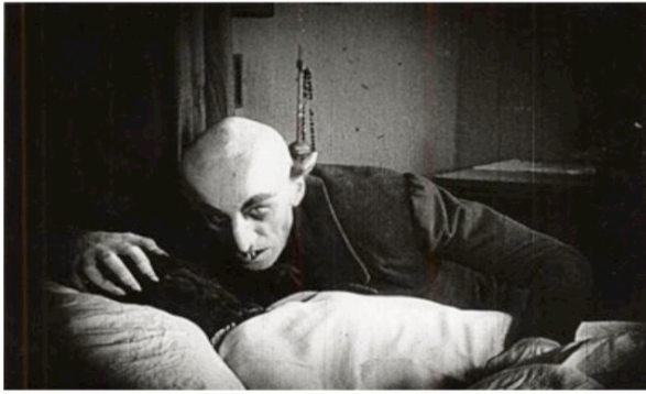
Nosferatu le vampire (1922) F.W.Murnau