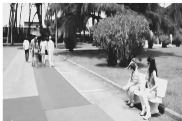
Reality (2012) M. Garrone

Pour ce qui concerne les créations en or de Vittorio dans Primo amore , elles sont comparables aux sculptures longilignes, quasi-abstraites et surréalistes, de Alberto Giacometti. L'artiste, tout comme le personnage de Garrone, dépouille ses œuvres de leurs formes pour rendre leurs traits distinctifs méconnaissables. Vittorio, en revanche, applique les mêmes techniques sur le corps de sa compagne qu'il façonne avec abnégation pour la transformer en l'objet de ses fantasmes 507 . Vittorio, tout comme Peppino ou d'autres personnages garroniens de Naples, est un monstre, qui semble issu des jardins de Bomarzo, un complexe monumental où l'on retrouve des sculptures extravagantes et effrayantes. À mi-chemin entre le réel et le fantastique, ce parc contient des personnages qui semblent issus d'une fable noire 508 .