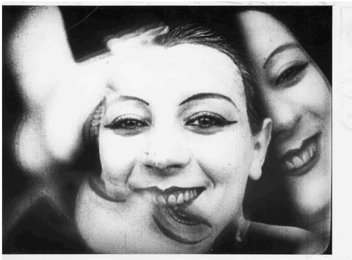
Ballet mécanique (1924) de Dudley Murphy et Fernand Léger

Son évolution lui permet de dépasser les capacités de l'œil humain. Il découvre et il nous montre des réalités que l'humain même n'arrive pas à percevoir, il capture le mouvement dans les choses qui nous semblent immobiles, les détails fixes de celles qui sont trop rapides, il nous donne une image claire du microscopique comme du macroscopique. Le cinéma ouvre les champs du possible et du visible et multiplie le réel le déclinant à l'infini 34 .