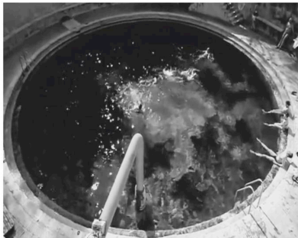
Primo Amore (2004) M. Garrone G. De Chirico (détail)