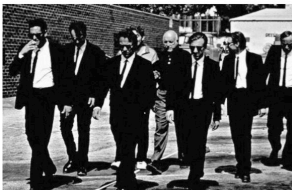
Reservoir Dogs (1992) Q. Tarantino

Le cinéma européen est seulement l'une des sources d'un cinéaste qui apprécie des auteurs américains tels que Paul Thomas, Jim Jarmush, Wes Anderson et les frères Coen. Dans This Must Be the Place , il s'inspire du style de ces deux derniers, proposant une œuvre post-moderne au style européen et américain 485 . Pour Les Conséquences de l'amour il retravaille les mouvements de caméra en s'inspirant de Ghost Dog (1999) de Jarmush, un film d'action au ralenti qui laisse place à la réflexion. Généralement il s'inspire du style cinématographique « pulp 486 » dont Tarantino est le maître incontesté. Le nom de ce cinéaste, tout comme celui de Oliver Stone et de Martin Scorsese, revient souvent quand on observe la filmographie de Sorrentino : dans Il divo , les citations visuelles faisant référence au cinéma tarantinien sont nombreuses : le film débute par une explosion de violence inouïe 487 .