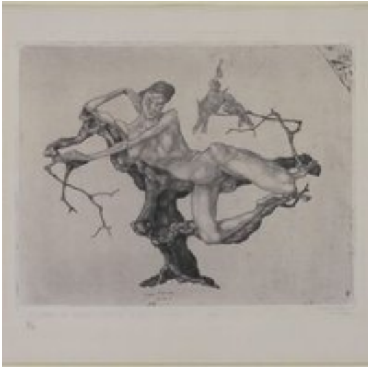
Annexe 6 Paul Klee, Virgin in the Tree , gravure 23,7 x 29,7 cm, New York, MoMA.