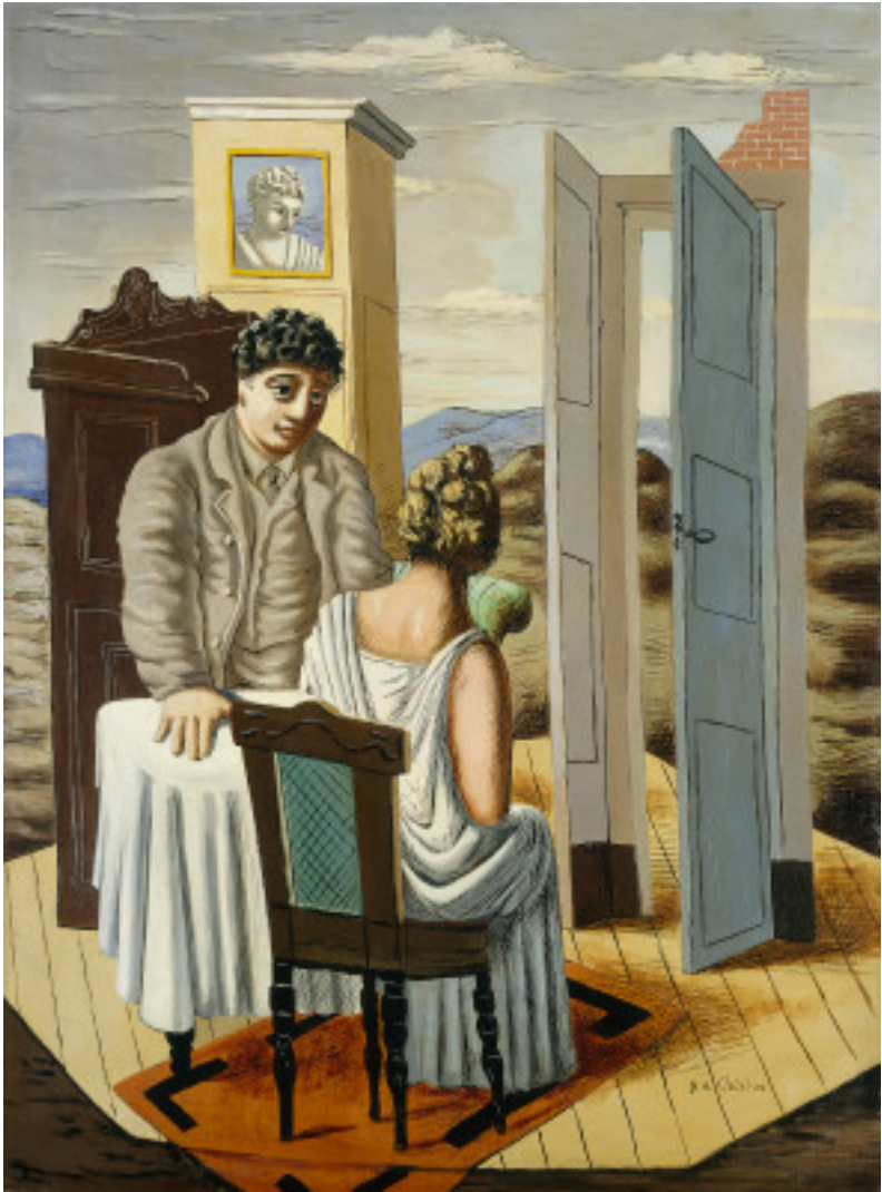
Annexe 8 Giorgio De Chirico, Conversation Among the Ruins , 1927, huile sur toile 130,5 x 97,2 cm, Washington D.C., The National Gallery of Art.