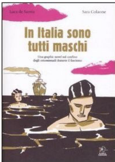
1 ère édition, 2008