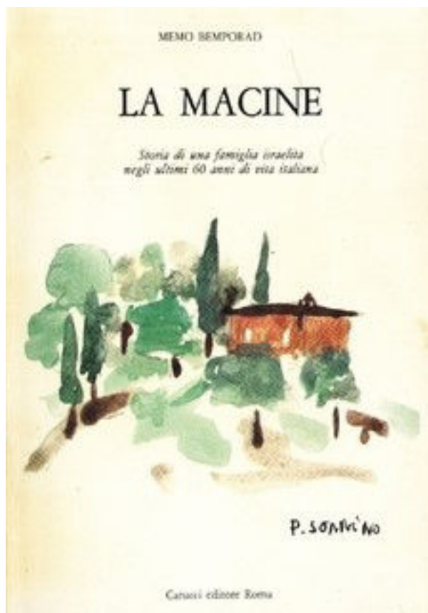
Memo BEMPORAD, La macine , Rome, Carucci, 1984

(illustration de couverture de P. Sonnino)