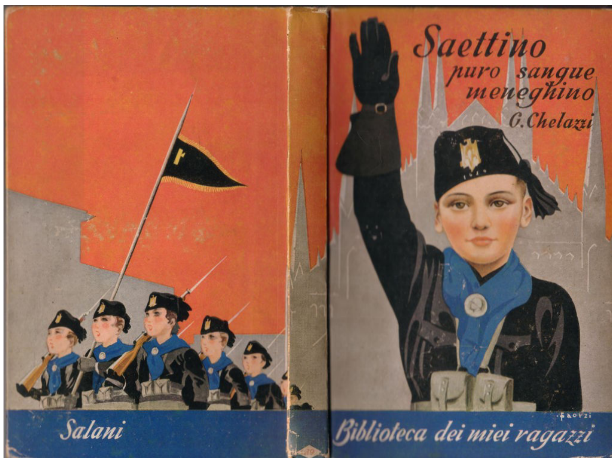
Gino CHELAZZI, Saettino puro sangue meneghino , Florence, Salani, 1938

(couverture cartonnée, illustration de Fiorenzo Faorzi)