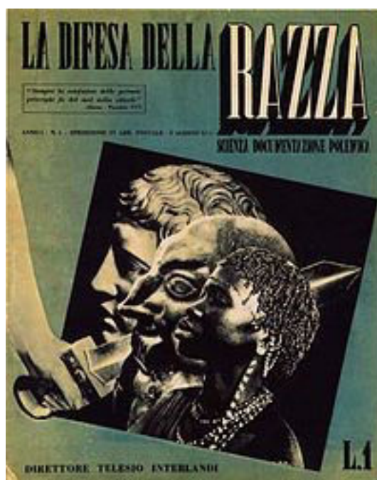
Couverture de La Difesa della razza (premier numéro, 1938)

analyse à cet outil de propagande et explicite le rôle de cet organe de presse, dirigé par Interlandi, antisémite acharné qui mène un combat raciste depuis des années à travers son journal romain, Tevere . La revue, qui s'impose comme « la vitrine du racisme à l'italienne » 43 se fait notamment connaître par ses couvertures retentissantes et constitue une « banque d'images » importante pour le reste de la presse péninsulaire, encore peu habituée des questions d'antisémitisme et de racisme biologique. Le volet iconographique central du volume de Marie-Anne Matard-Bonucci reproduit un célèbre photomontage qui figurait sur les trois premiers numéros de la revue La Difesa della razza avec, plaqués en perspective le Doryphore de Polyclète, une statue antique de « Sémite » et une photographie d'Africain.