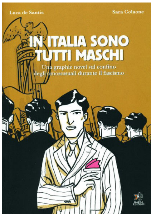
2 ème édition, 2010

Cette première de couverture répond à une logique de transfert, amplifiée de la première à la seconde édition, peut-être sous l'effet des perceptions du lectorat auprès duquel le roman graphique a trouvé le succès. Le rose des nuages qui pourraient troubler la tranquille baignade des hommes dans la première illustration s'inscrit désormais, dans la seconde édition, dans la pochette de couleur rose (soulignée par le geste du personnage) d'un homme qui regarde le lecteur mais auquel tous les autres hommes tournent le dos. Tandis que le lointain navire de la première édition devient, sous les regards du plus grand nombre, une sorte de canonnière, proche et surmontée d'un aigle monocéphale. Ces détails graphiques mobilisent alors une autre réalité historique que celle de la persécution des homosexuels sous le fascisme : ils symbolisent l'Allemagne et évoquent les triangles roses du système concentrationnaire nazi, dont a témoigné Heinz Heger dans Gli uomini col triangolo rosa .