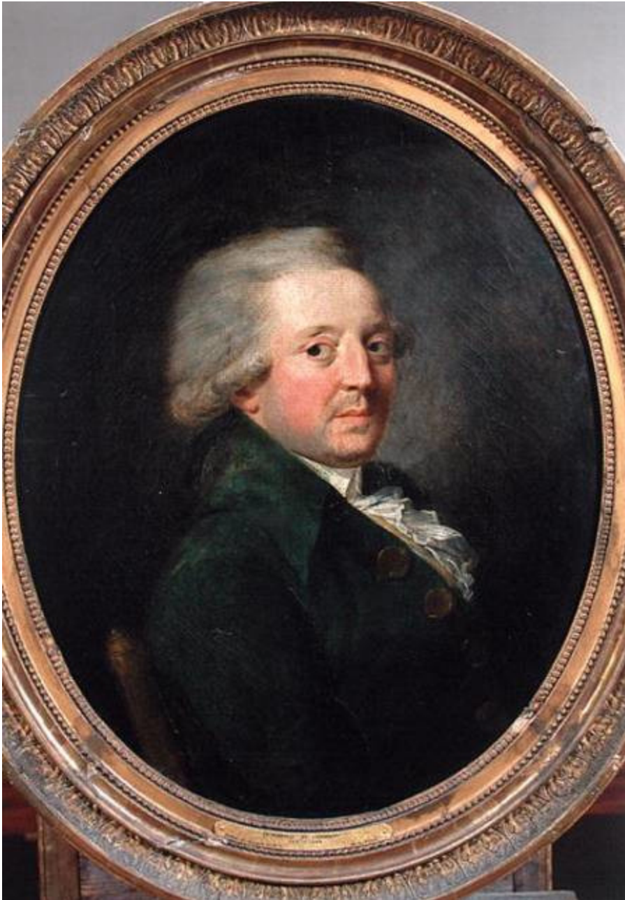
FIGURE 1 – Portrait de Marie-Jean-Antoine-Nicolas de Caritat (1743-1794) Marquis de Condorcet par Jean-Baptiste Greuze (1725-1805) - (Musée national du château de Versailles)