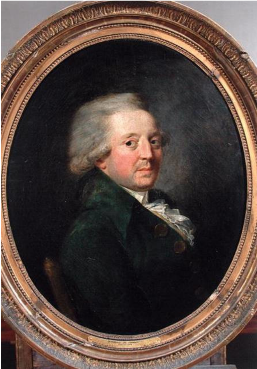
FIGURE 1 – Portrait de Marie-Jean-Antoine-Nicolas de Caritat (1743-1794) Marquis de Condorcet par Jean-Baptiste Greuze (1725-1805) - (Musée national du château de Versailles)