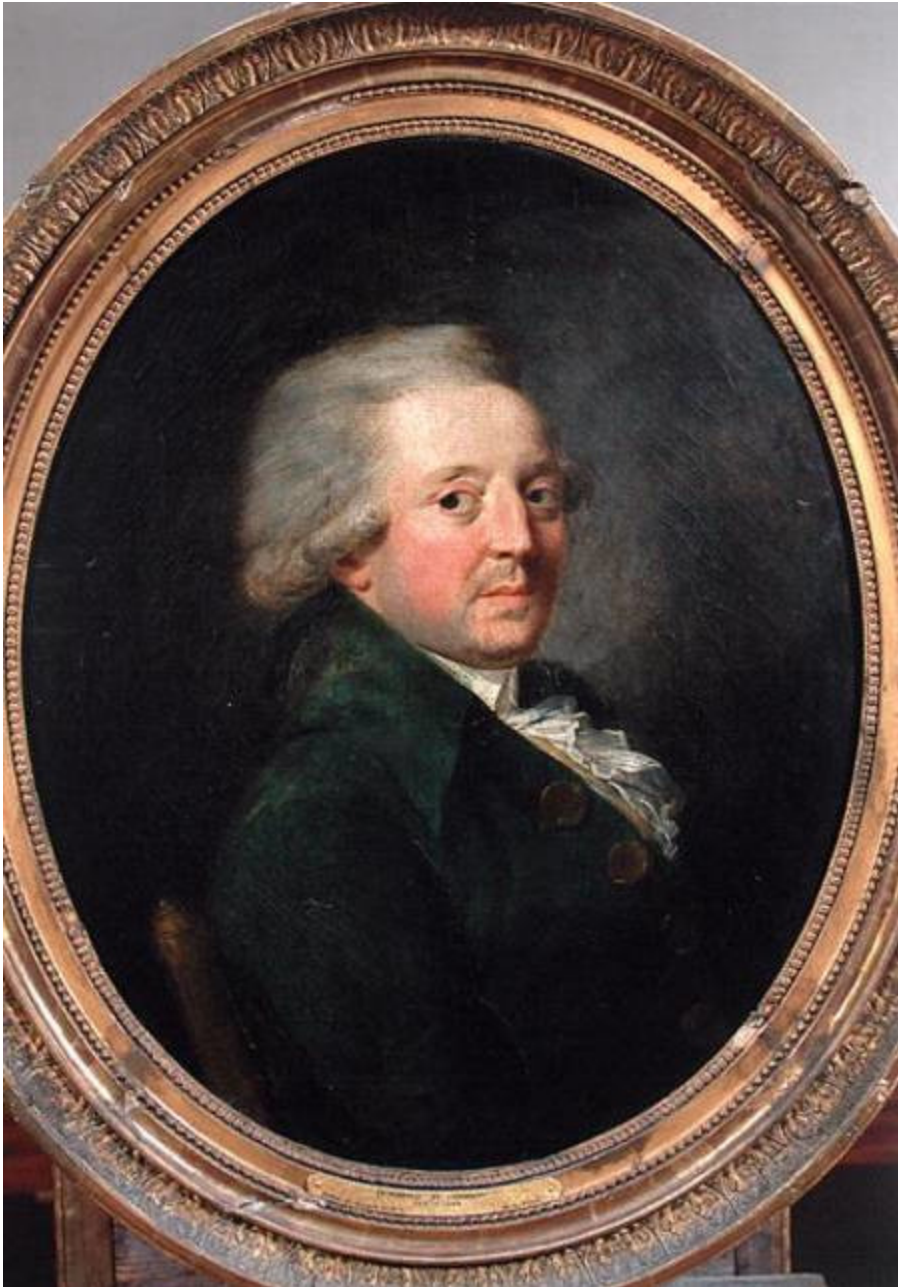
FIGURE 1 – Portrait de Marie-Jean-Antoine-Nicolas de Caritat (1743-1794) Marquis de Condorcet par Jean-Baptiste Greuze (1725-1805) - (Musée national du château de Versailles)