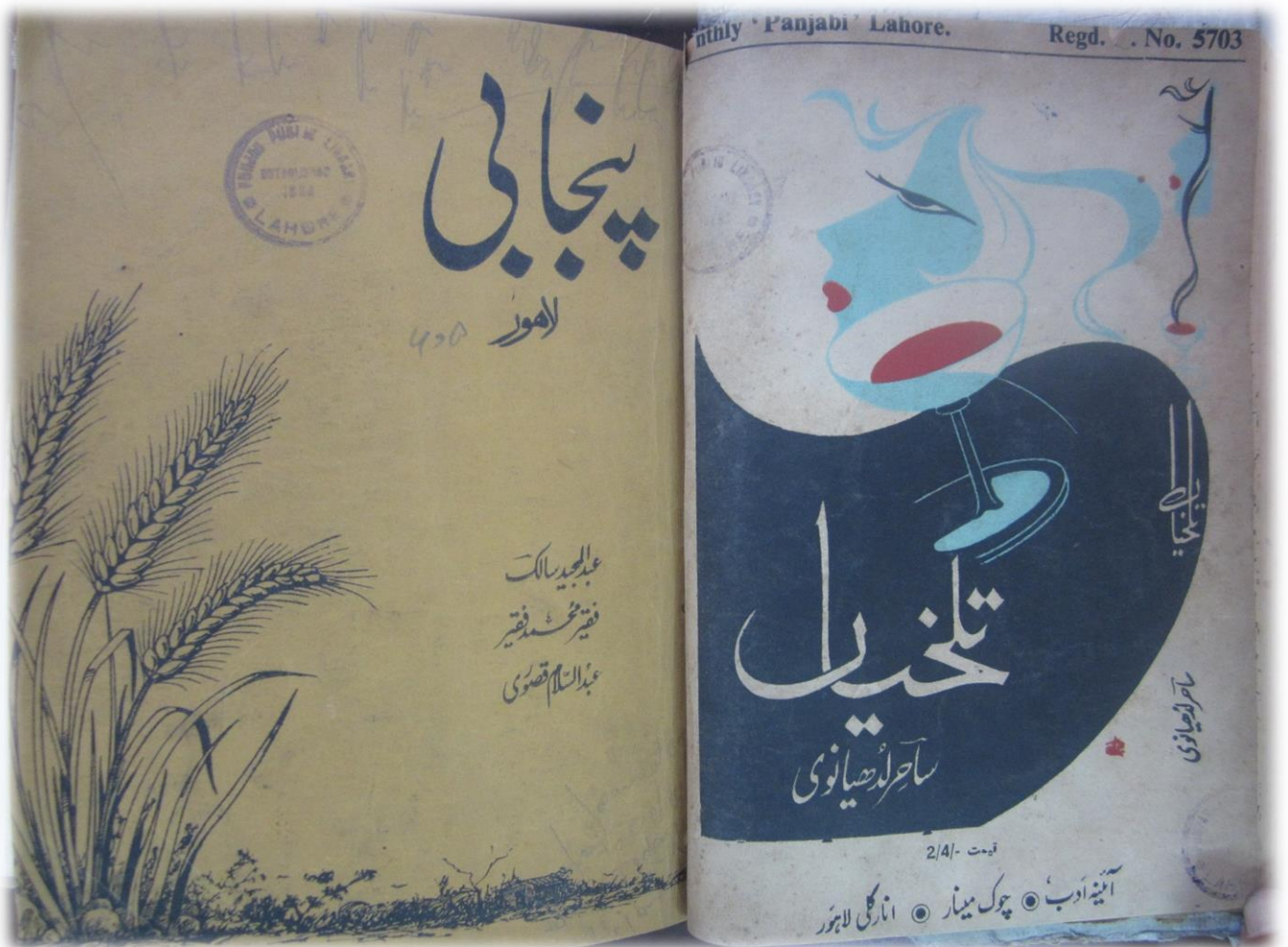
Annexe 2 : Couverture et dernière page du numéro de mai- juin 1959 de Panjābī