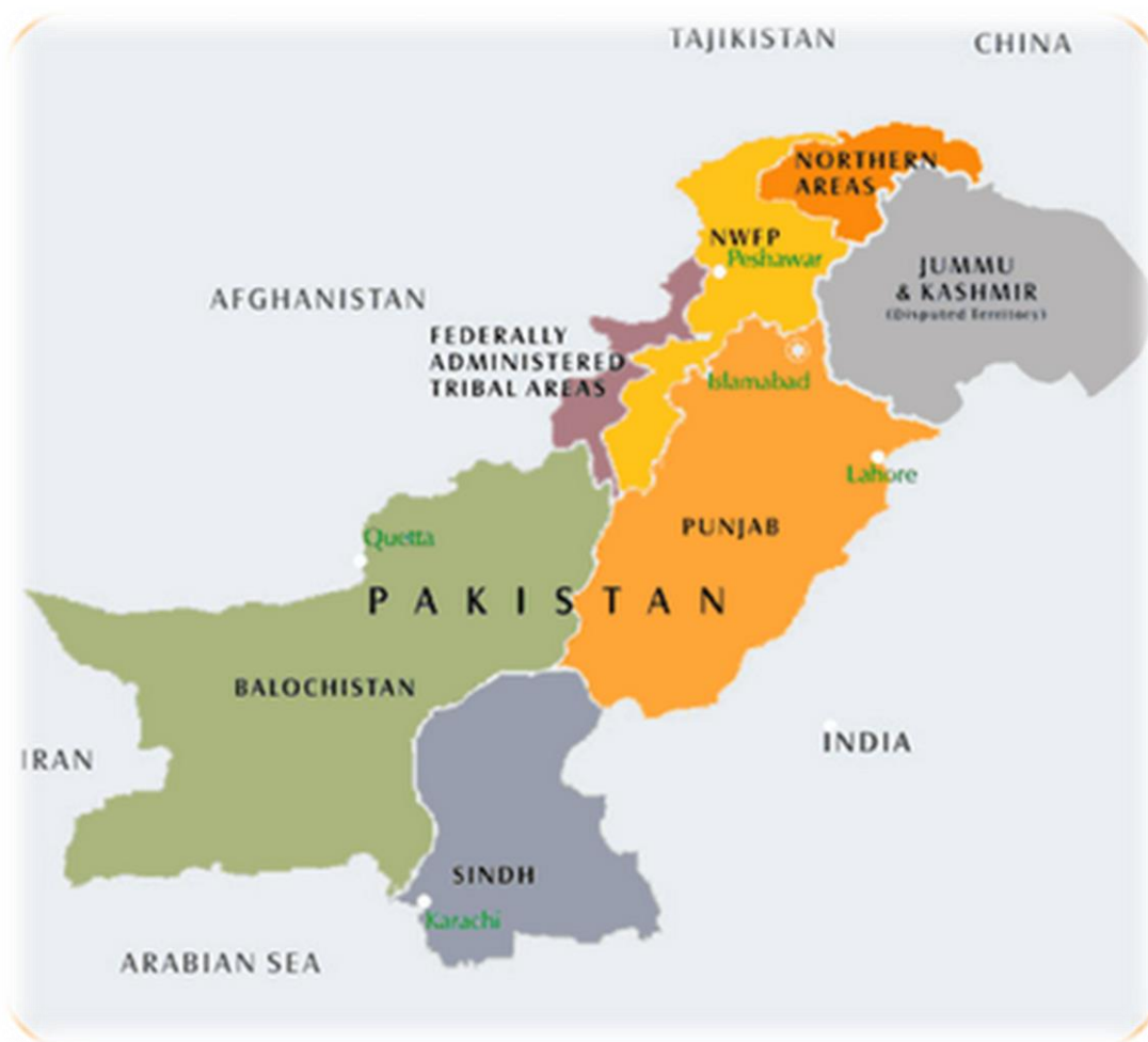
Illustration 2 : Les provinces du Pakistan occidental