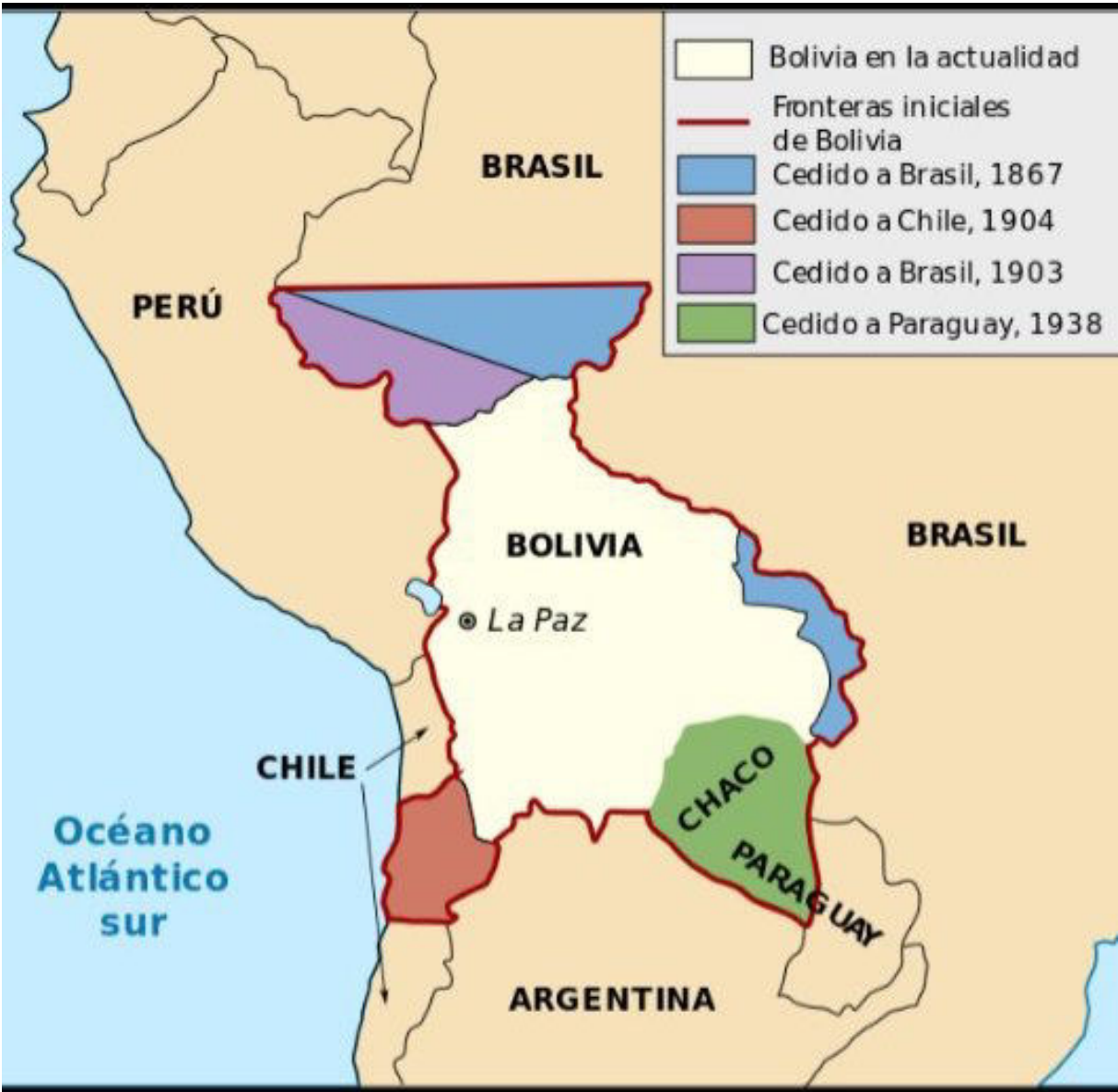
Carte du territoire de la Bolivie à son indépendance en 1825