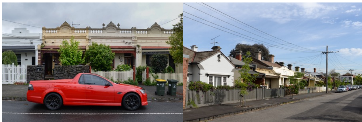
Figures c et d : Le paysage périurbain de la ville de Yarra, les terrasses victoriennes abritent des façades et une rue résidentielle basse, novembre 2017.

immeuble de grande hauteur à une expérience spatiale particulière du quartier péricentral, notamment à travers l'association du quotidien dans une tour à une expérience hôtelière. Cet agencement socio-spatial est plus ou moins accepté et adapté par les résidents et se manifeste par diverses tactiques et stratégies.