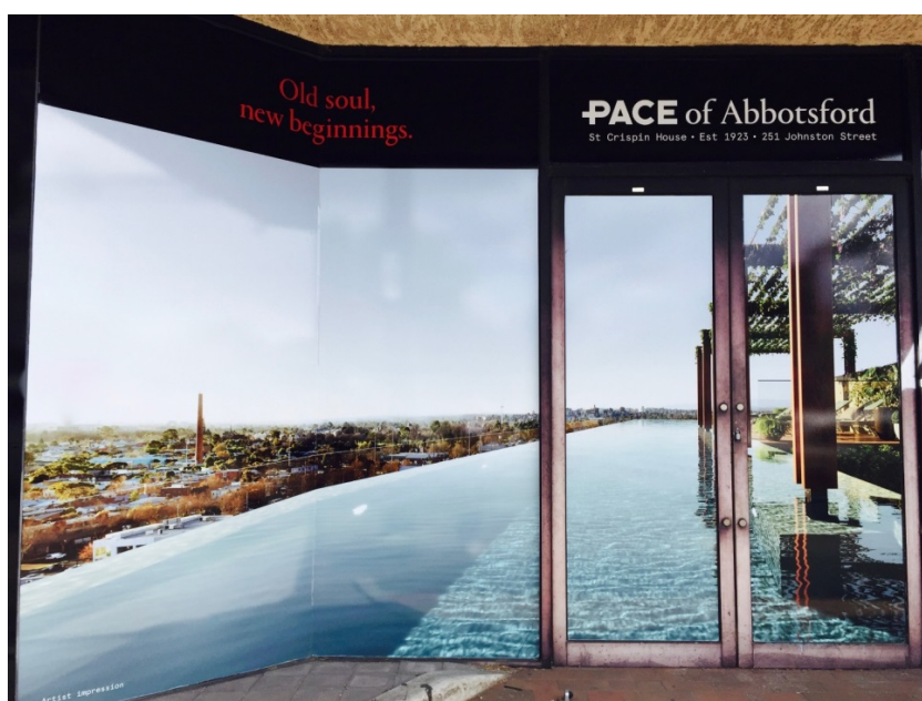
Figure a : « Old soul, new beginnings » : publicité pour un complexe immobilier à venir à Abbotsford, octobre 2017.

d'ores et déjà répandue à Sydney et à Melbourne chez les jeunes cadres célibataires de la classe moyenne, parfois désignés par l'acronyme « DINK » ( Double Income No Kids , deux revenus sans enfants), l'habitat dans les tours est en phase de devenir un mode de vie attractif en soi. Plutôt qu'un compromis « acceptable » (Nematollahi, Tiwari et Hedgecock 2016) dans lequel le couple maison-jardin est troqué pour les attraits de la vie urbaine, la vie en appartement est désormais présentée par les promoteurs immobiliers comme un style de vie sophistiqué et recherché incarnant un nécessaire renouveau des quartiers péricentraux (Figure a). En d'autres termes, la vie en hauteur dans les villes australiennes est devenue non seulement une configuration de logement acceptable pour une partie de la classe moyenne, mais également une fin désirable en soi. Cette thèse montre que cette forme de logement est à la fois désirée et désavouée, et explore de quelle manière l'habitat en hauteur influence la production de relations socio-spatiales dans les quartiers péricentraux de Melbourne.