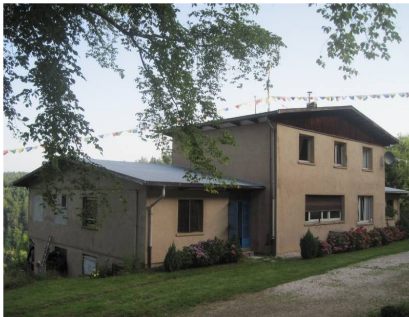
Figure 3 Le Centre monastique de Lusse de la Bodhicharya France , le 20/08/2012

En plus de cet ancrage urbain minimaliste, la Bodhicharya France s'est dotée comme nous le savons du Centre monastique de Lusse (Cf. Figure 3). Nous l'incluons dans la catégorie étique de temple. Sa raison d'être est de devenir propriétaire d'un lieu situé à la campagne pour les activités associatives selon Lama Tsultrim, à laquelle se joint la volonté de fournir un espace de vie aux moines et aux nonnes et de diversifier les activités dans la direction des séjours plus longs, les séminaires 1 .