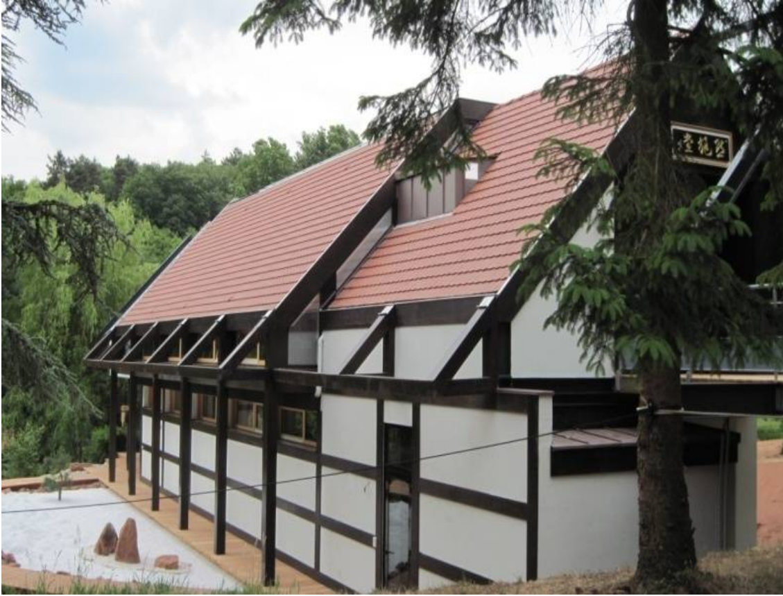
Figure 7 La Maison du Dāna au temple Ryumun Ji avec le jardin de pierres, le 14/05/2011

temple tout en gardant l'accès direct à partir de la rue (cf. Figure 7). C'est un bâtiment dit « la Maison du Dāna » (en français : la maison de don) qui sert de sanctuaire pour la méditation au rez-de-chaussée et de « chapelle » (en japonais : hattō ) au premier étage.