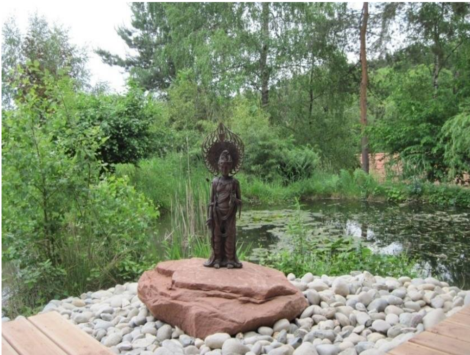
Figure 8 Le jardin du temple Ryumun Ji, le 14/05/2011

environs. On remarque notamment un jardin de pierres à gauche de la Maison du Dāna, espace composé de petites pierres blanches et de quelques petits rochers brun clair évoquant la symbolique bouddhiste. Dans la verdure entourant l'ensemble des constructions, des statues de Deshimaru, d'animaux à symbolique bouddhiste et d'autres personnages bouddhistes en pierre ou en bois de différentes tailles, sont installés sur les pelouses, au pied des arbres ou au bord de l'étang, comme celle de couleur foncée d'un personnage bouddhiste sur l'image (cf. Figure 8). Des outils pour la pratique rituelle (clochettes ou une grande cloche) sont accrochés aux entrées des différents bâtiments.