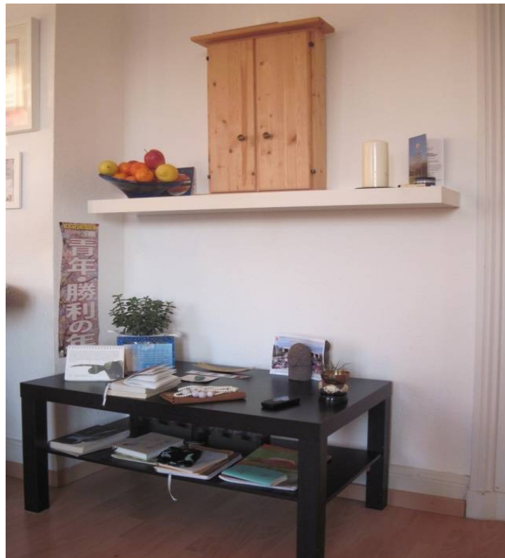
Figure 1 L'autel bouddhiste, appartement de Bianca, le 06/02/2012

L'autel lui-même (voir Figure 1 ci-dessous) se compose de divers objets. Sur une étagère supérieure blanche trône un petit placard en bois clair. C'est lui qui abrite l'objet de culte (en japonais : gohonzon ), un parchemin blanc avec un maṇḍala , une inscription en sino-japonais en noir sur blanc du titre du Sūtra du lotus . Plusieurs autres objets se trouvent encore dans la proximité immédiate de ce placard sur la même étagère : à sa droite une bougie blanche, un petit gong noir et une brochure de la Sōka-gakkai ; à sa gauche des offrandes de fruits, notamment de pommes, d'oranges et de citrons, ainsi qu'une autre brochure de la Sōka-gakkai .