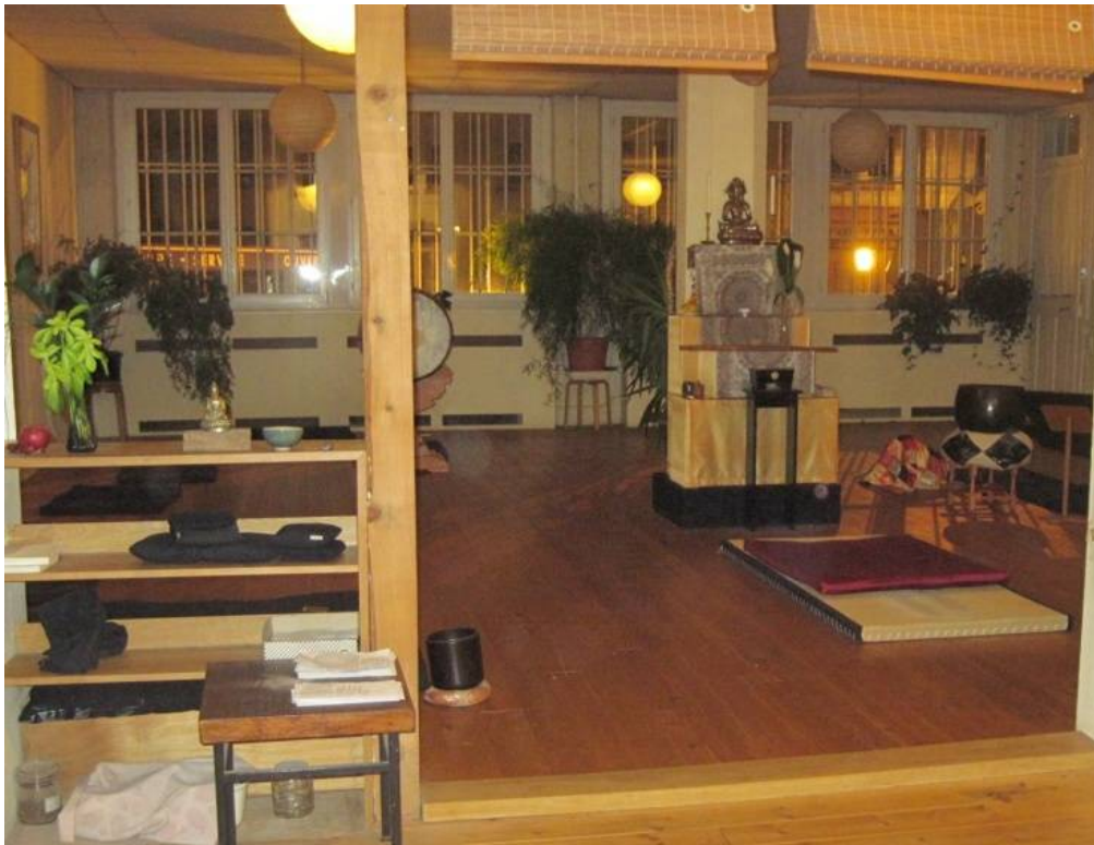
Figure 6 Le sanctuaire du Centre de bouddhisme zen de Strasbourg, le 20/11/2010

des motifs floraux et circulaires. L'endroit surélevé pour un moine se trouve à gauche de l'entrée par la structure en bois et celui du maître à droite, marquant la hiérarchie au sein du collectif bouddhiste. Au moment de la pratique rituelle, le sanctuaire se remplit encore de coussins et de tapis de méditation. L'autel abrite lui-même une statue du bouddha Mañjuśrī en bronze, de l'encens, des bols, deux bougies blanches sur des chandeliers dorés, une fleur verte aux pétales blancs et des fruits en offrande.