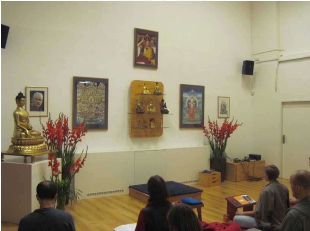
Figure 9 Le sanctuaire du centre de la Diamond Way à Prague, pratique rituelle individuelle en collectif, le 26/10/2011

La présentation de l'autel n'est pas négligée comme en témoignent ces propos du responsable du centre :