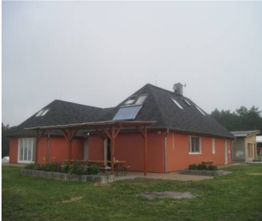
Figure 10 Le Centre de retraite de Těnovice de la Diamond Way , le 5/07/2012

D'autres travaux ont été entrepris au cours de ces dernières années pour agrandir les espaces 1 , en augmenter le confort 2 et pour diversifier l'accueil dans des chalets pour des retraites individuelles.