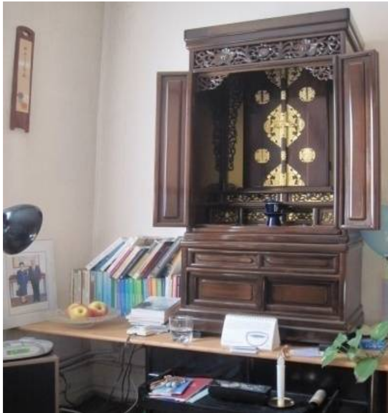
Figure 13 L'autel dans la pièce d'accueil de Bernard, le 16/02/2012

Contrairement aux autels qui se trouvent dans des pièces séparées chez Annie ou Bianca 1 (cf. chapitre 1), pratiquante de la même organisation, de caractères simples et élégants et pas nécessairement accessibles au tout venant, celui de Bernard est visible pour chaque visiteur et accuse une forme plus chargée et robuste : « [J]’ai eu l’occasion de prendre [acheter] ce grand autel, un peu style asiatique, style japonais, mais chacun fait comme il veut. Une simple boîte, bien sûr propre, bien faite, peut protéger le gohonzon [objet de culte], il n’y a pas de problème. » Tout en partageant le régime émotionnel tiède et les instructions normatives des objets qui figurent sur l’autel, Bernard tient à exprimer sa personnalité par lui. Cette matérialisation est influencée par l’esthétique caractéristique des classes populaires auxquels il appartient.