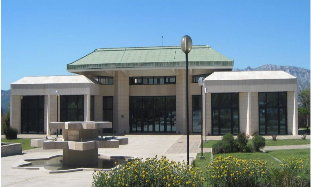
Figure 2 Le Centre bouddhique Soka Européen, hall principal, le 16/05/2012

En face de l'arrivée au temple, l'organisation a construit un bâtiment en trois ailes baptisé « Maison de l'Europe » : la première accueille la cuisine et la salle à manger, les autres sont occupées par des chambres – une centaine de pratiquants peuvent y être logés – et par une petite salle pour la pratique rituelle. Nous pouvons également poursuivre notre route sur notre droite. En prenant cette direction, nous parvenons à un bâtiment de style provençal qui a été construit avant le temple, et qui abrite le musée de la Sōka-gakkai au rez-de-chaussée et la chambre du maître à l'étage. L'organisation a en effet repris un terrain partiellement bâti en y rajoute de nouvelles constructions. Elle s'est ainsi réappropriée l'espace au lieu de construire de l'entièrement neuf que caractérise, selon Michel Pinçon et Monique Pinçon-Charlot, la démarche bourgeoise 1 . Derrière ce bâtiment se retrouve encore un autre qui renferme l'ancienne salle d'étude capable d'accueillir une cinquantaine de personnes, mais dont l'utilisation actuelle est plus restreinte.