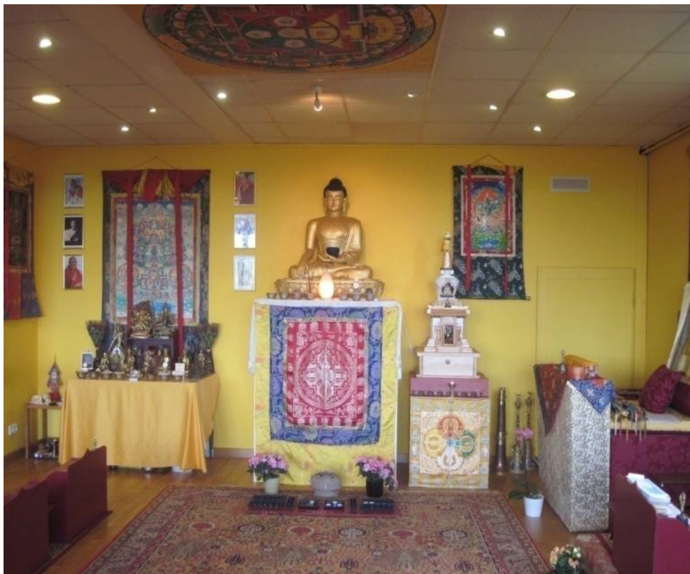
Figure 5 Le sanctuaire du Centre monastique de Lusse de la Bodhicharya France , le 15/09/2011

Le symbolisme religieux est le plus prononcé dans l'espace du sanctuaire (en tibétain : dgon-pa ) (cf. Figure 5) qui occupe la plus grande pièce du temple, et auquel on peut accéder par le réfectoire dont il est séparé par une porte vitrée opaque. Le sanctuaire sert exclusivement à la pratique rituelle et matérialise ainsi cette dernière comme l'activité principale du temple.