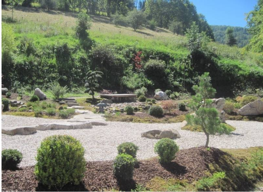
Figure 4 Le jardin japonais au Centre monastique de Lusse de la Bodhicharya France , le 18/08/2012

Si le jardin reproduit une esthétique japonaise, il symbolise selon l'organisation l'enseignement du bouddhisme tibétain. Son existence apporte une preuve supplémentaire de son rapport esthétique à la nature et de sa capacité, propre aux classes plus favorisées, de privatiser la nature 1 .